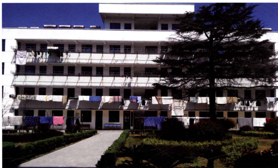
金沙镇敬老院老年大楼