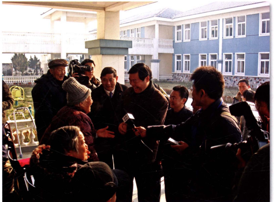
中共南通市委副书记、市长丁大卫等慰问川姜镇敬老院老人