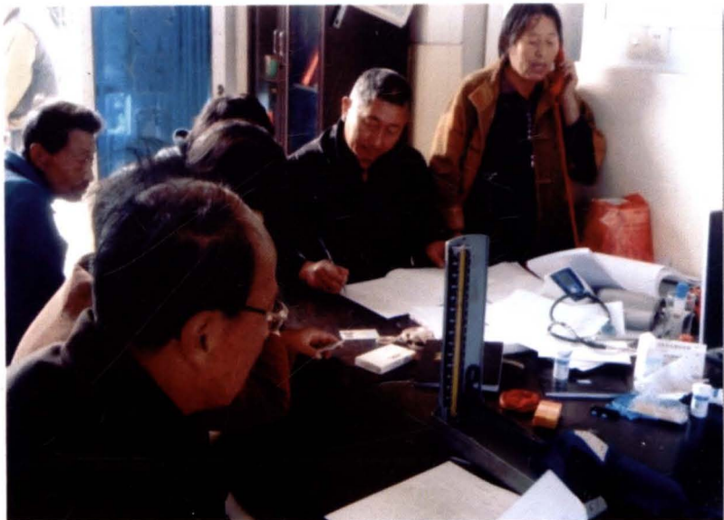
兴东镇政府组织医护人员为永庆村老年人体检