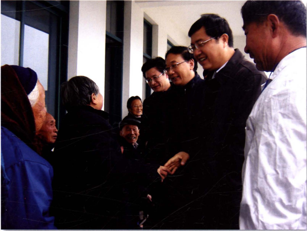
中共南通市委书记罗一民等慰问平潮镇敬老院老人