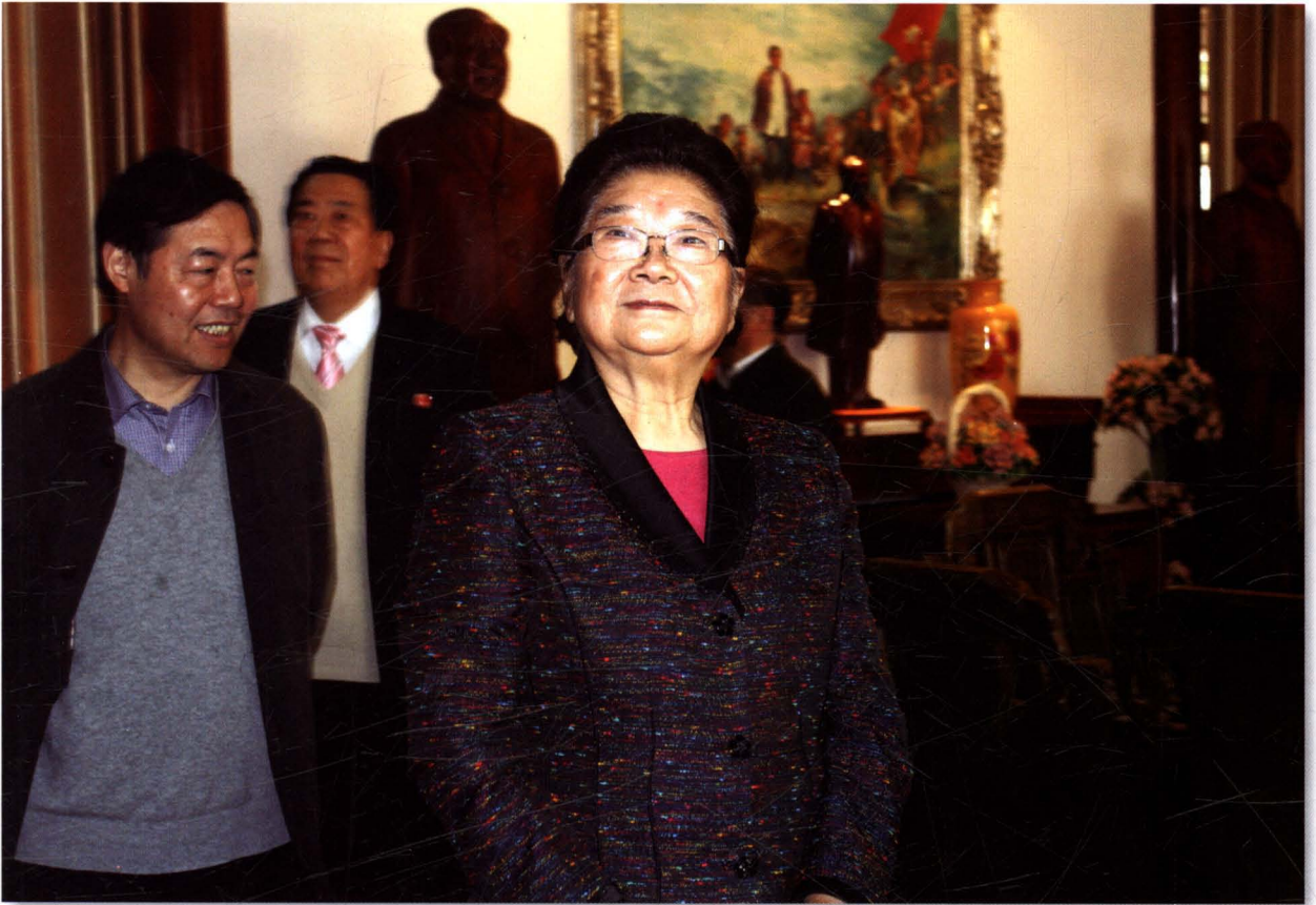
全国人大常委会副委员长顾秀莲一行视察通州，了解老龄工作。图为参观忠孝文化园