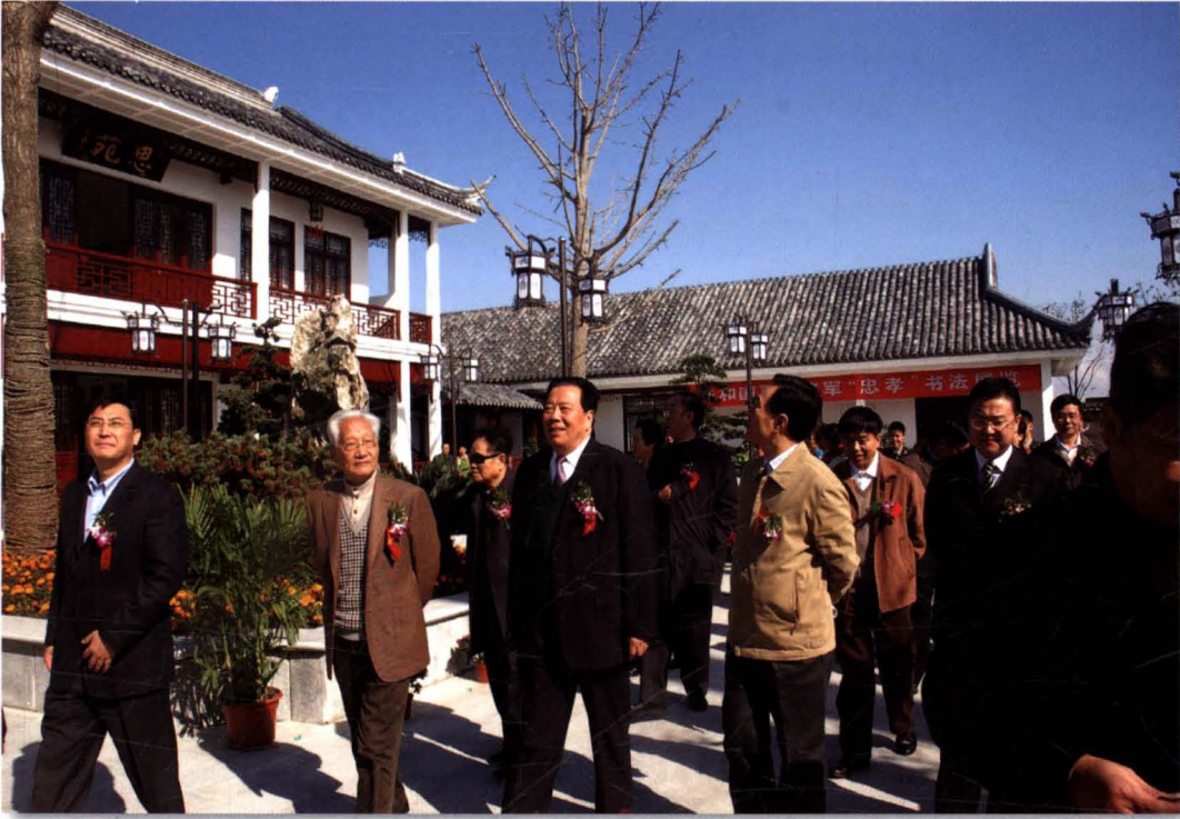
2008年11月,南京军区原政委方祖岐视察通州。图为参观忠孝文化园