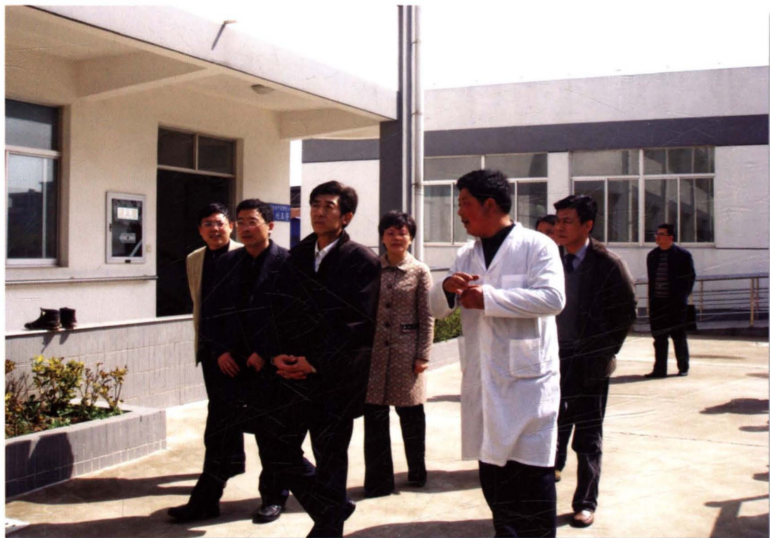
全国老龄办原副主任曹炳良一行考察通州开发区敬老院