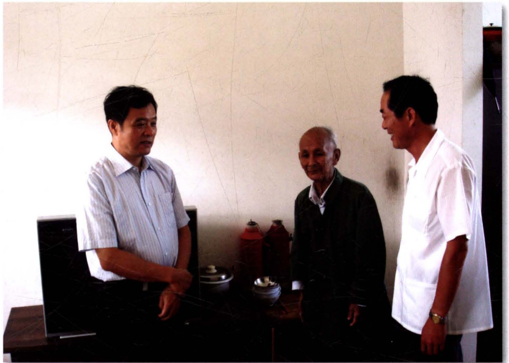
国家民政部领导视察通州。图为看望通州老人