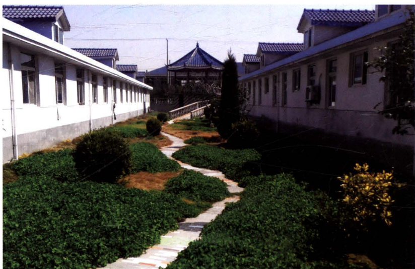
石港镇敬老院优美的绿化环境