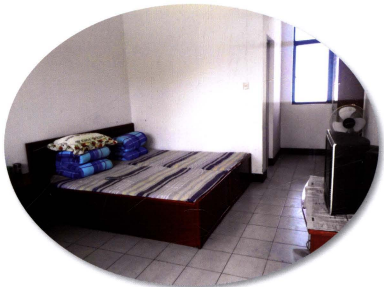
平潮镇敬老院明亮整洁的房间