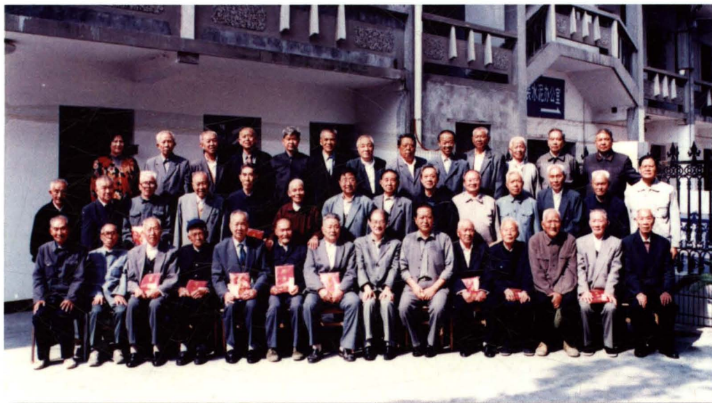
通州市举行健 康老人座谈会。图 为出席座谈会的老 人合影