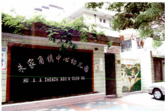
● 朱家角镇中心幼儿园