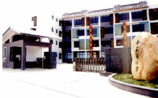
● 朱家角镇中心小学