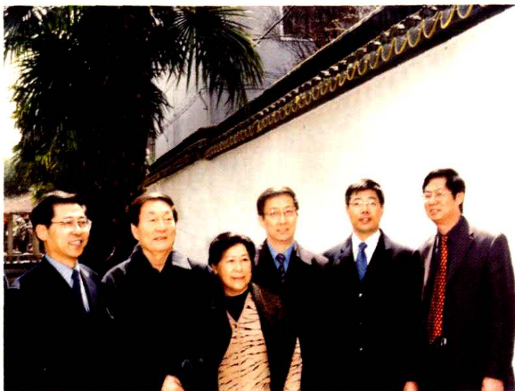
● 2004年3月30日,原国务院总理朱镕基(左二)与夫人劳安(左三)视察古镇朱家角,上海市市长韩正(右三)、中共青浦区委书记巢卫林(左一)、青浦区副区长张汪耀(右二)、朱家角镇镇长蒋晓红(右一)陪同视察