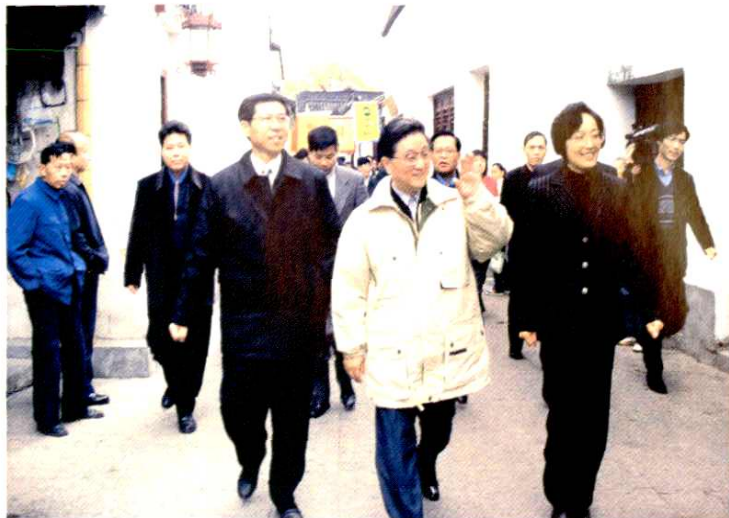
2002年11月8日,中共中央政治局委员,中共上海市委书记黄菊(前排中)视察古镇朱家角,中共青浦区委书记钟燕群(前排右一)、青浦区区长巢卫林(前排左一)陪同视察