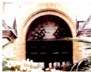
● 民国时期的一隅小学