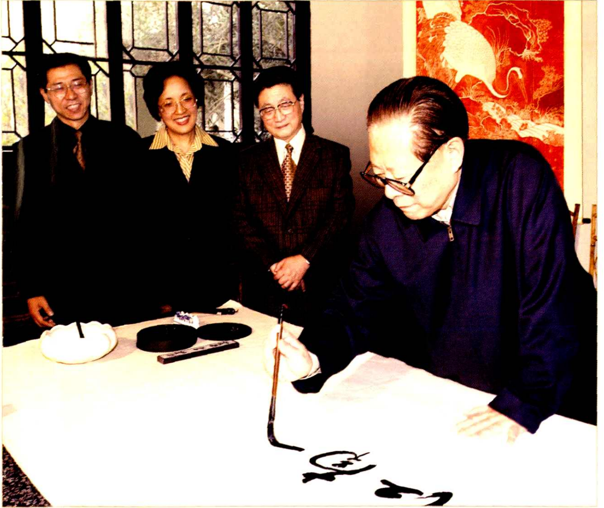
● 2002年3月19日,中共中央总书记、国家主席、中央军委主席江泽民视察朱家角镇,并欣然题词“江南古镇朱家角”,中共中央政治局委员、中共上海市委书记黄菊(左三)、中共青浦区委书记钟燕群(左二)、青浦区区长巢卫林(左一)陪同