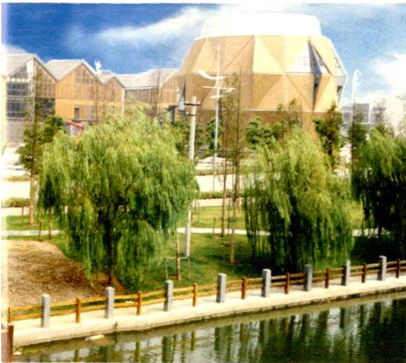
● 朱家角镇市民中心