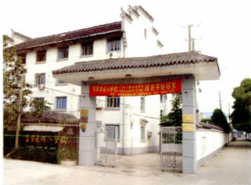
● 朱家角镇成人学校