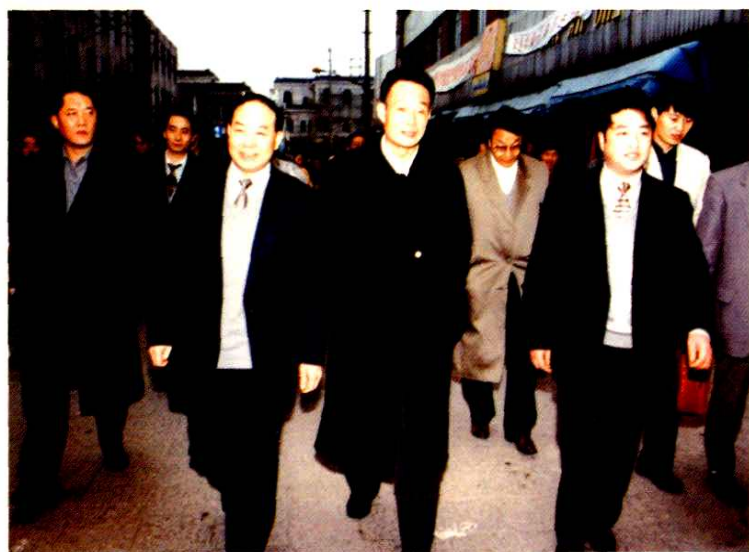
● 1997年2月15日,中共中央政治局委员、国务院副总理吴邦国(前排中)视察古镇朱家角,中共青浦县委书记李金生(前排左一)、中共朱家角镇委员会书记徐德明(右一)、朱家角镇镇长潘建彪(左一)陪同视察