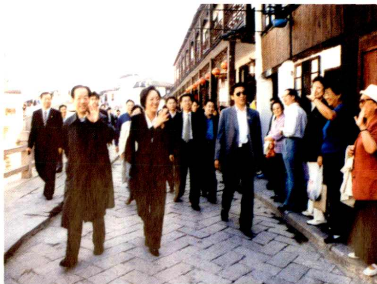
● 2001年10月17日,国务院副总理钱其琛(前排左一)视察古镇朱家角,中共青浦区委书记钟燕群(前排左二)陪同视察