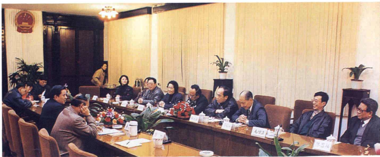
1996年1月，上海市高级人民法院听取政协委员对法院审判工作的意见。