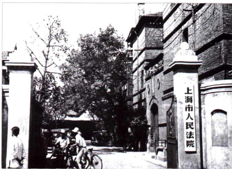
座落在浙江北路191号的上海市人民法院原址(1949年)。