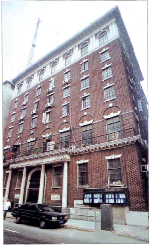
福州路 209 号 (1960 年)