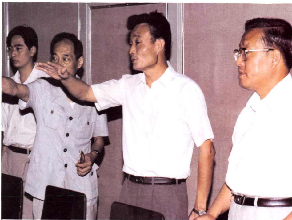
1993年9月10日，中共中央政治局委员、中共上海市委书记吴邦国（中）视察上海市高级人民法院。