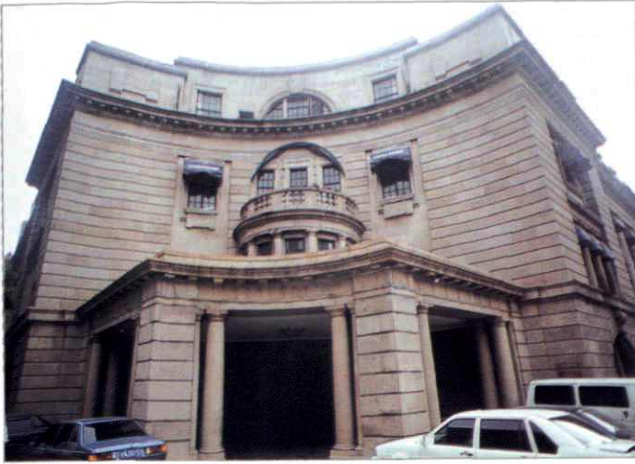
江西中路 215 号 (1956 年)