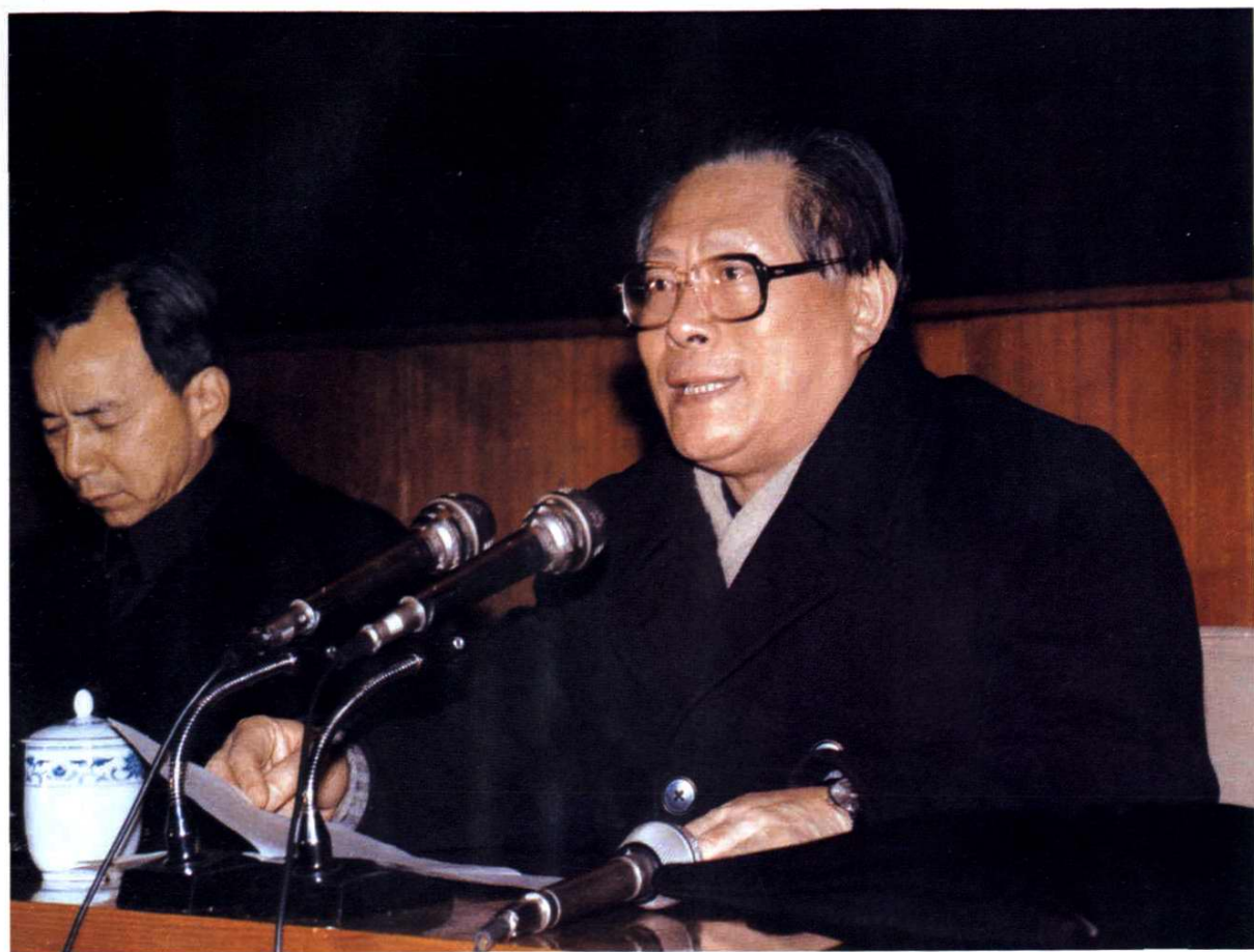
1986年1月21日，上海市市长江泽民在严惩严重经济犯罪活动的干部大会上作重要讲话。