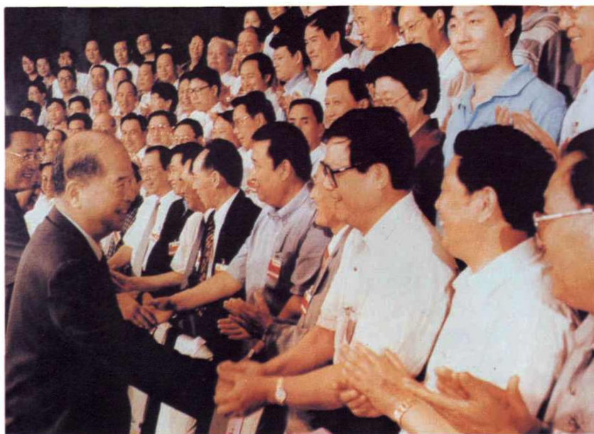
1998年7月3日，中共中央政治局常委尉健行接见全国高级法院院长会议全体代表时与上海市高级人民法院院长滕一龙亲切握手。