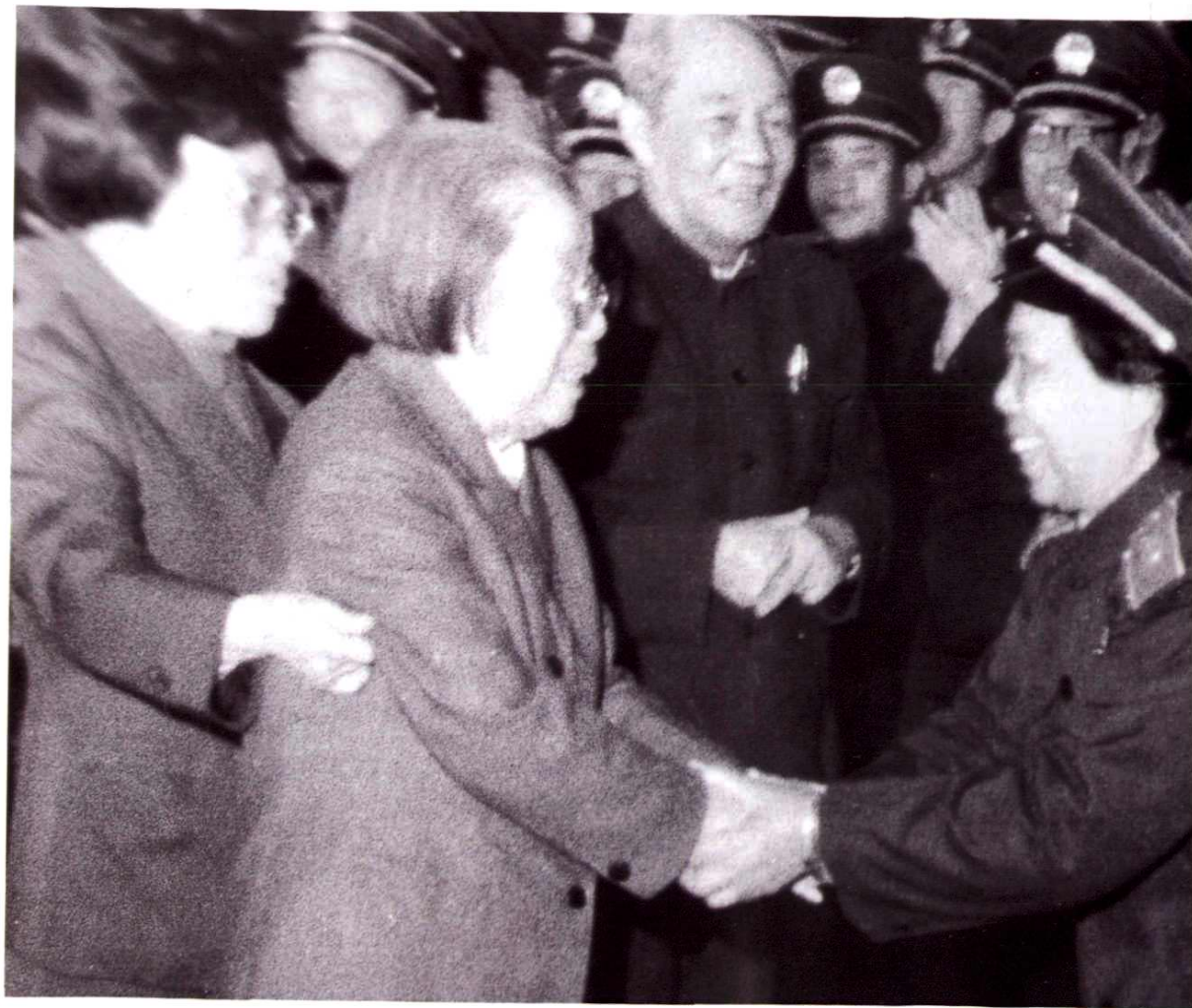
1985年2月，邓颖超等中央领导同志接见出席全国法院先进集体和先进工作者表彰大会代表时，邓颖超与上海市高级人民法院副院长何心如亲切握手。