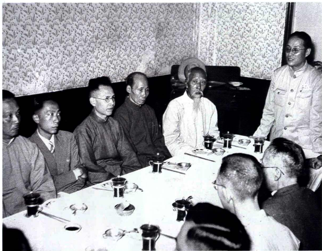
1949年6月17日，上海市军管会政务接管委员会法院接收处邀集上海法学教授及律师20余人进行座谈，交换关于今后如何执行全国统一的人民新法制，及上海在目前过渡期中如何建立人民法院等问题的意见。潘汉年副市长出席了大会并讲话。