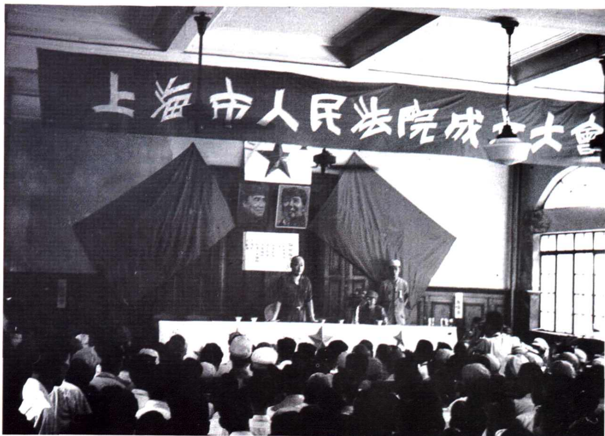
1949年8月11日，上海市人民法院宣告成立。