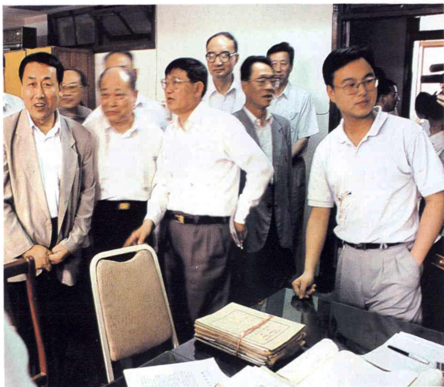
1991年6月7日，上海市人大代表视察高、中级人民法院。