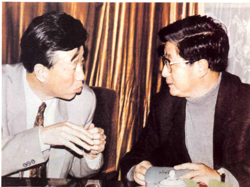
1995年12月12日，中共中央政治局委员、中共上海市委书记黄菊（右一）视察上海市高级人民法院。