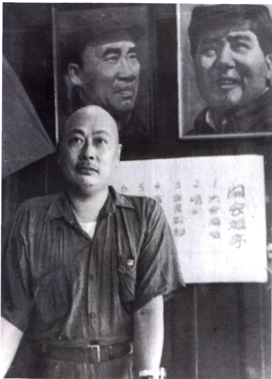
1949年8月11日，上海市军管会主任兼市长陈毅在上海市人民法院成立大会上讲话。