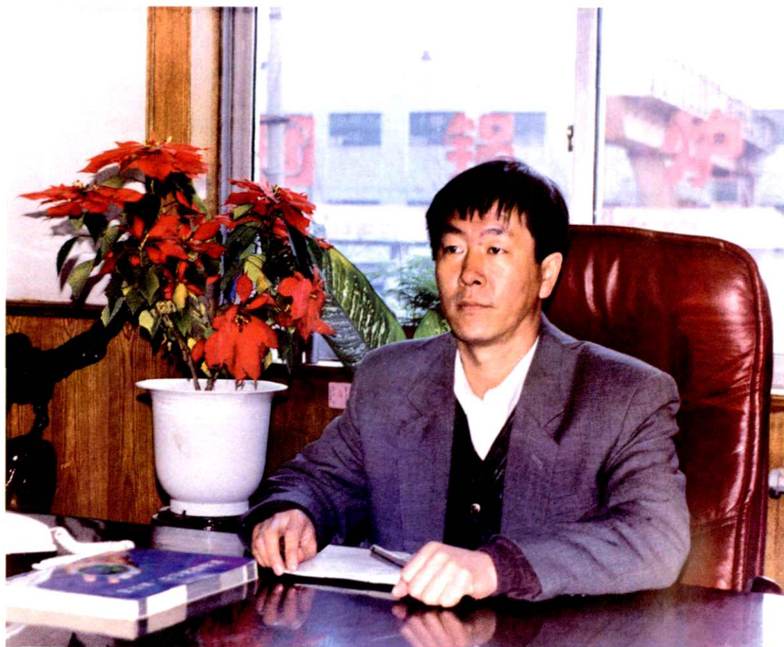
药山街道党委副书记、黄岗村党委书记 黄岗村民委员会主任、济南黄岗集团总经理