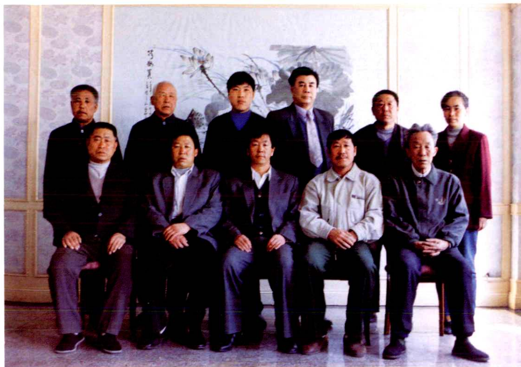
黄岗村志编纂委员会部分成员合影