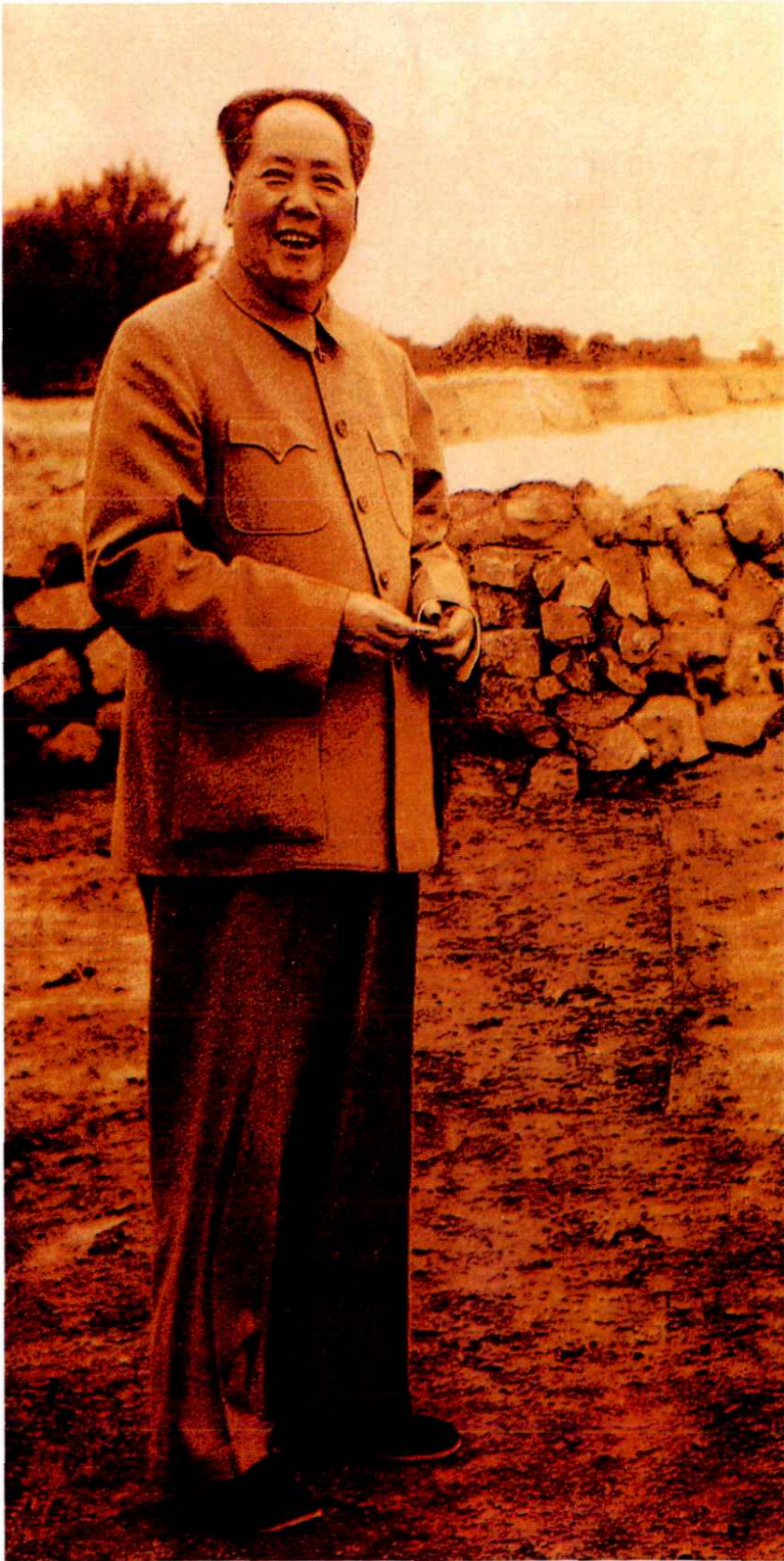
1959年9月，中共中央主席毛泽东在济南泺口视察黄河