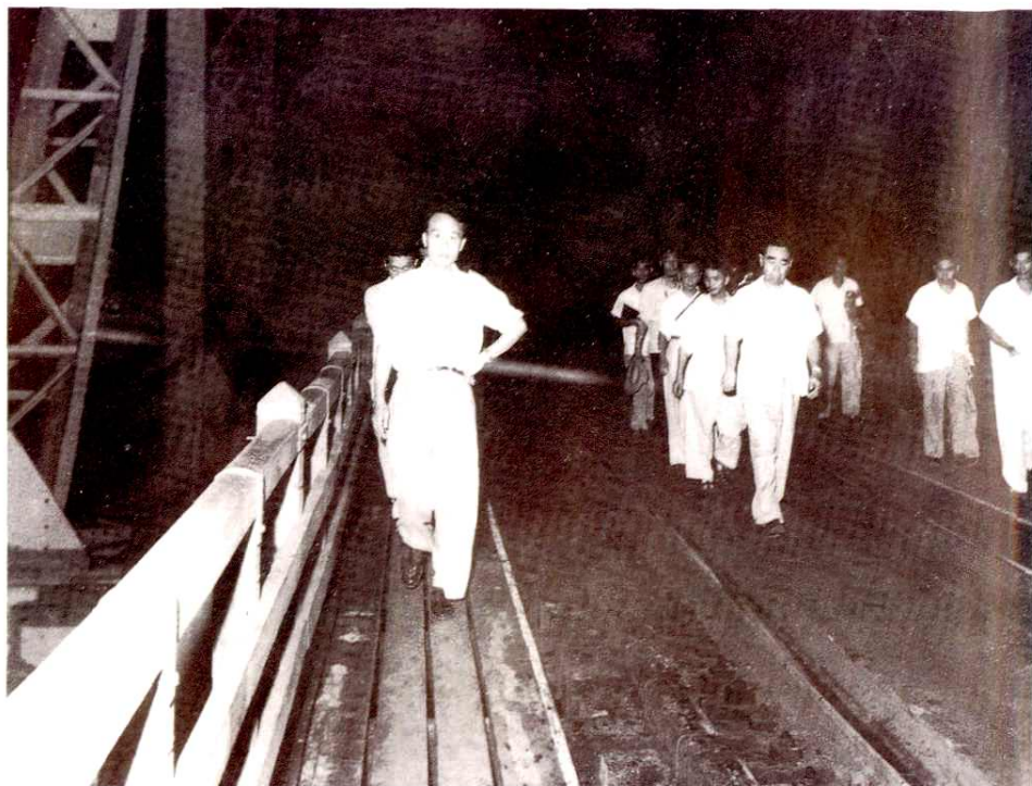
1958年8月6日，周恩来总理视察济南泺口黄河铁路大桥，对黄河防汛工作作了重要指示。图为周总理走在济南泺口黄河铁路大桥上