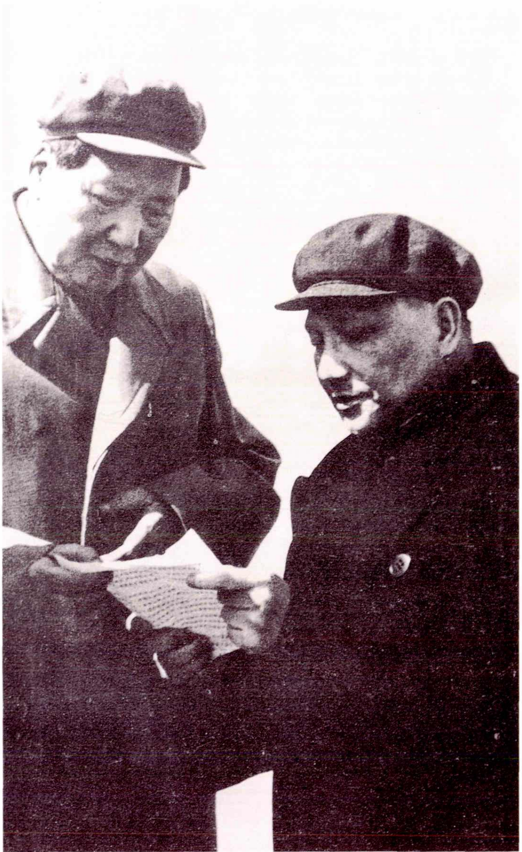
1959年3月3日·毛泽东和邓小平在济南黄河岸边