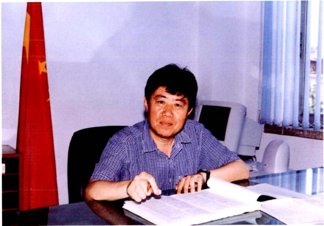
中共天桥区委书记杨庆林审阅《黄岗村志》