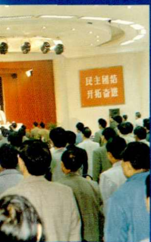
召开松江科学技术大会