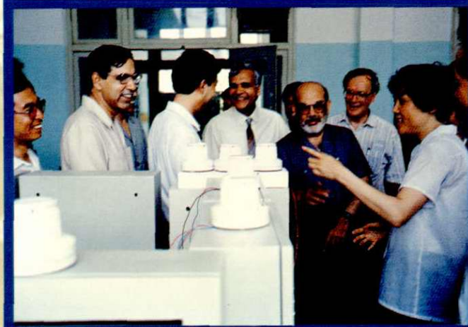
巴基斯坦政府 科技合作代表团与 加拿大专家代表团 考察松江电子仪器 厂。(1990.6.21)