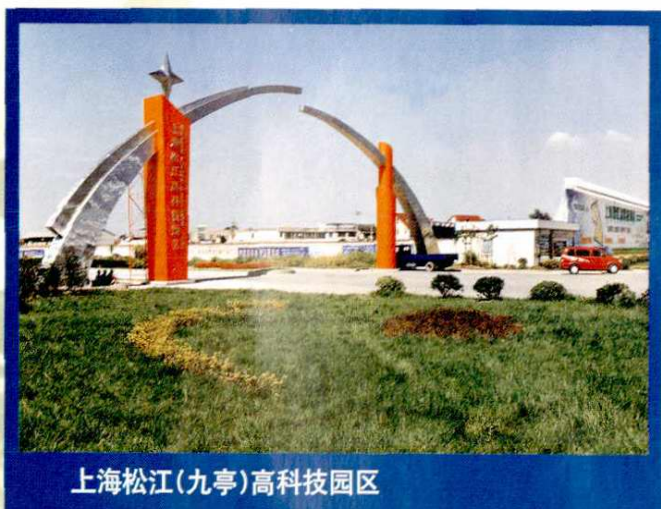
上海松江(九亭)高科技园区