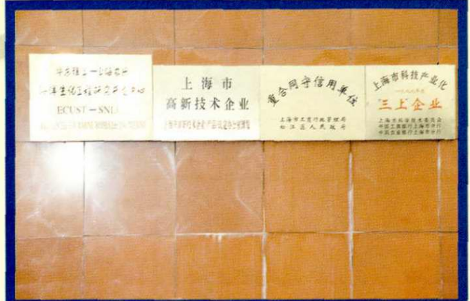
上海农乐生物制品股份有限公司