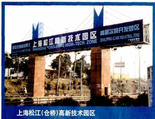
上海松江(仓桥)高新技术园区