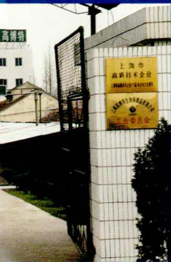
上海高博特生物保健品有限公司