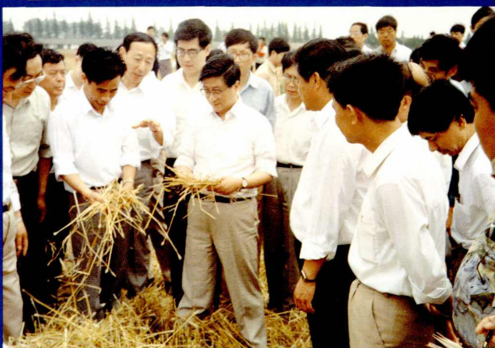
中共中央政治局委员、上海市委书记黄菊在县委书记杜家毫、县长沈效良陪同下，视察松江小麦高产示范方。(1998)