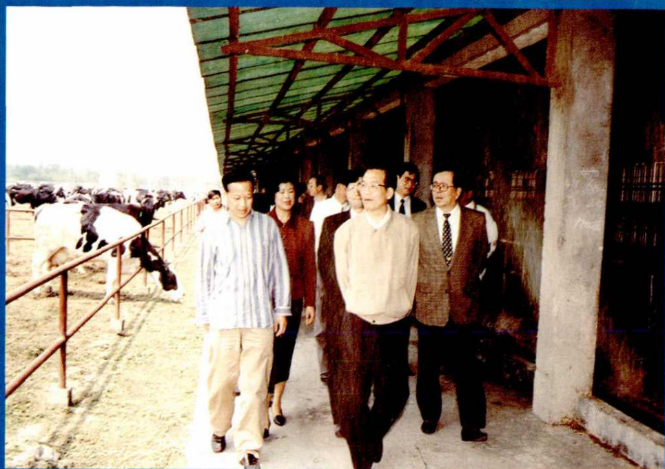
中共中央政治局候补委员、书记处书记温家宝和中共中央办公厅主任曾庆红由上海市委常委、副市长孟建柱陪同视察松江种奶牛场。(1996.5.1)