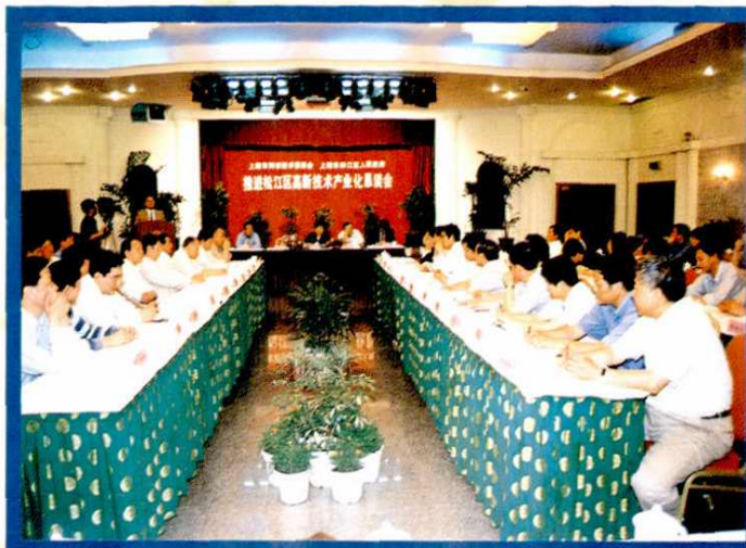
高新技术产业恳谈会