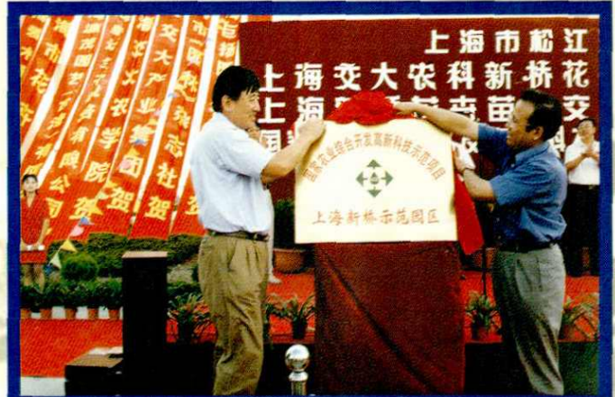
农业高新技术示范园区揭牌