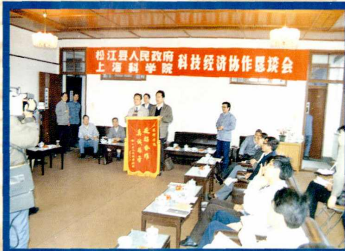
科技经济协作恳谈会