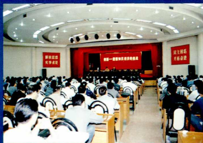
科技知识专题报告会