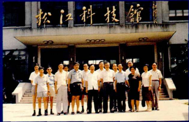
上海市科学技术委员会领导来松考察。 (1991.8.1)