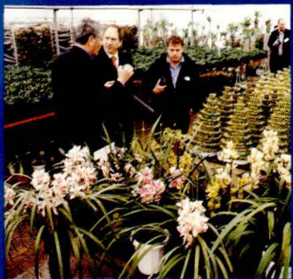
以色列农业专家考察松江新桥花卉基地。(2000.3.5)