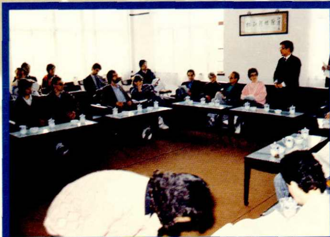
美、法、苏等 8国驻沪领事一行 29人考察松江科技 馆。(1989.4.8)