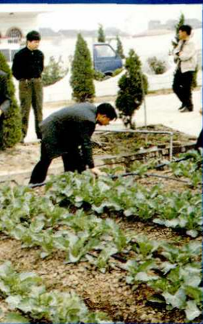
区科委领导考察九亭蔬菜园艺场