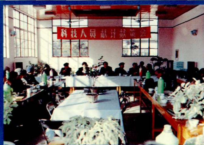
科技人员献计献策会