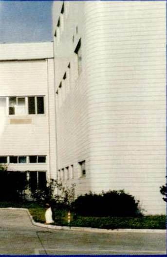
上海交大昂立股份有限公司