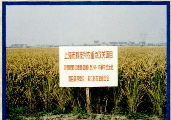
科技兴农重点攻关项目示范田