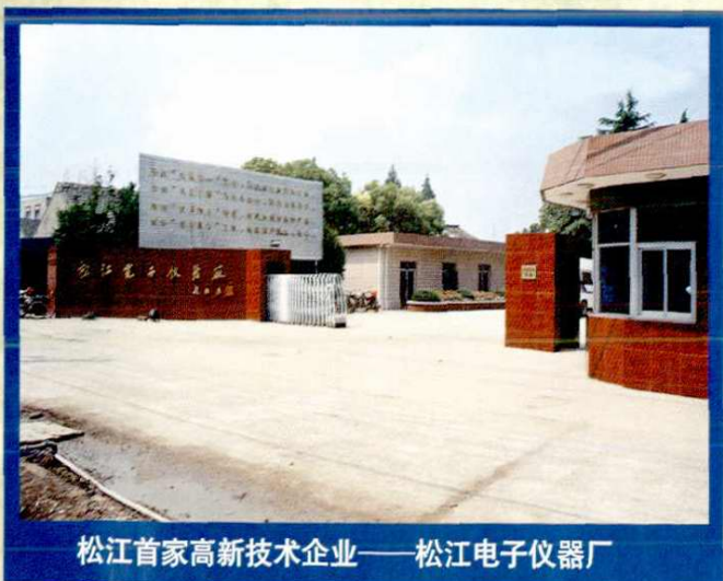
松江首家高新技术企业——松江电子仪器厂