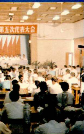
召开县科协代表大会