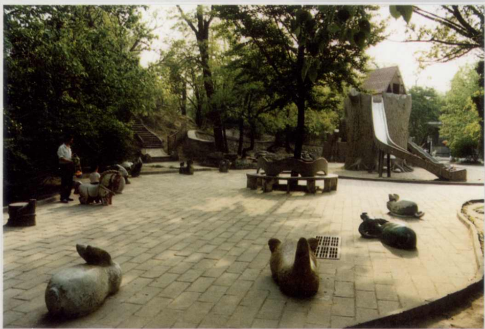
十二生肖游戏广场