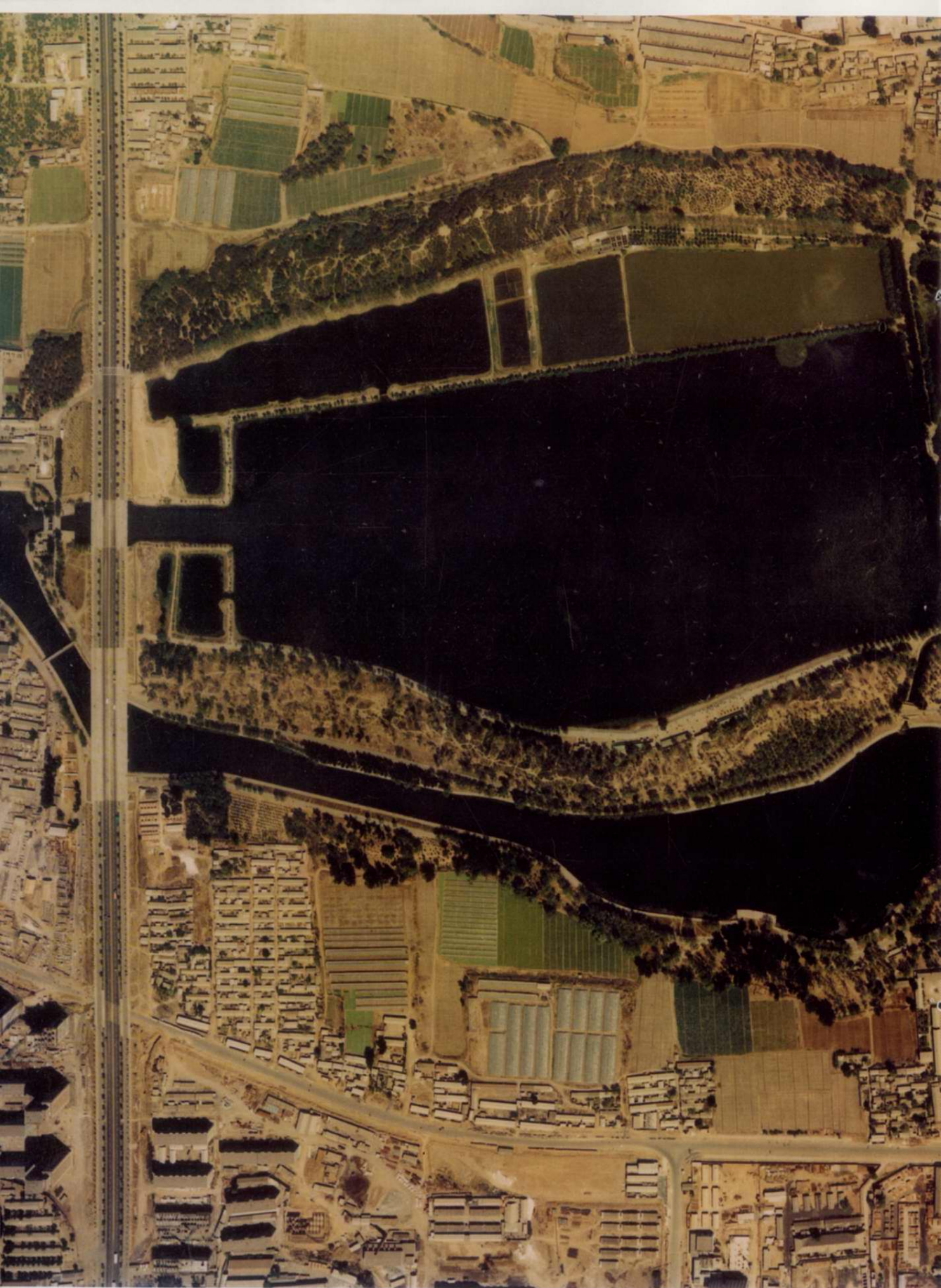
玉渊潭公园航拍 1983年