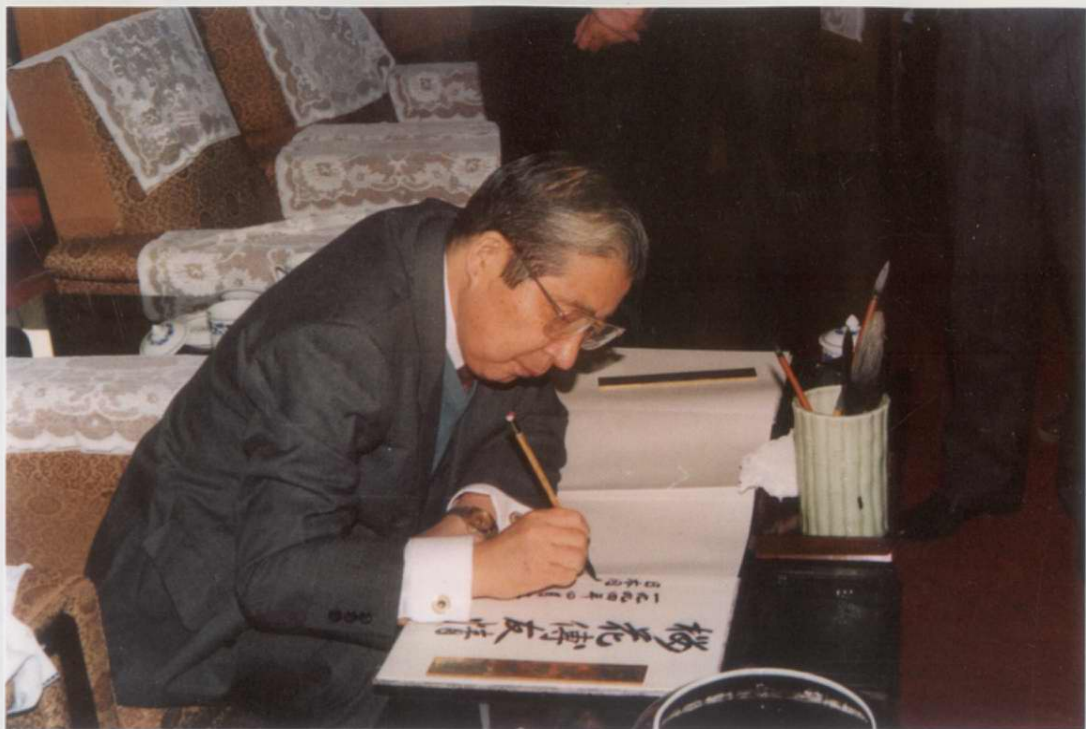
1994年4月9日日本驻华大使广道彦来园观赏樱花并签字留念