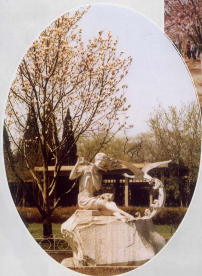
留春园“留春姑娘”雕塑