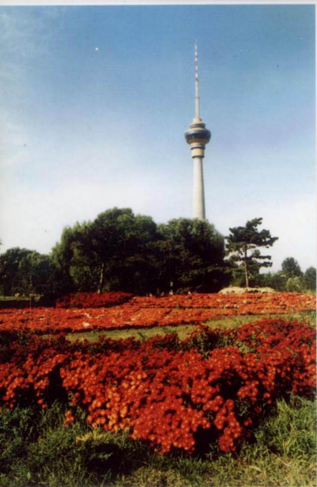
樱花园“菊光塔影”景观