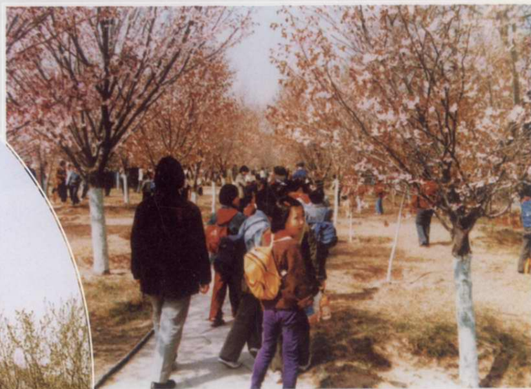
踏青赏樱——大山樱景区