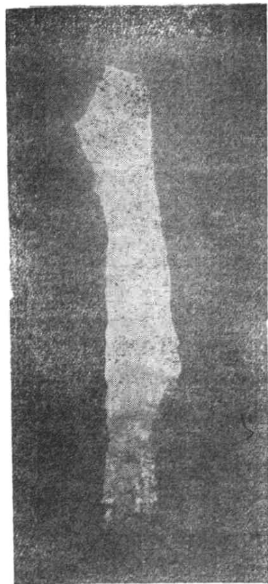
下龙桥，又称黑龙桥。

核桃公社境内，一山“逶迤如龙，下有空洞，即武龙山也”。武隆原武龙，因此山得名。武龙山，有雄伟壮观的三个天然溶洞相连，形若拱桥，统称龙桥，故又名龙桥山。图为龙桥三洞，常称上、中、下龙桥。