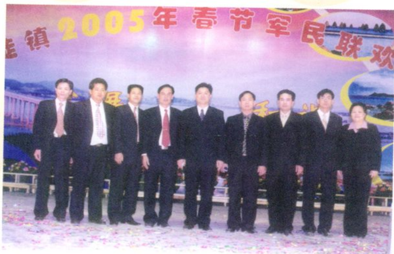
北陡镇委镇府领导班 子在2005年春节军民联欢 晚会合照

1999年下半年，北陡镇投入360多万元把镇政府对面30多亩的荒地填平建成占地面积1.98万平方米的人民广场。为当地群众提供了休憩的好地方。