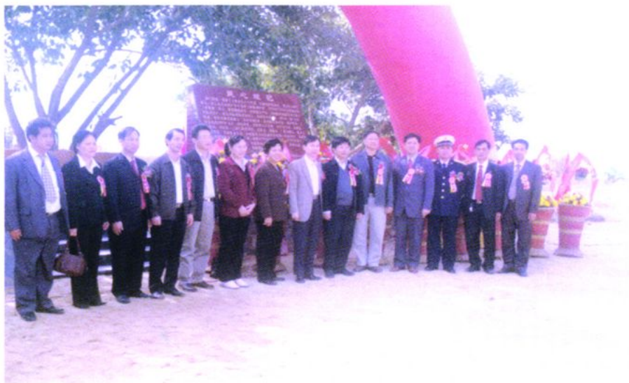
2004年12月9日，台山市委、市府领导、广东省公路局局长、驻军部队首长及北陡镇委镇府领导在“民心堤”剪彩仪式上合影。