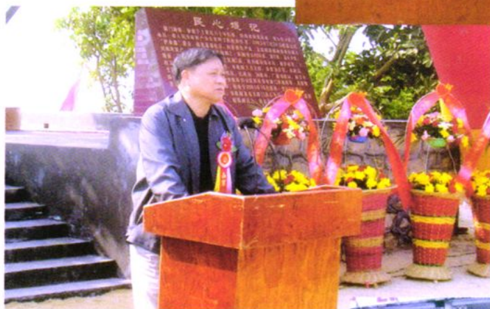
2004年12月9日 台山市委书记李澄海在北陡“民心堤”剪彩仪式上讲话。