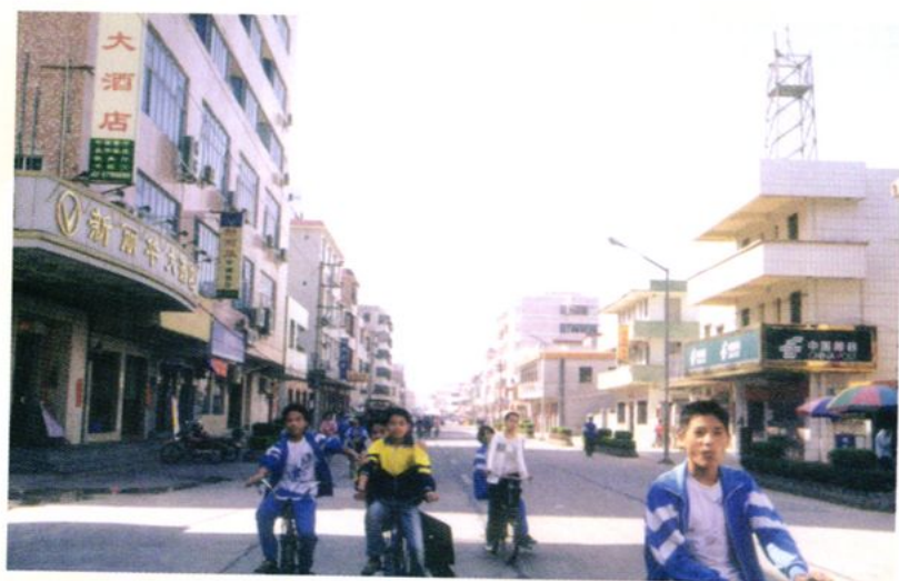
宽阔洁净的北陡大街