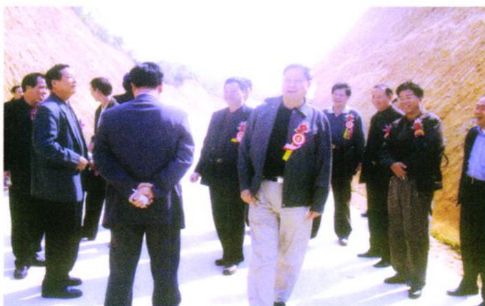
2004年12月9日 台山市委书记李澄海带领市有关单位领导参观北陡叶坑库“爱民路”。