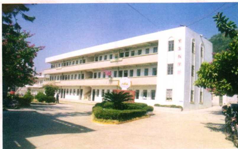
北陡中学教学大楼