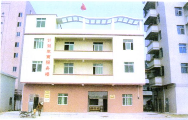
北陡镇计划生育服务大楼