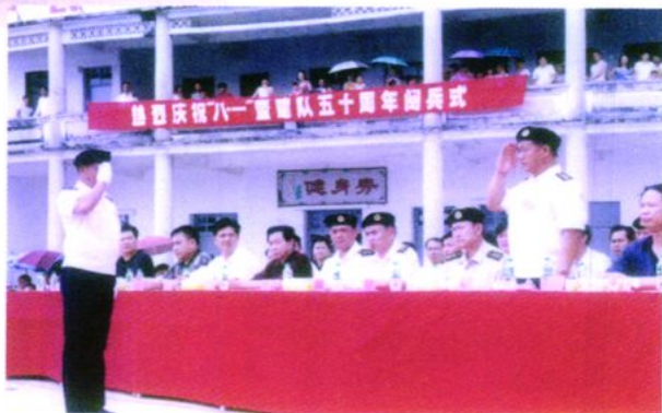
2001年8月1日，市、镇领导参加北陡驻军部队庆祝“八一”暨建队五十周年阅兵式。