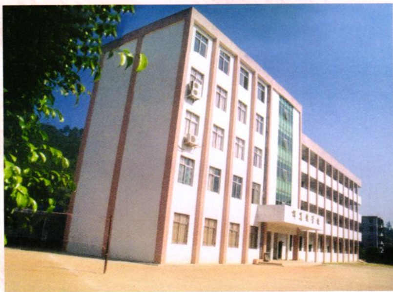
北陡中心小学外貌