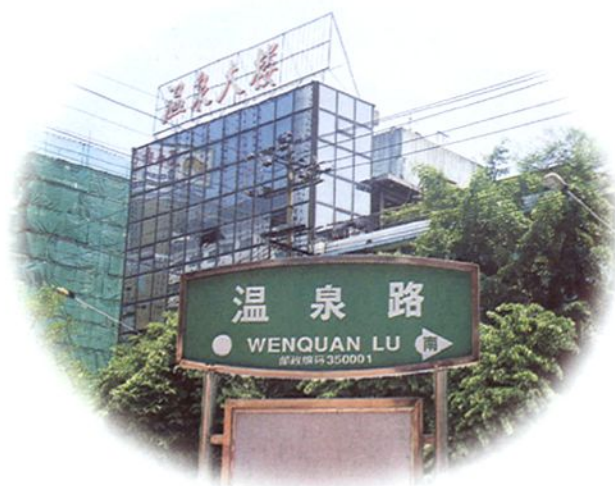
以温泉特色命名的福州市鼓 楼区温泉路。