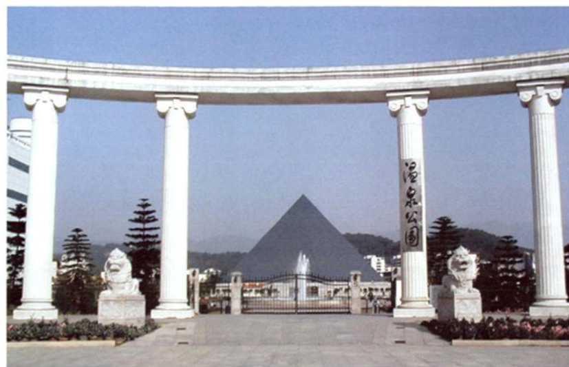
福州市区温泉保护区 地带上的温泉公园。