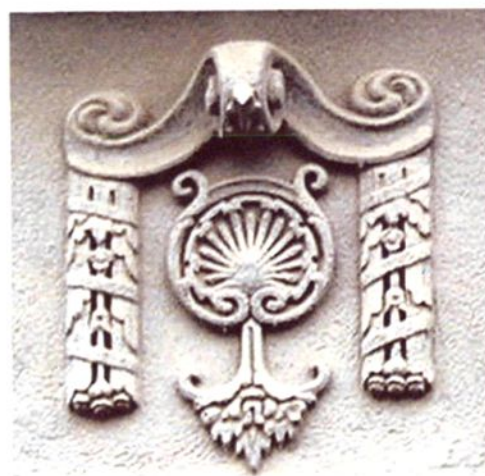
历史悠久的南星澡堂店标，寓意“南星”二字。