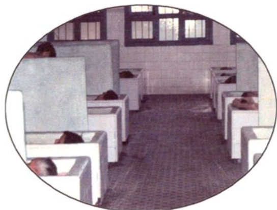
图为疗养员们在矿泉疗室中作温泉疗法。