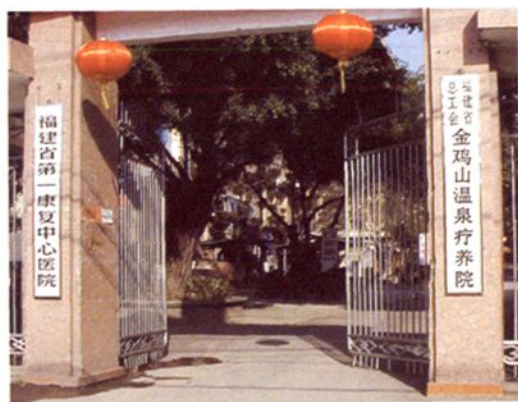
福建省总工会金鸡山温泉疗养院。