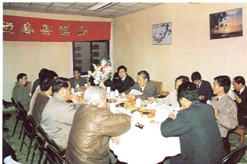
福州市原副市长林永诚(右六)与有关部门人员座谈如何加强温泉资源管理问题。