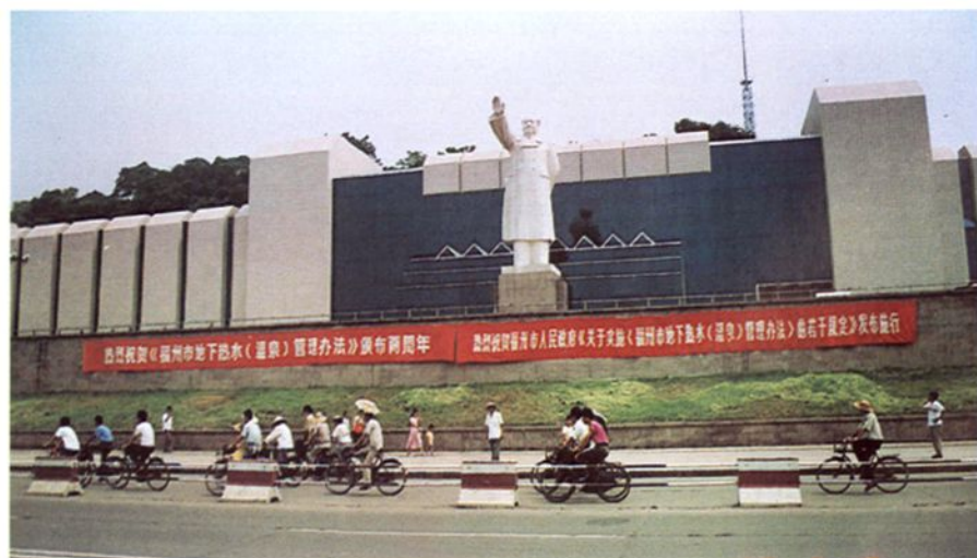
福州市五一 广场悬挂的宣传 条幅。