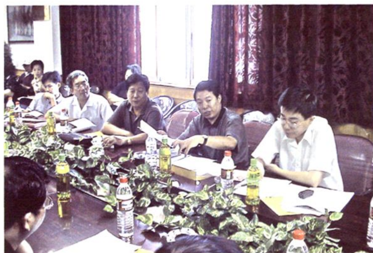
福州市副市长吴华瑞同志(右二)与福州市建设委员会有关人员研究加强温泉资源保护管理工作。右一为福州市政府办公厅副主任林飞同志。

“全国地热资源开发管理第三次经验交流会”在福州召开(1992年10月28日)图为原福州市人大常委会副主任林忠兴(前排右二)到会讲话。