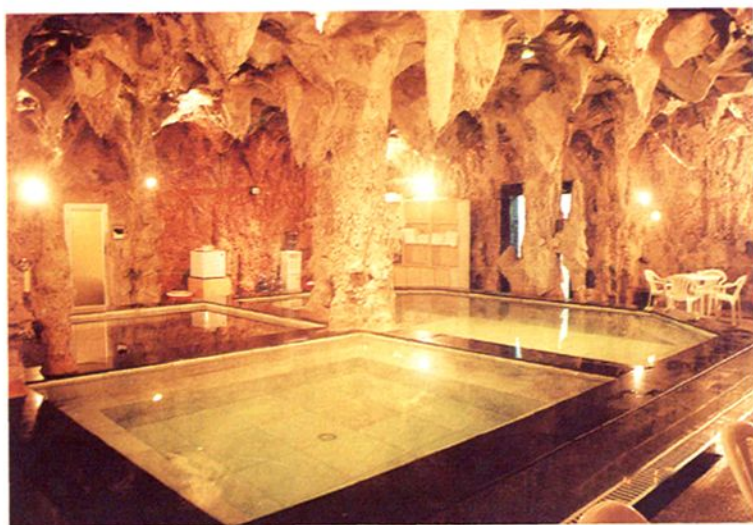
20世纪90年代福州温泉多用于桑拿服务业。图为原高桥澡堂改为多兰斯娱乐城桑拿中心，室内为人造溶洞式桑拿浴池。