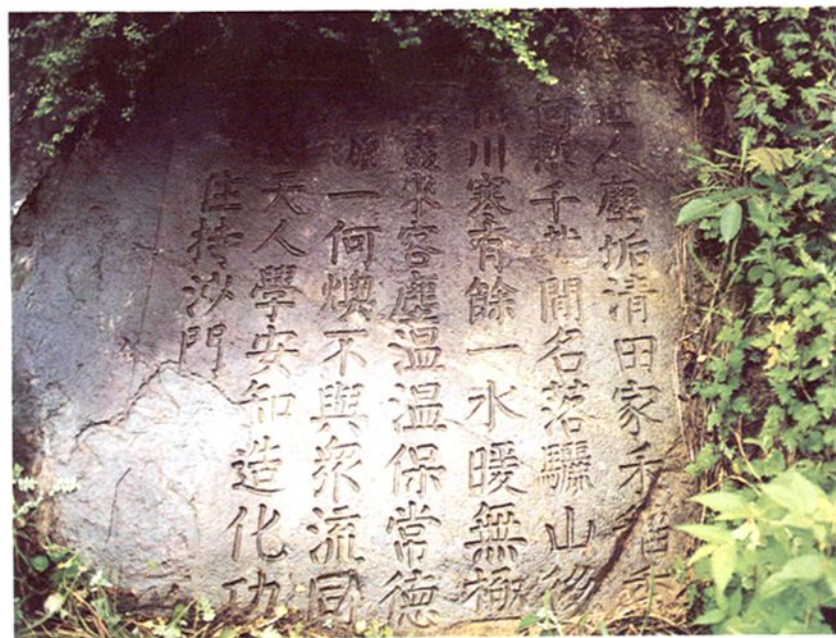
闽侯县白沙镇汤院温泉浴池遗址后山坡上关于温泉的石刻。