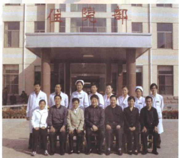
区长李乃俊同志到医院视察工作