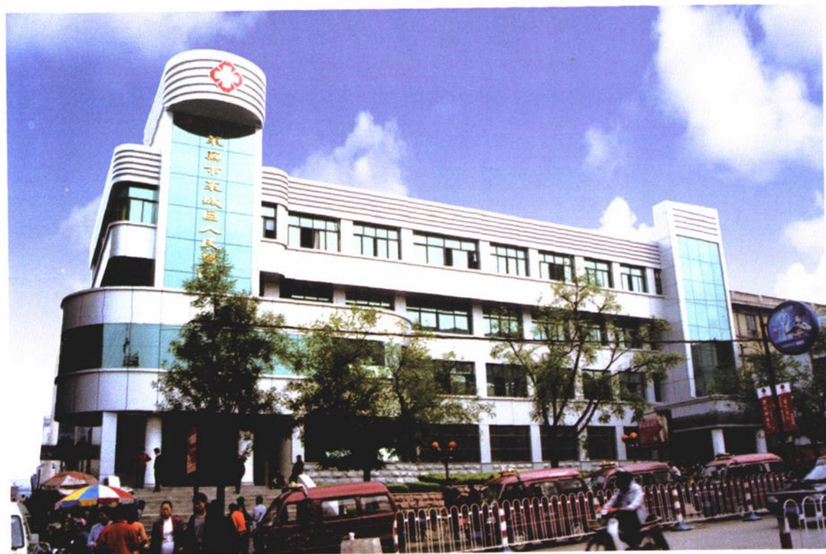
装修一新的门诊大楼