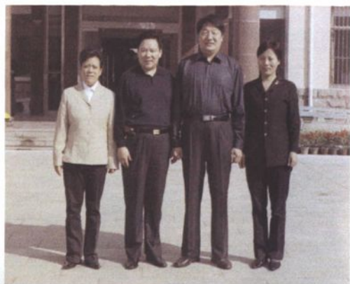
区长李乃俊同志到医院视察工作