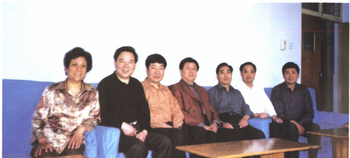
区委副书记胡文朴来医院视察工作