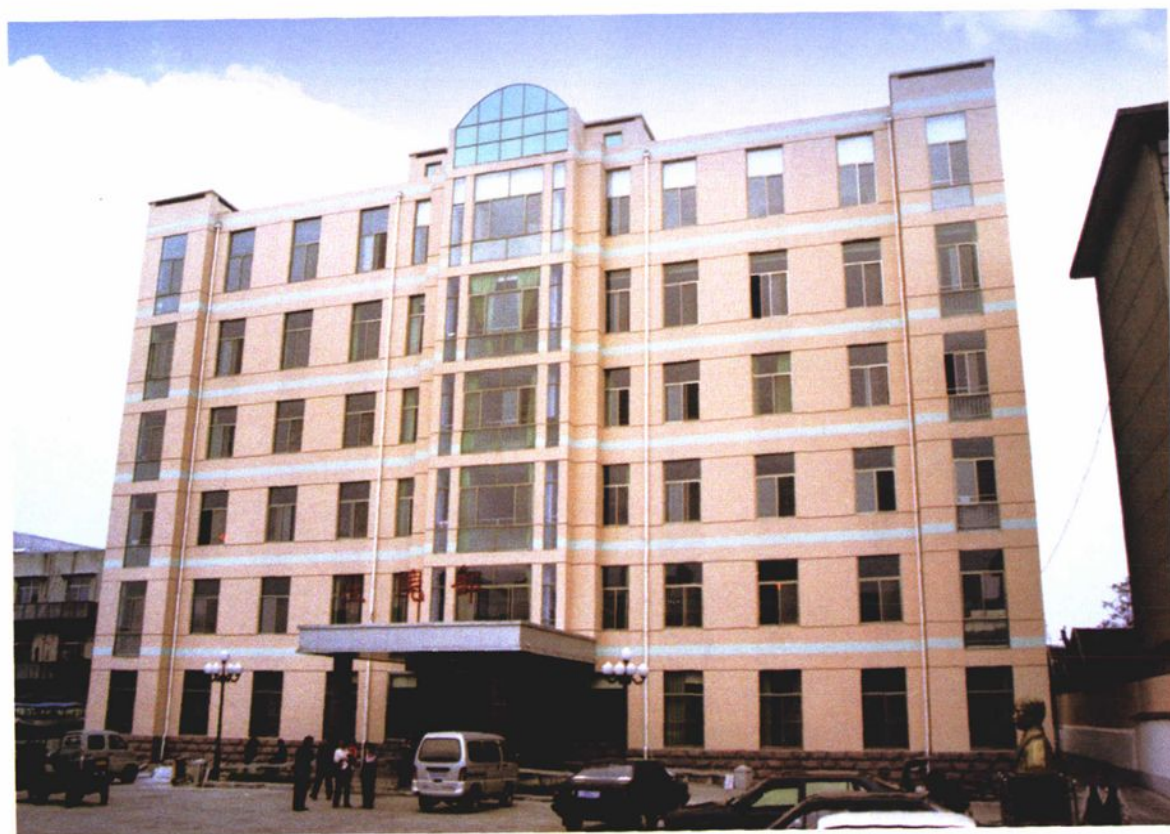
新建6000平方米的病房大楼