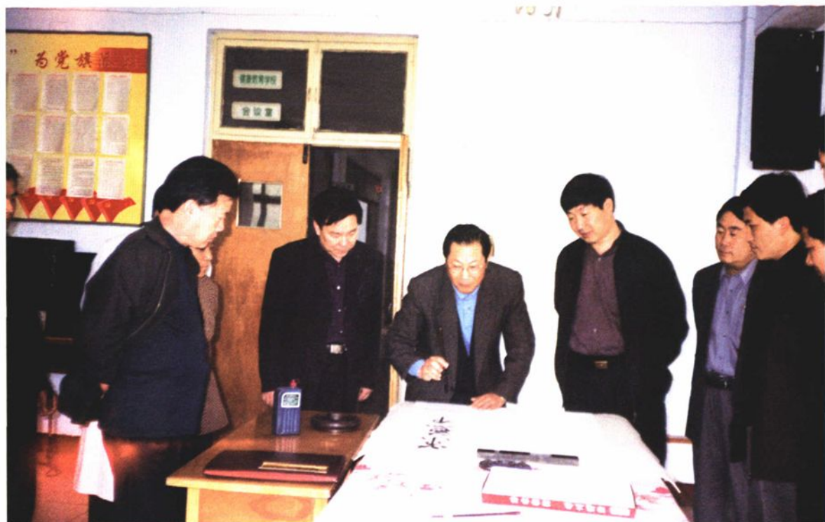
山东省卫生厅副厅长王文芳同志来医院视察工作，并为医院题词