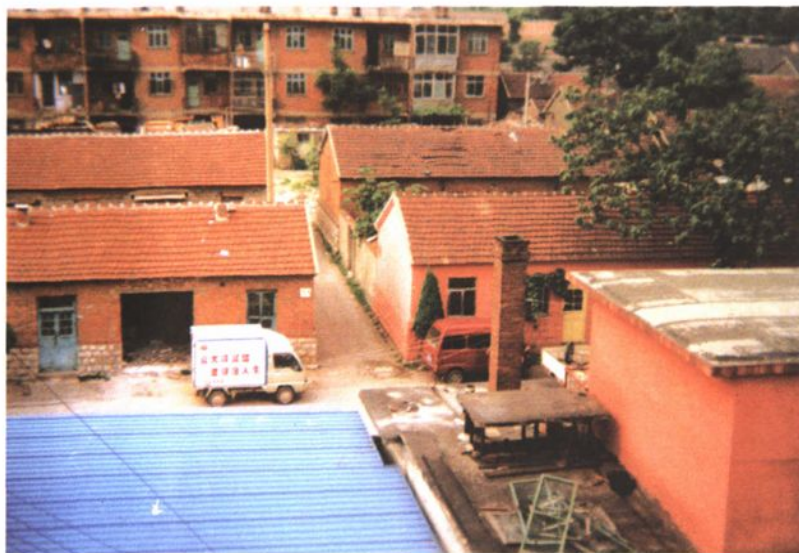
病房楼建设前原貌