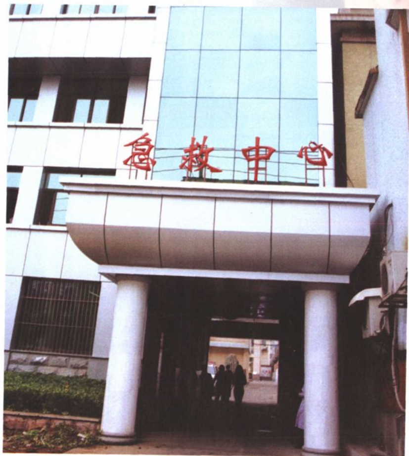
门诊急救中心通道