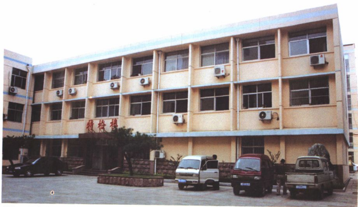
装修一新的特检楼