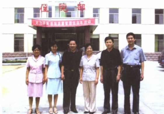
市人大常委会副主任房逢玉同志（左三）来院视察工作