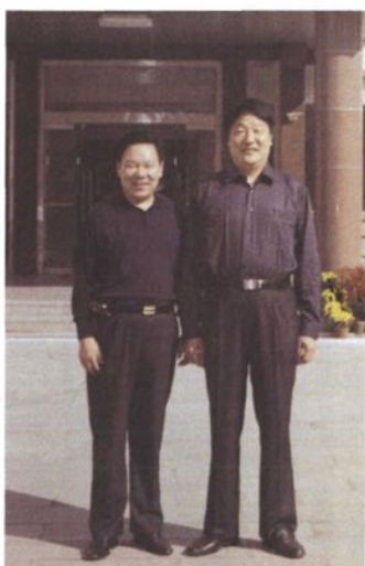
区长李乃俊到医院视察 与院长合影