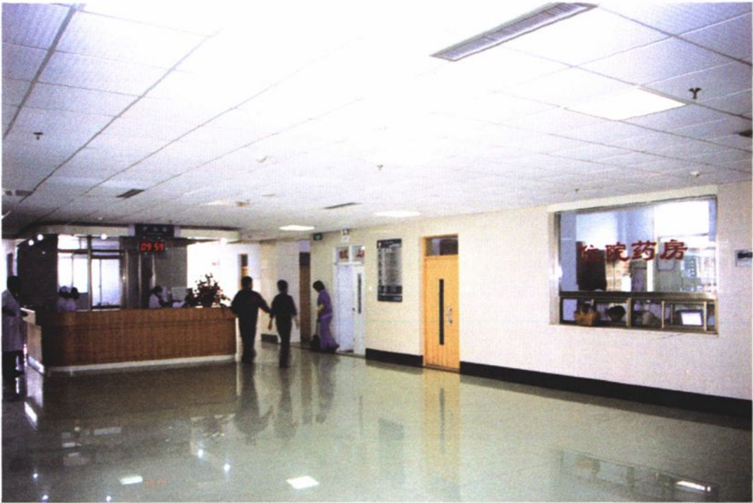
宽敞明亮的病房楼大厅