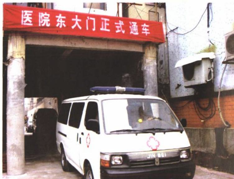
2005年7月门诊楼通道竣工通车