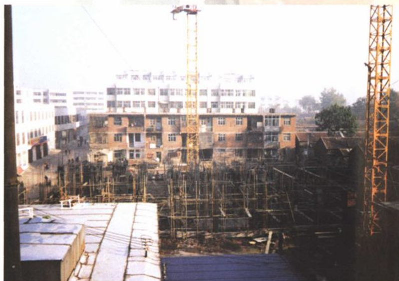
医院新建病房大楼在施工建设中