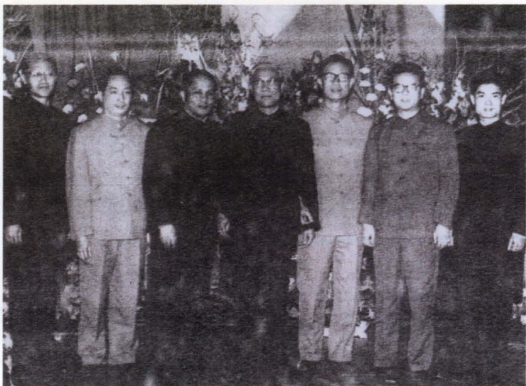
郑为之大使（中）1974年在阿根廷接见 广东省赴阿医学专家代表团成员时合影。