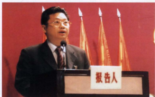
● 县委书记湛岳登讲话