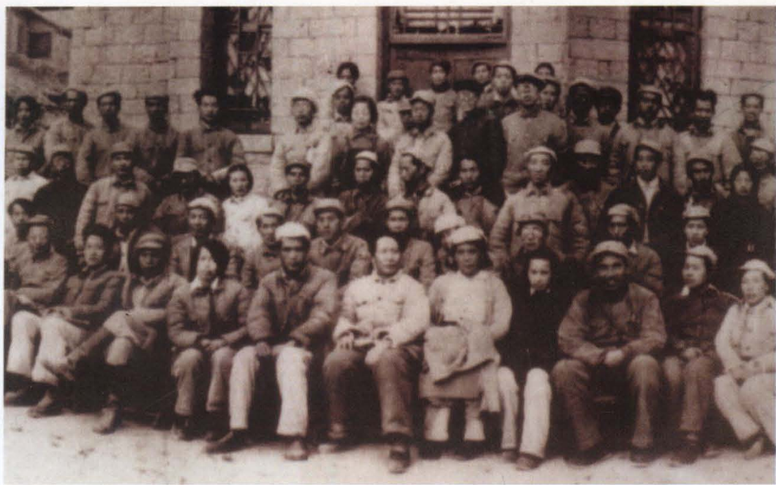
毛泽东同志1942年5月召开延安文艺座谈会合照（局部放大）。 前排左6毛泽东，9朱德，10丁玲：丁玲后面是郑星燕。