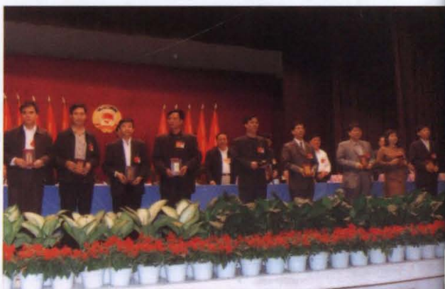
● 获优秀提案奖委员