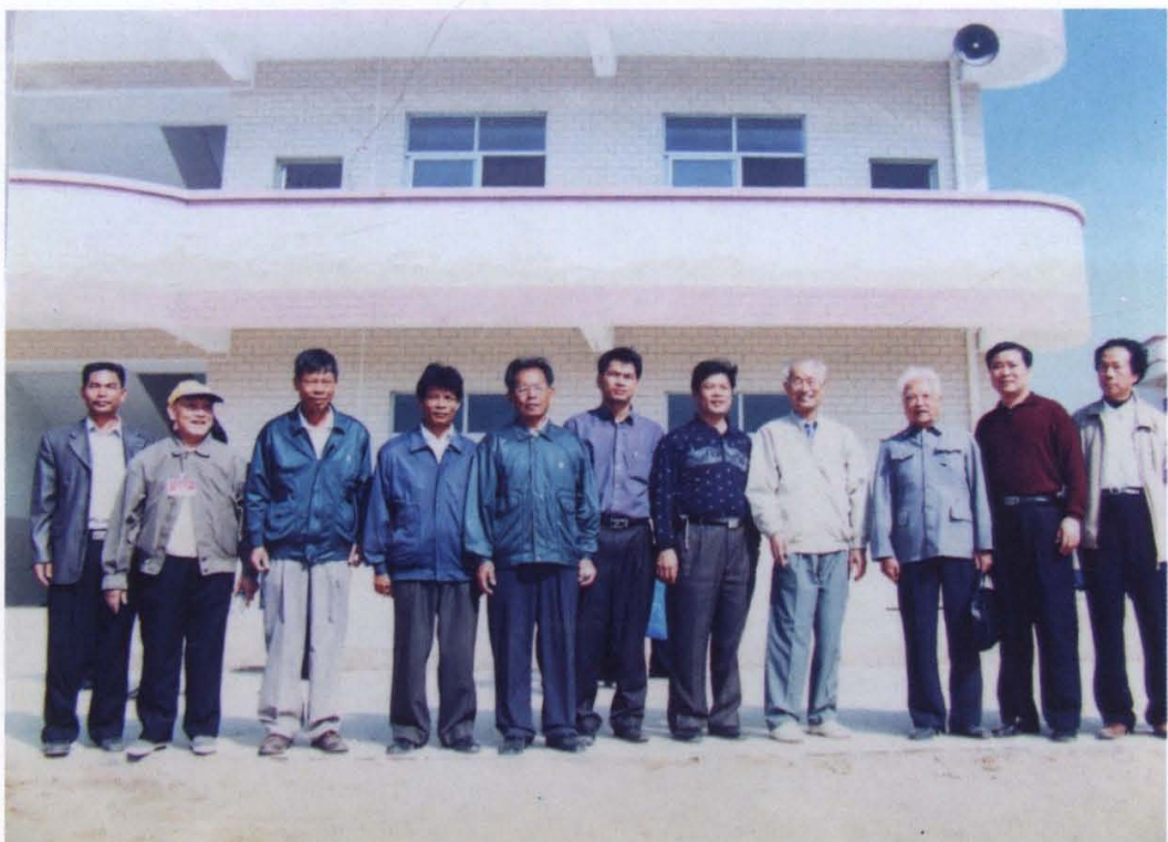
原中共广东省委书记林若同志（左起第5）2003年11月13日 视察遂溪县黄略镇平石学校时与县、镇领导合影。