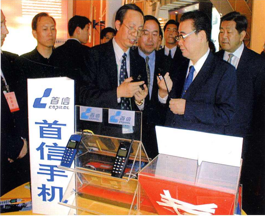
2000年5月10日中共中央政治局常委、全国人大常委会委员长李鹏、北京市委书记贾庆林在第三届中国北京高新技术国际周展览会上参观首信集团展台