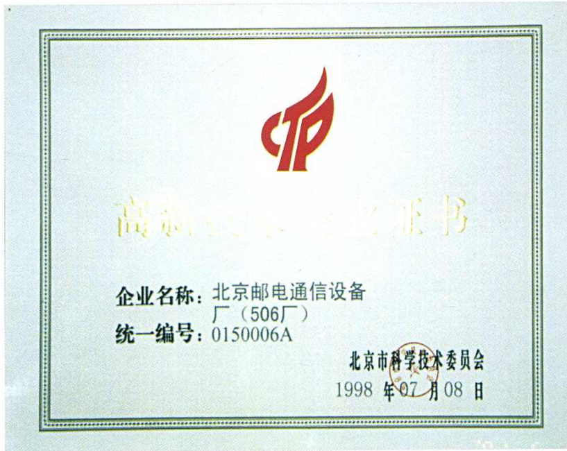
1998年7月工厂获高新技术企业证书