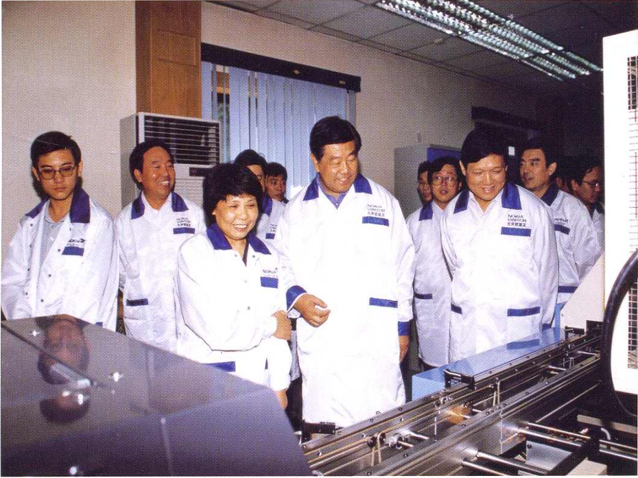
1998年8月29日北京市市长贾庆林、副市长刘淇来厂参观