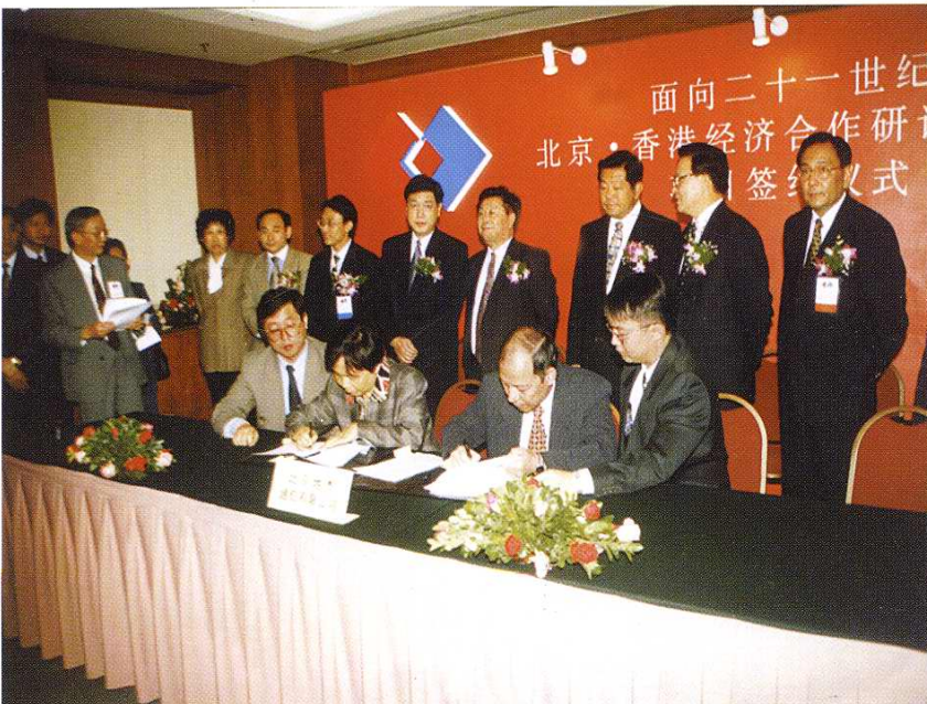
1997年10月 21日北京地杰通 信设备有限公司举 行成立签约仪式