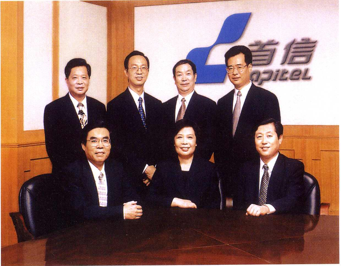
北京邮电通信设备厂现任领导