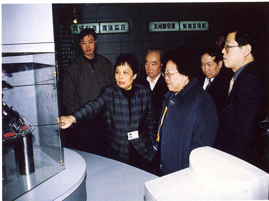
2000年3月22日，全国人大副委员长彭佩云莅临工厂视察