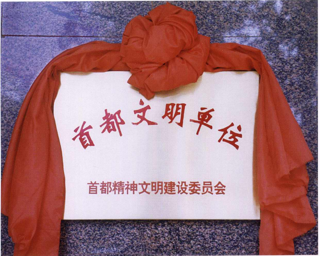
1991、1998、1999年工厂被评为首都文明单位