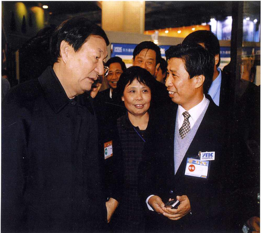
2000年10月在北京国际电信展上，朱镕基总理参观PTIC首信集团展台