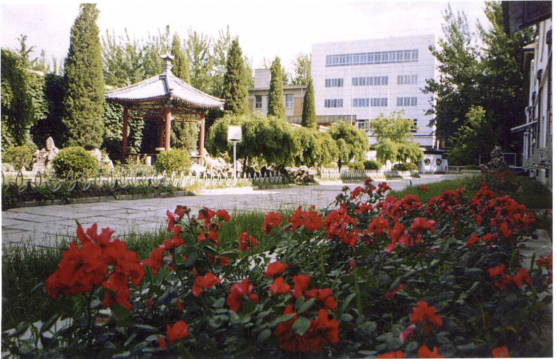
工厂多年被评为北京市花园式工厂