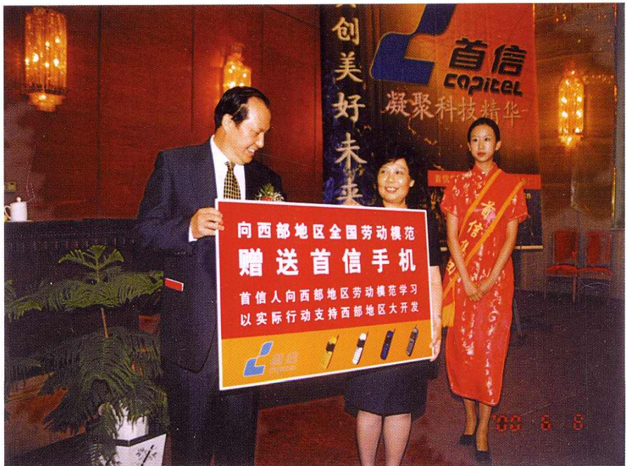
2000年6月工厂向西部地区劳动模范赠送具有自主知识产权的“首信”牌手机