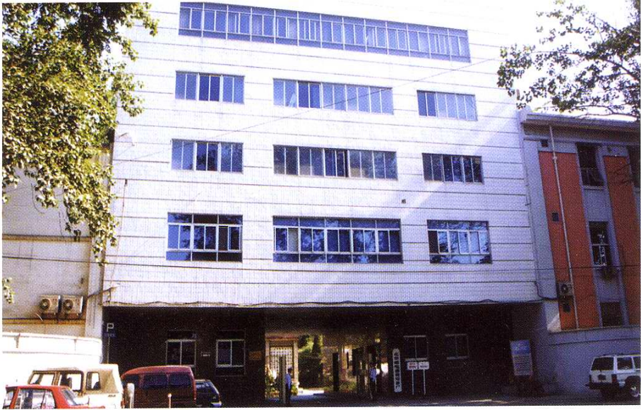
北京邮电通信设备厂正大门