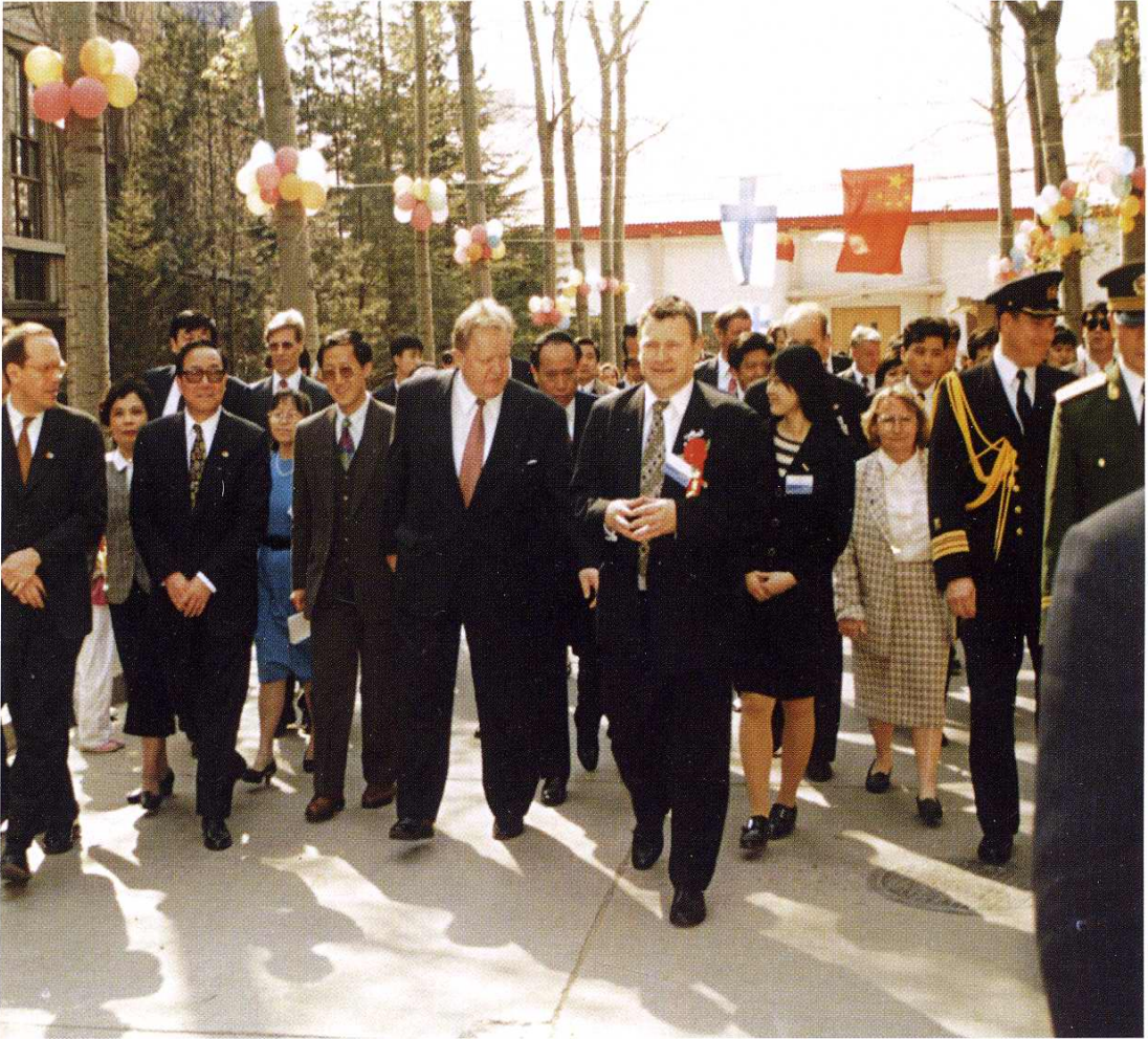
1996年4月17日芬兰总统阿赫蒂萨里参观北京诺基亚移动通信有限公司