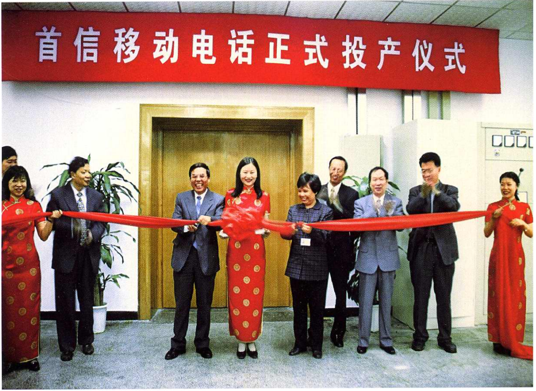
2000年4月19日厂领导为首信移动电话投产仪式剪彩