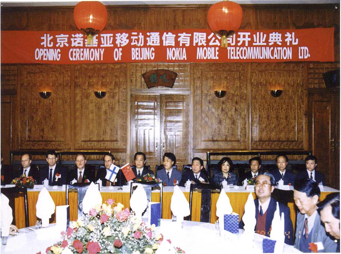
1995年4月11日北京诺基亚移动通信有限公司举行开业典礼