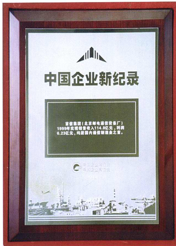
1999年工厂实 现销售收入114.8亿 元，实现利润6.23亿 元，均居国内通信 制造行业之首