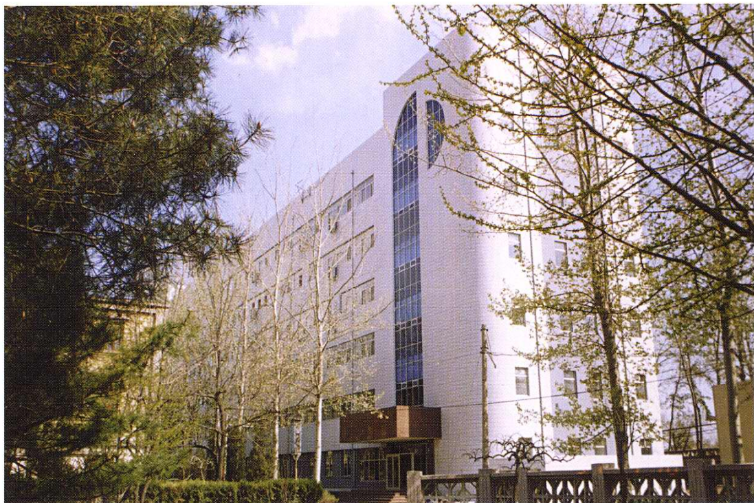
1997年科研装配大楼竣工并投入使用