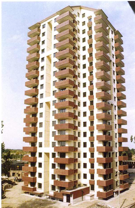
1997年职工宿舍高层住宅楼竣工