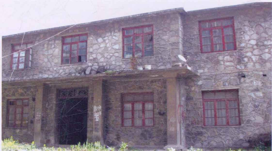
▲ 1982 年时的学生宿舍