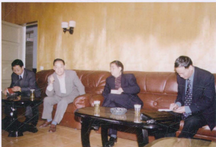
▶ 2002年3月20日，市委书记林明达（右二）到校视察，听取校长李茂贤（左二）汇报工作，市委常委、市委秘书长李彦芳（左一），市教育局局长李培仁（右一）陪同视察