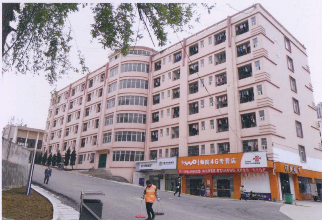
▼ 2008 年时的学生宿舍