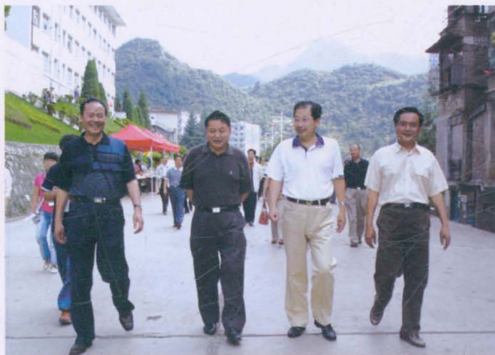
◀ 2007年8月30日，中共贵州省委常委，省纪委书记（左二）王正福率省人大调研组在学校调研，市委书记辛维光（右二），学校党委书记李培仁（左一）、校长田应洲（右一）陪同调研