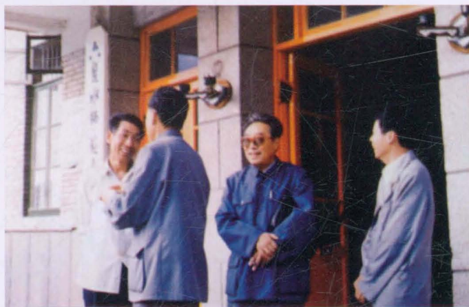
▶ 1985年夏，贵州省副省 长徐采栋在学校调研。右二 为徐采栋，左一为六盘水市 市长杨志鹏