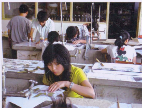
▲ 学生在制作植物标本