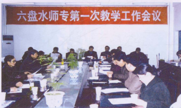
◀ 2003年12月，召开学校第一次教学工作会