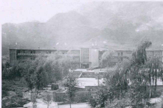
◀ 1980年秋集中办学时学校全景