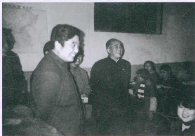
◀ 1985年夏，时任中共贵州 省委书记胡锦涛到学校教室看 望学生