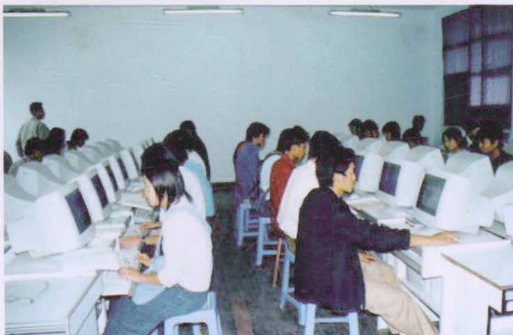
◀ 学生在上计算机课