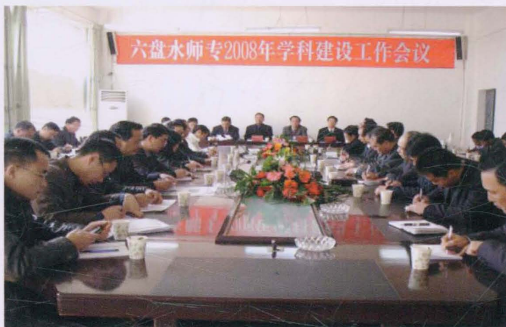
◀ 2008年，召开学科建设工作会议