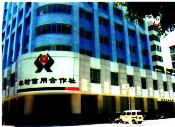
▶ 云城联社办公大楼外景