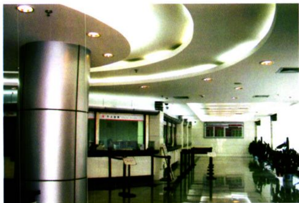
◀ 中国银行云浮分行营业部大厅