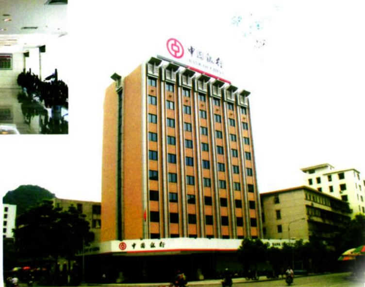
▶ 中国银行云浮分行办公大楼外景