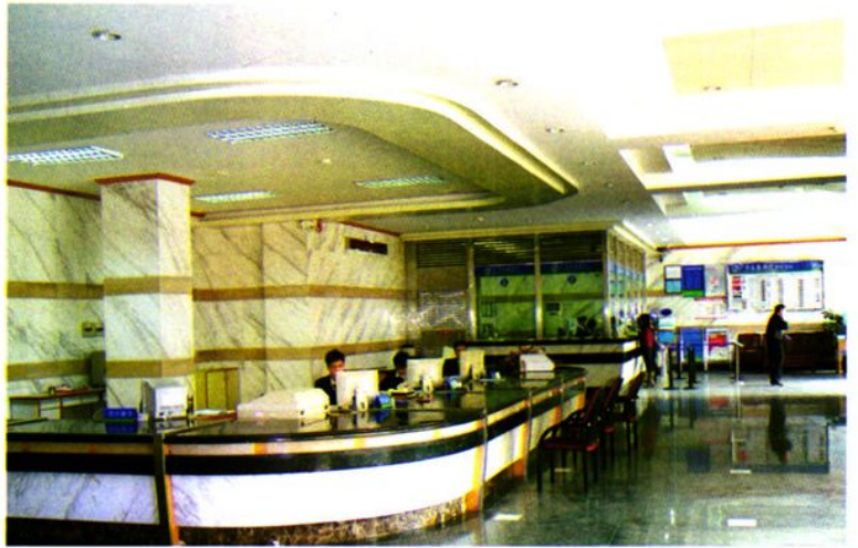
▶ 罗定广发行营业大厅