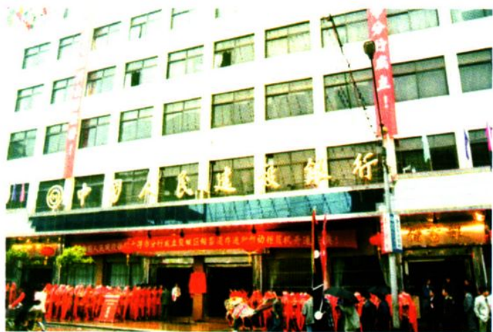
◀ 1995年3月29日，中国人民建设银行云浮市分行成立。图为分行成立挂牌仪式