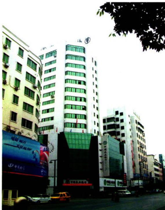
▶ 农业银行云浮市分行办公大楼外景