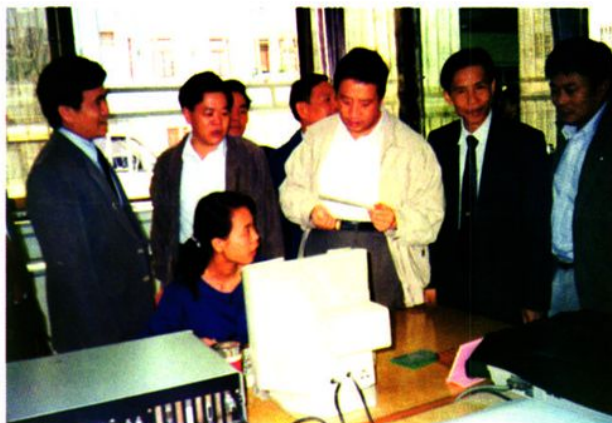
▶ 1992年10月19日，中国人民银行副行长周正庆（右三）在云浮县支行调研