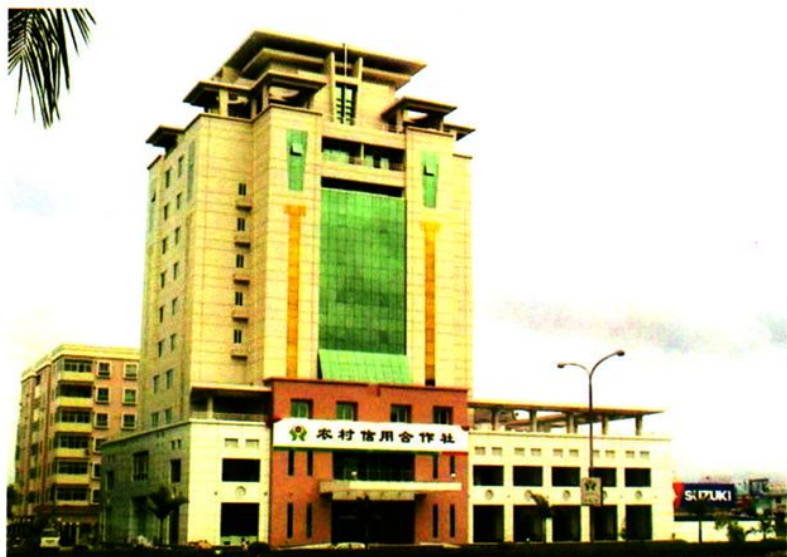
◀ 新兴县联社办公大楼外景