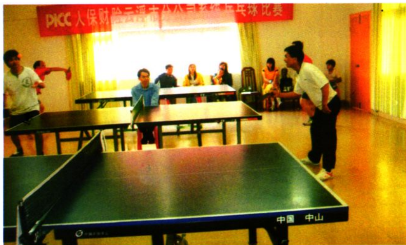
▶人保财险云浮市分公司系统举行乒乓球赛