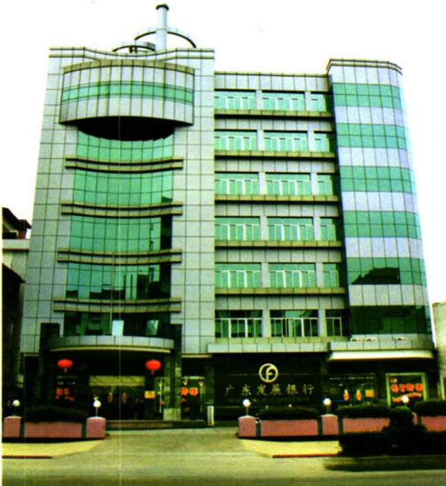
◀ 罗定广发办公大楼外景。