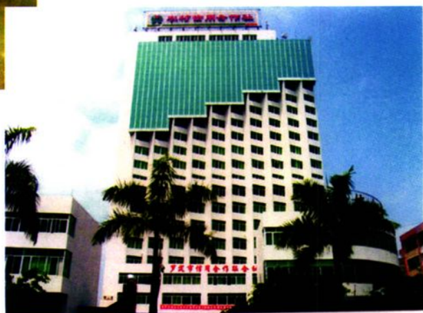
▶ 罗定联社办公大楼外景