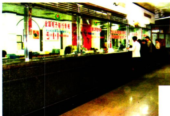
◀ 罗定联社营业大厅全景