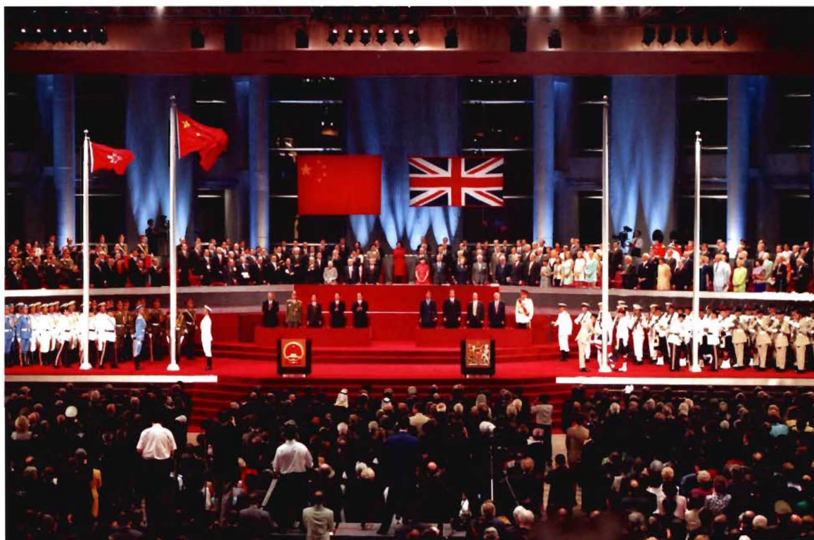
1997年7月1日，中英双方举行交接仪式，香港回归祖国