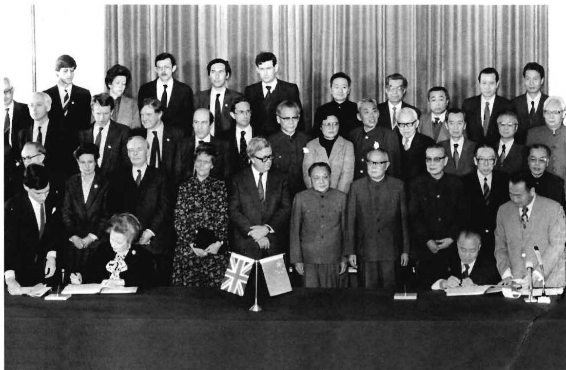
1984年12月，《中英关于香港问题的联合声明》正式签署