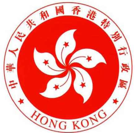
香港特别行政区区旗、区徽