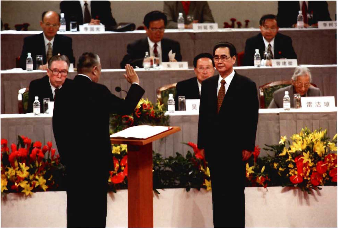
香港特别行政区政府成立, 第一任行政长官董建华宣誓就职