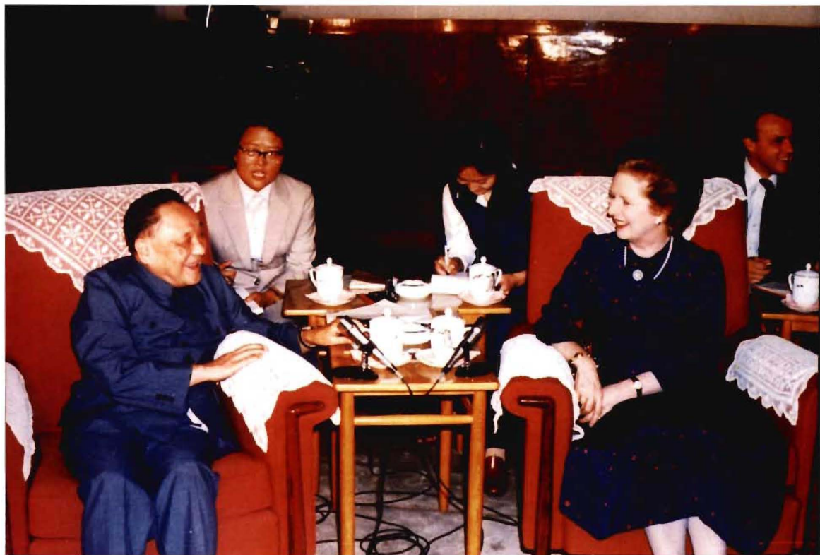
1982年9月，邓小平会见访华的英国首相撒切尔夫人，提出了中国对香港问题的基本立场