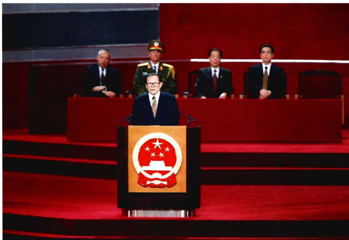
国家主席江泽民庄严宣告：中华人民共和国恢复对香港行使主权