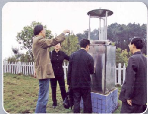
林业有害生物监测预报