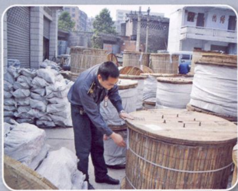
检疫执法（封存未经检疫的电缆盘）