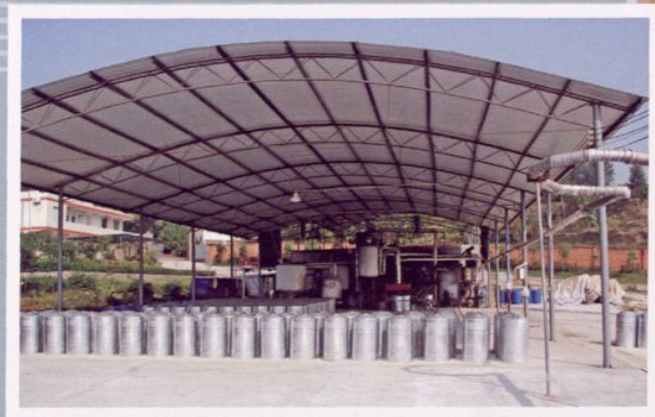
福永林木发展有限公司松香加工厂