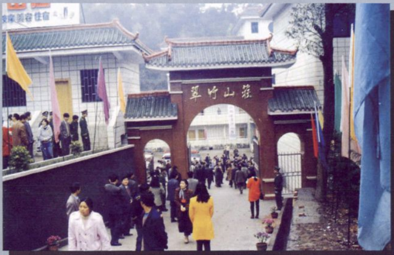
茶山竹海公园翠竹山庄