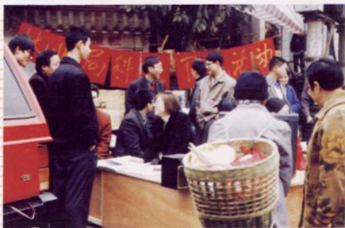
林业科技下乡活动