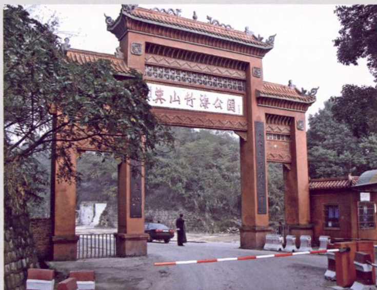
茶山竹海国家级森林公园