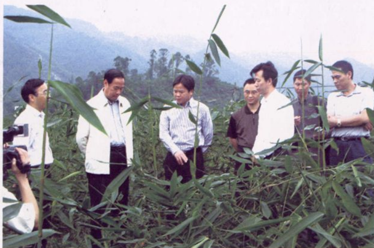
国家林业局、重庆市林业局、区领导调研速丰林建设