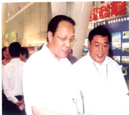
管理局局长崔运来在哈洽会期间陪同国家农业部副部长张宝文（左）参观我局展区