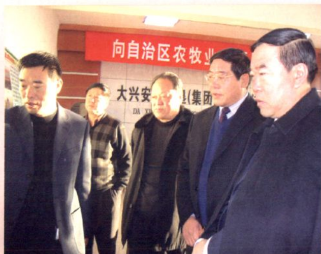
自治区农牧业厅厅长陶克（右一） 来垦区视察工作