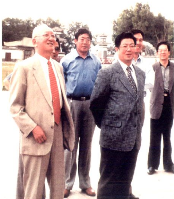
管理局局长崔运来（左二）陪同全国人大副委员长、中华全国总工会主席王兆国（左三）视察工作