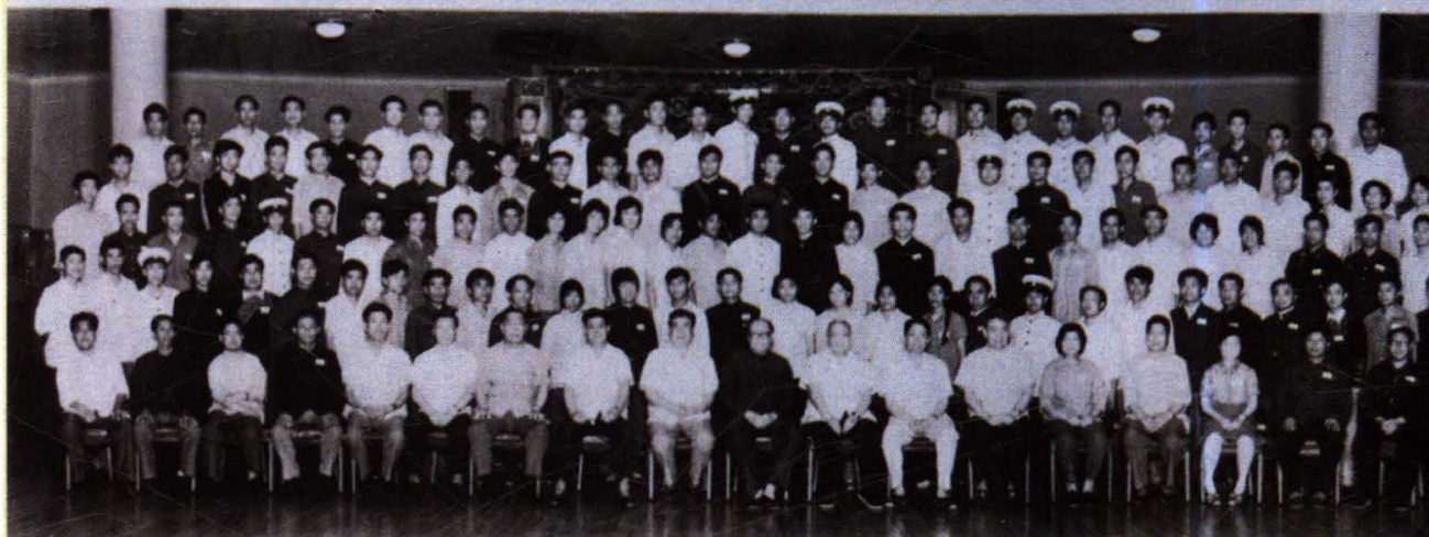
乌兰夫、杨静仁等领导视察西南民族学院