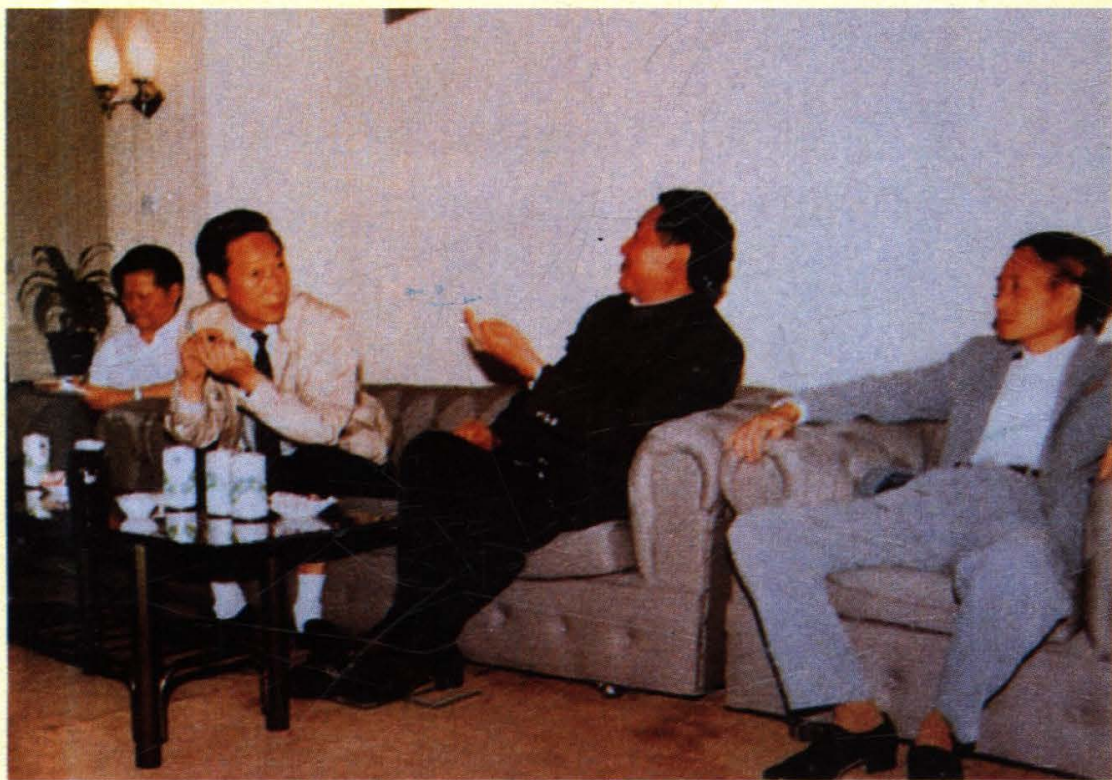
四川省省长张皓若、副省长韩邦彦1988年5月视察学院时，听取学院负责人汇报情况