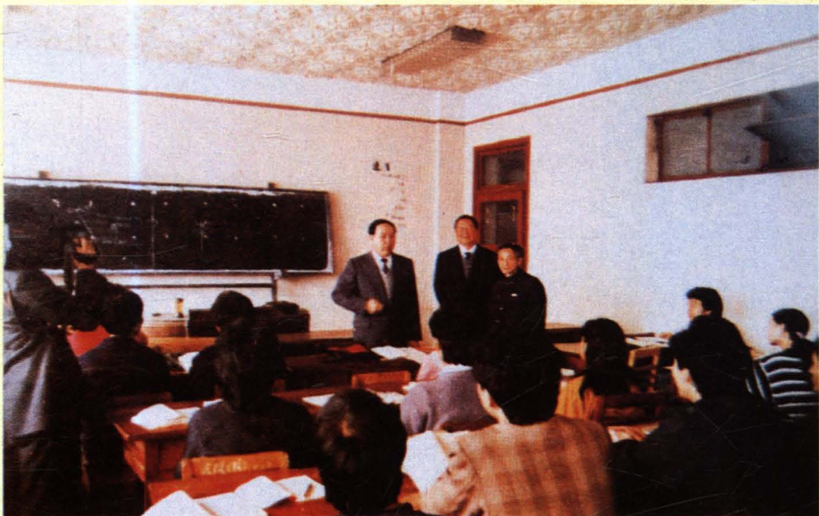
司马义·艾买提同志视察我院