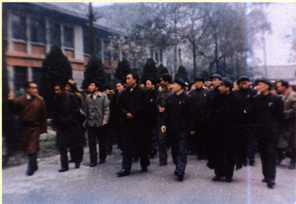
班禅副委员长视察我院