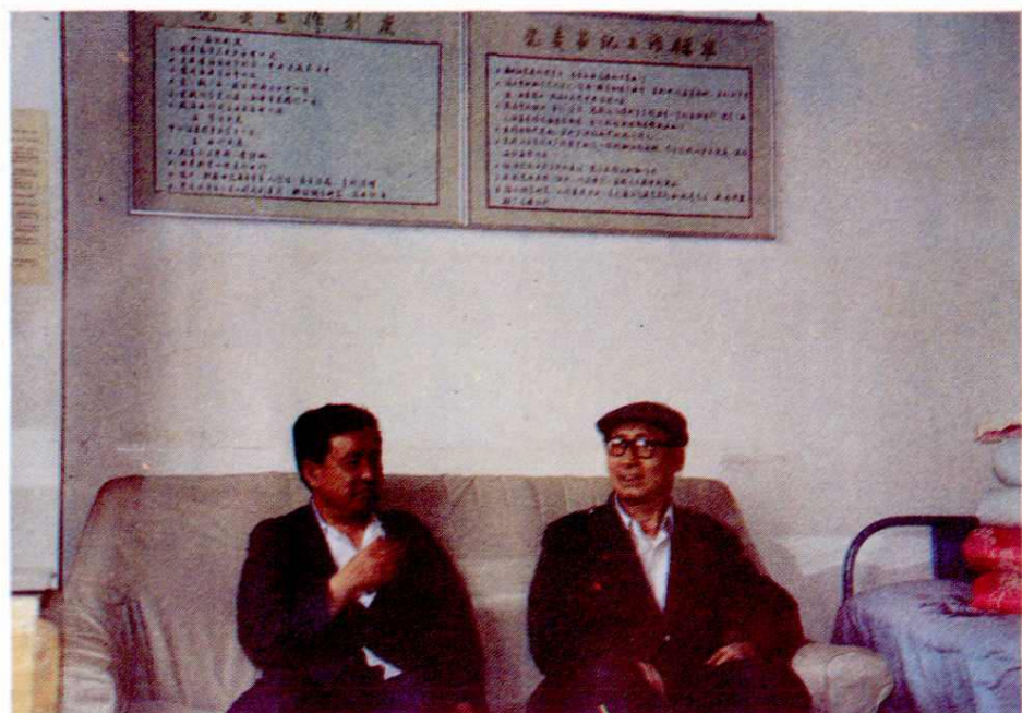
编辑人员在研究站志编纂有关问题