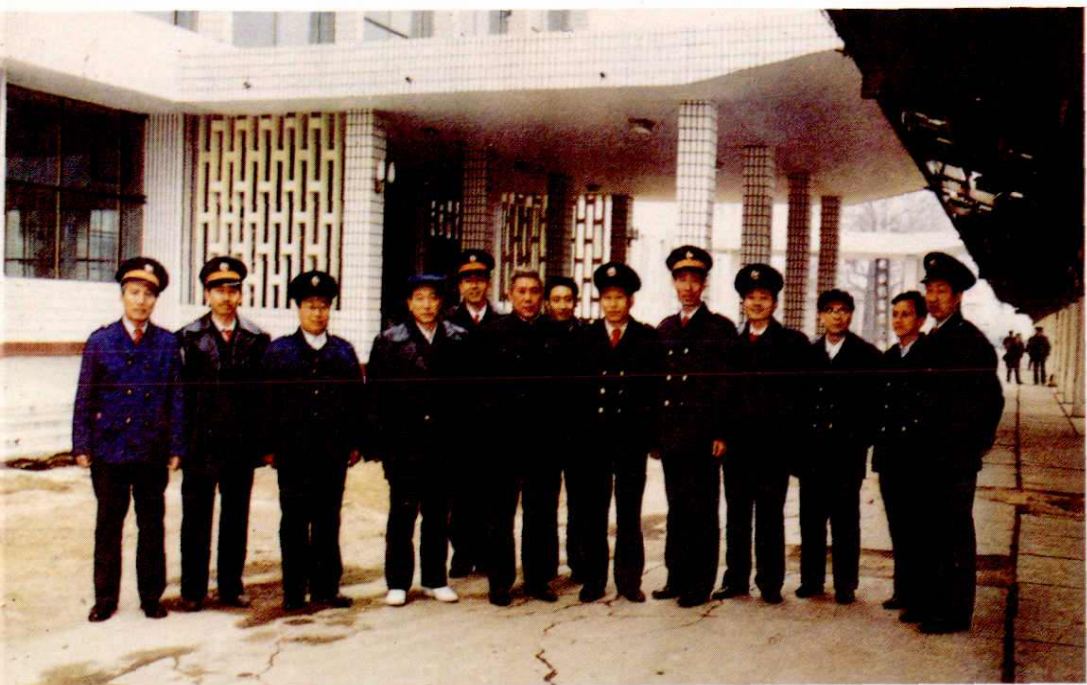
1989年铁道部部长李森茂（左六）来本站视察留影