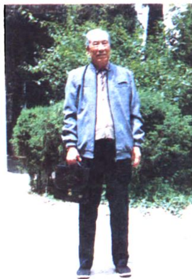
原化工部副部长 杨叶澎同志