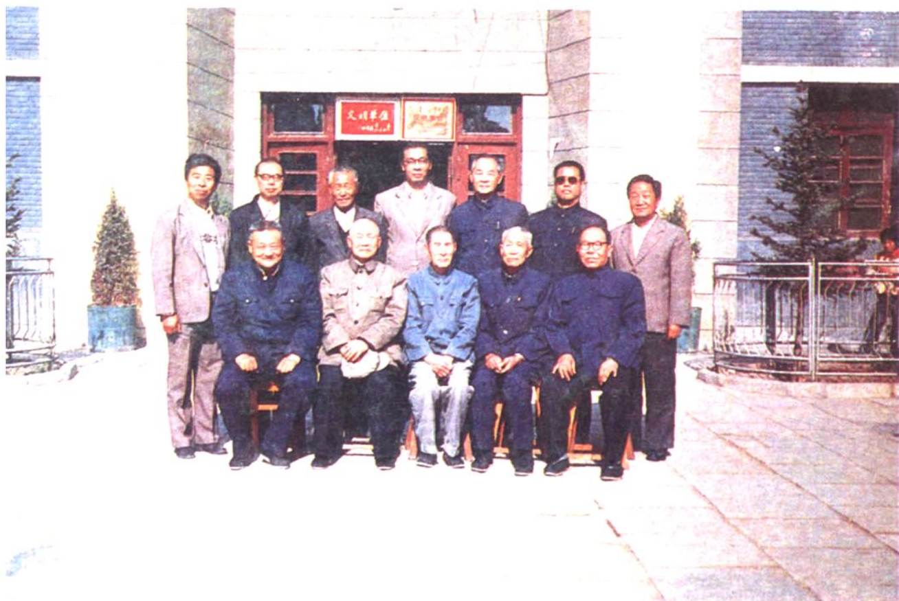
解放后呼和浩特市第一中学部分校领导合影