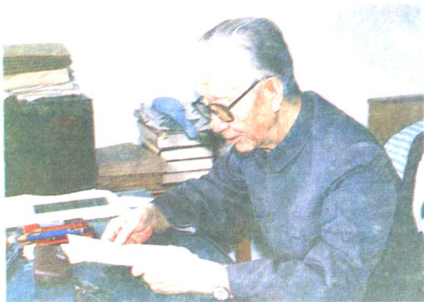
原最高人民法院院长郑天翔