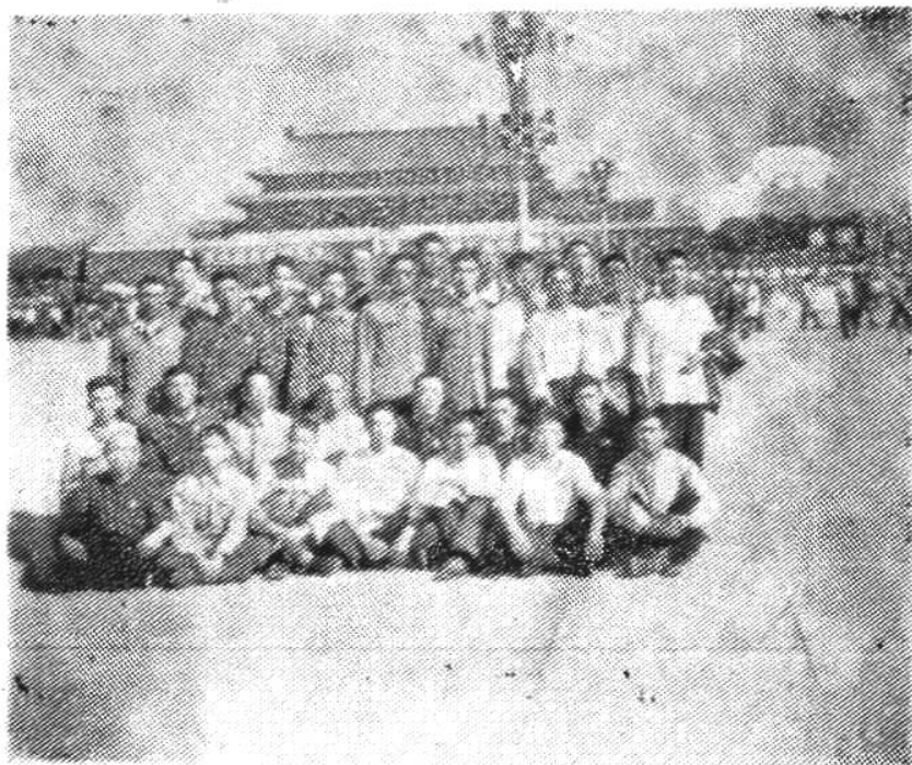
学习「二穴治结」人员在京合影