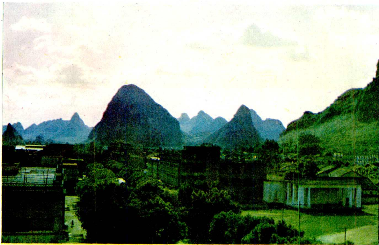
▲ 罗城仫佬族自治县县城