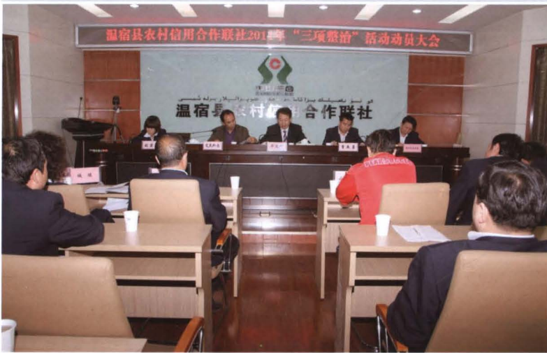
2011年4月16日，县联社召开“三项整治”活动动员大会