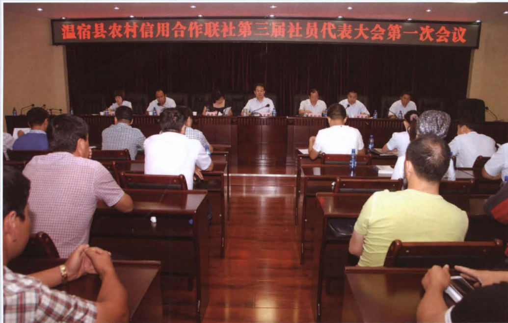
2013年7月22日，县联社召开第三届社员代表大会第一次会议