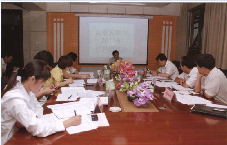
2011年6月12日，县联社召开招聘大学生面试会