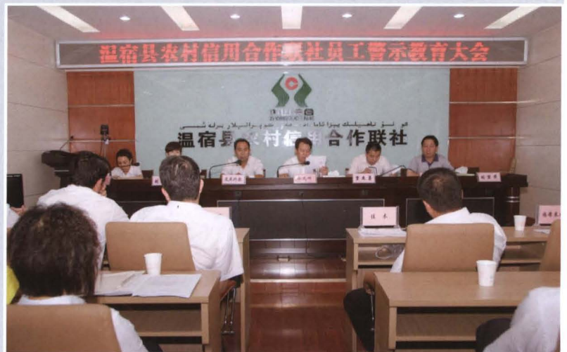
2011年5月26日，县联社召开员工警示教育大会