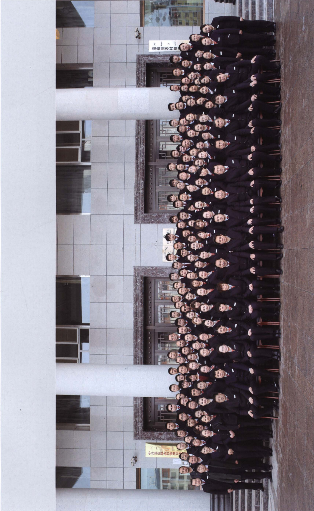
2015年，温宿县农村信用合作联社全体员工合影