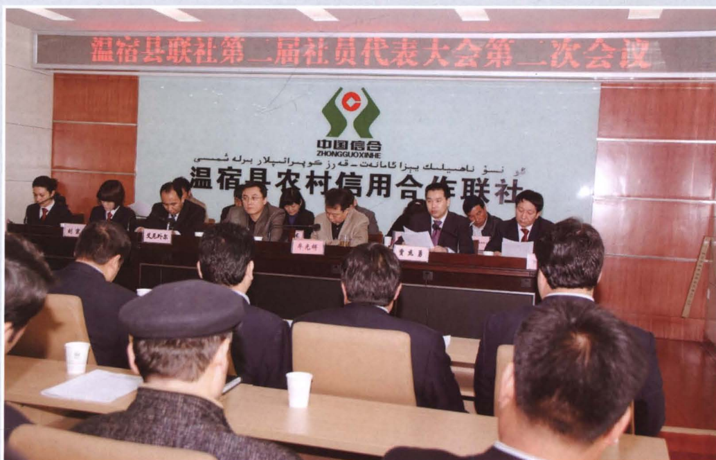
2011年3月10日，县联社召开第二届社员代表大会第二次会议