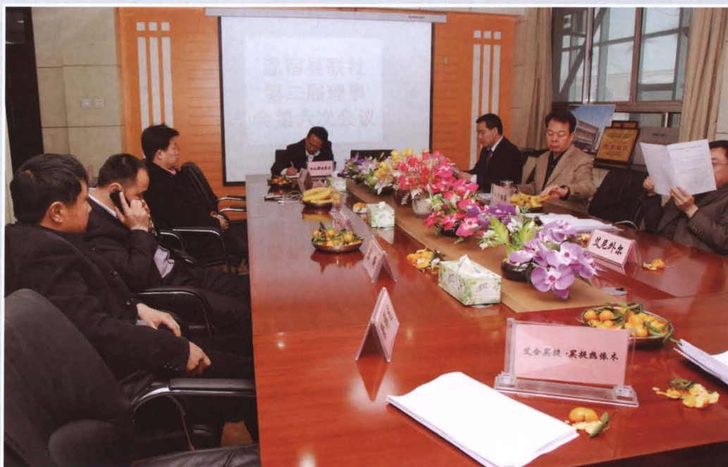
2011年3月10日，县联社召开第二届理事会第六次会议