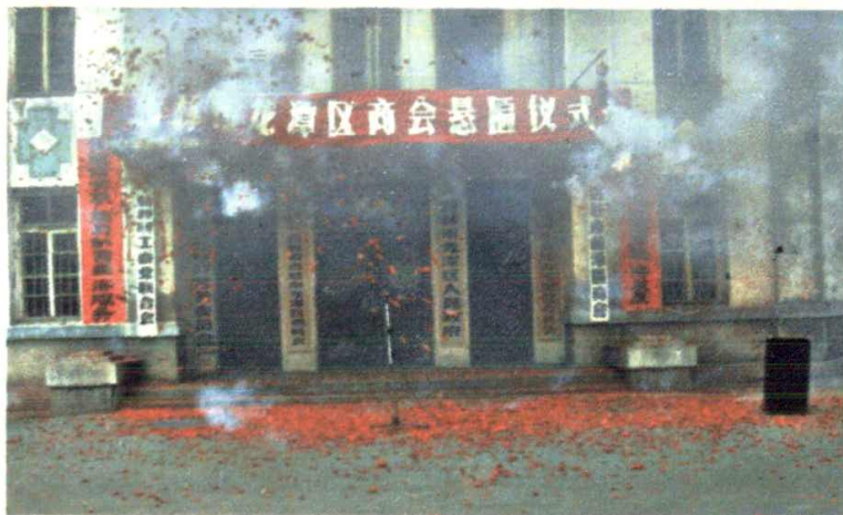
吉林市龙潭区工商业联合会（商会）悬匾仪式