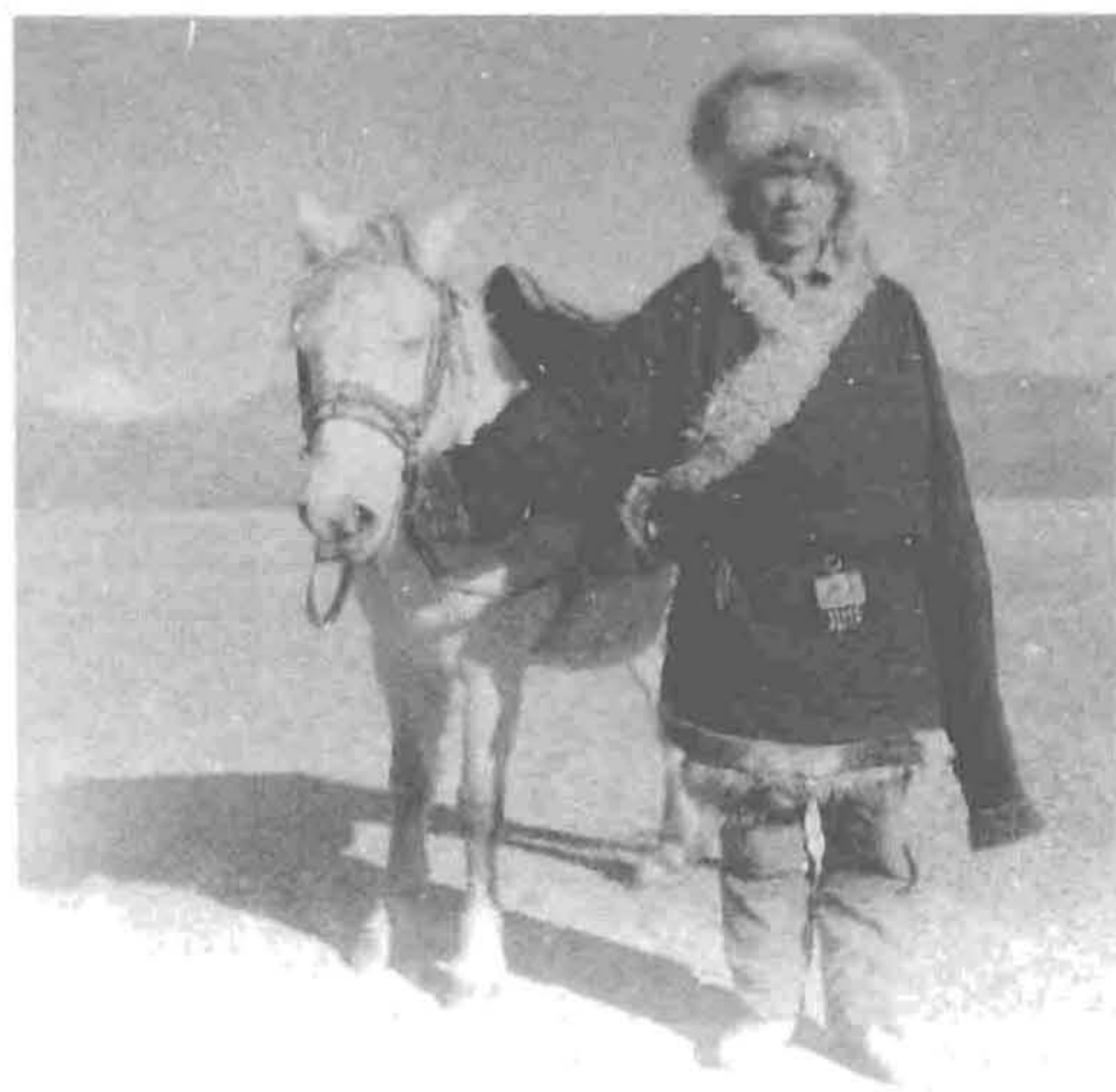
照片 2 在普兰县巴格区牧区沙滩