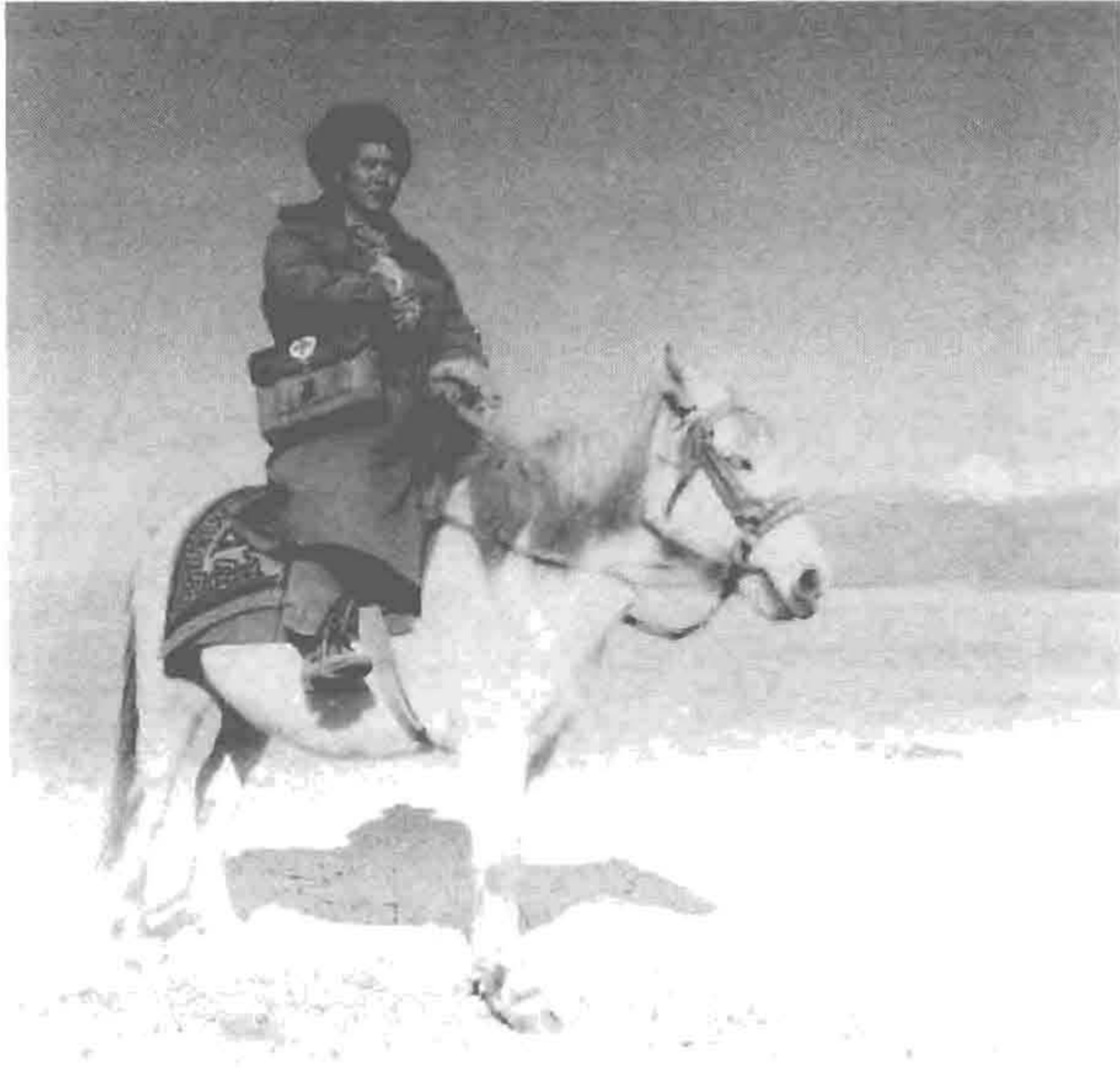
照片3 在普兰县巴格区牧区沙滩，骑白马穿藏袍出诊