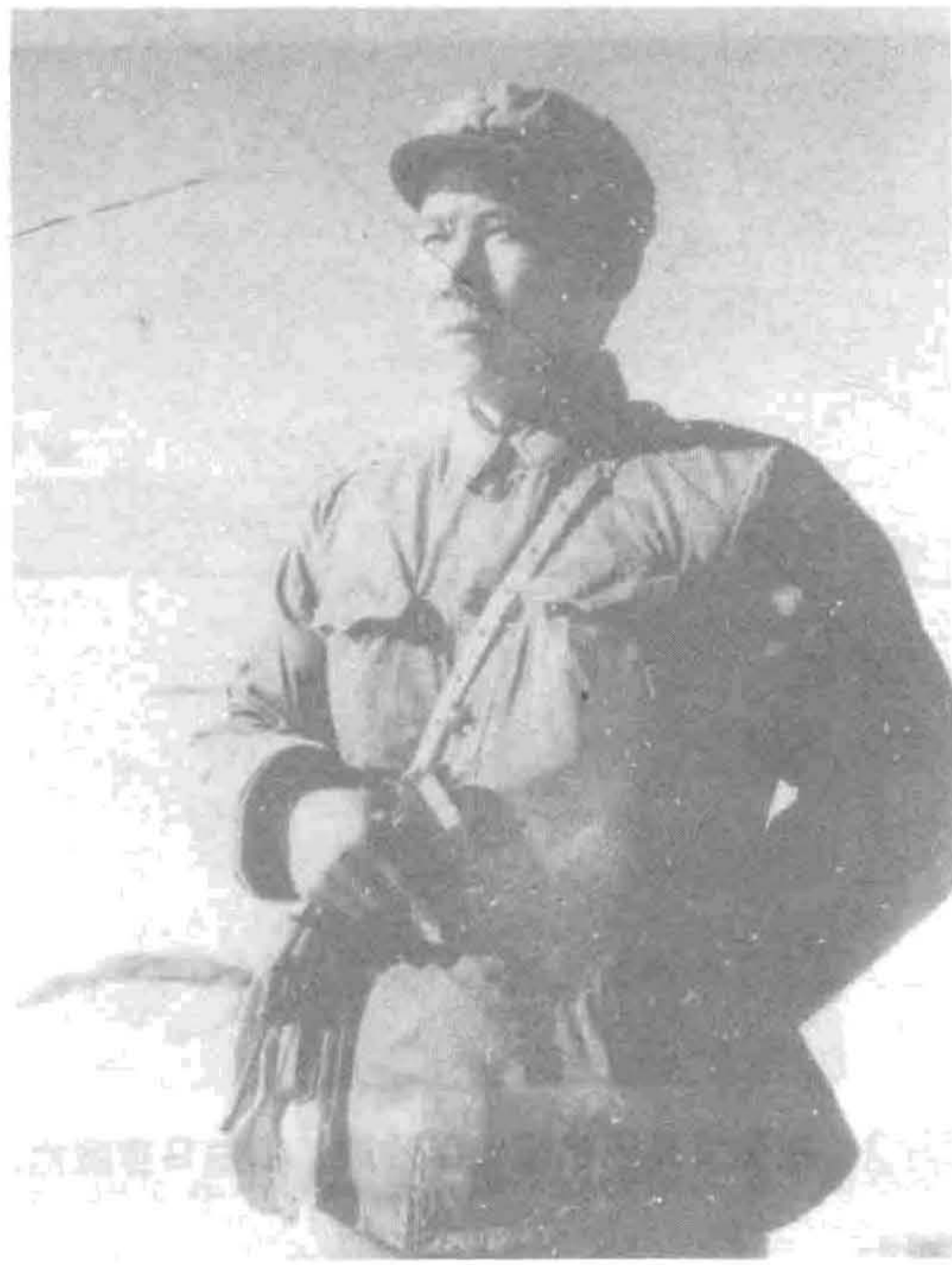
照片 1 1976 年春节在普兰县霍尔边防中队