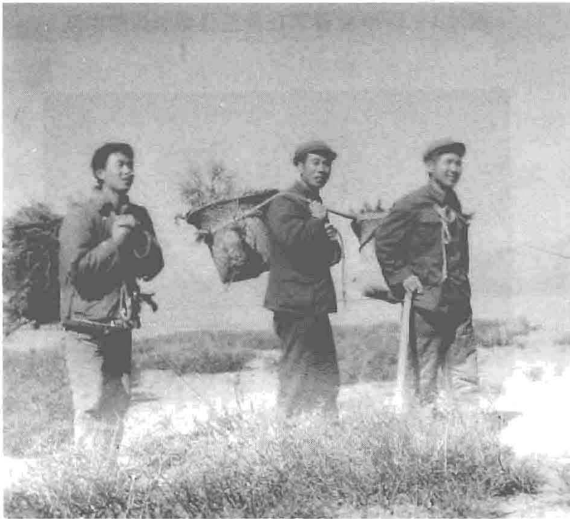
照片4 北京援藏医疗队队员在阿里采药