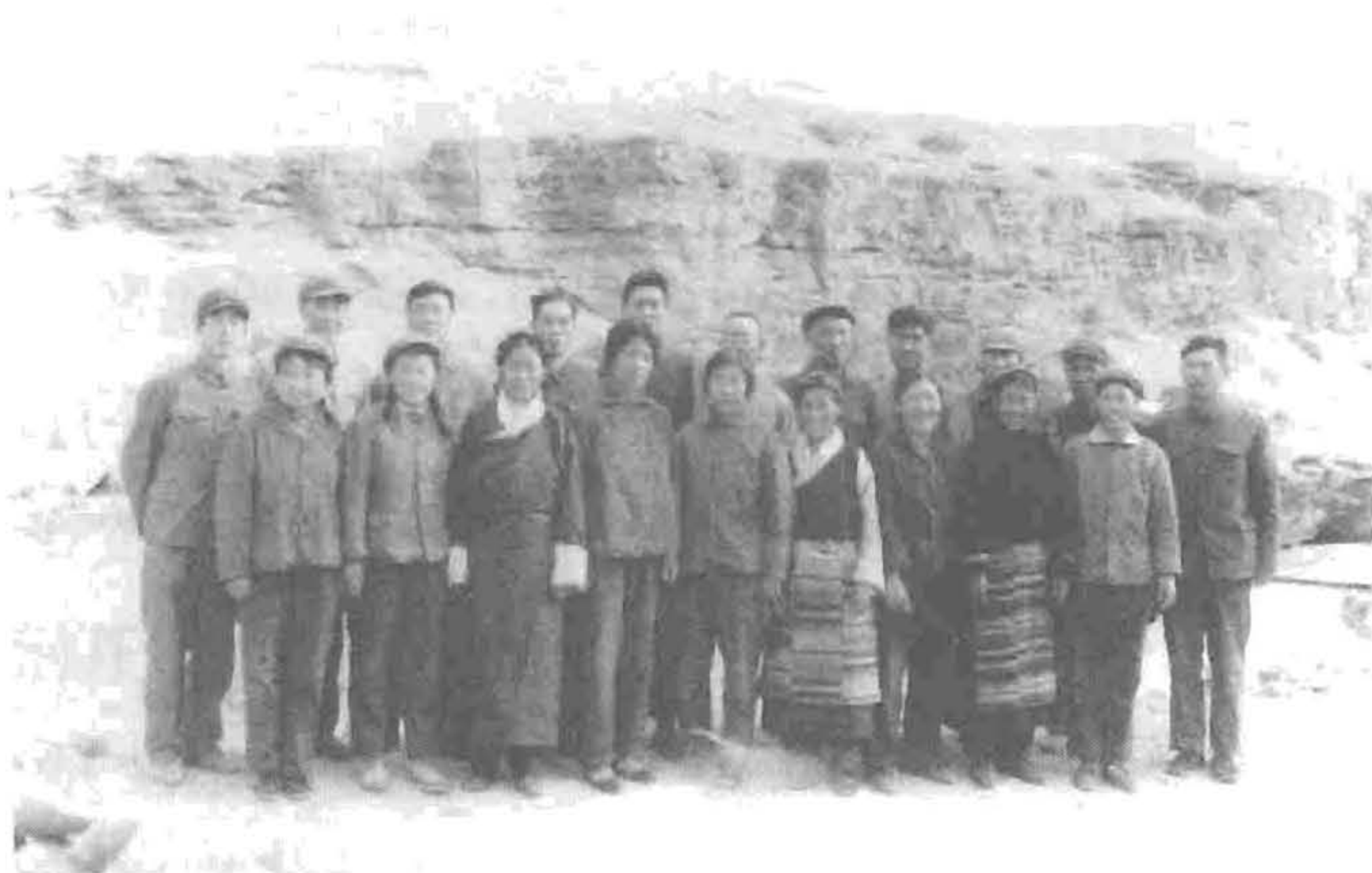
照片6 1976年6月，中央慰问团到西藏慰问时，援藏医疗队全体 成员与普兰县医院全体医护人员合影