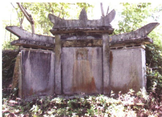
◆ 清光绪八年（1882年）大路村 邹氏族人建“贤乐坊”竖贤乐坊碑