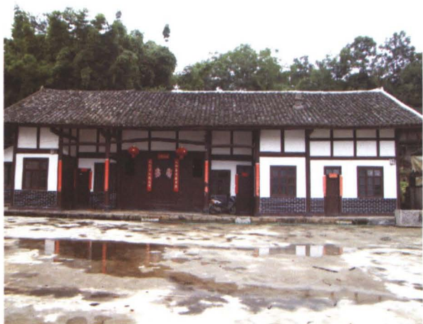
◆ 清代桑木坝杨姓修建的长五间木房