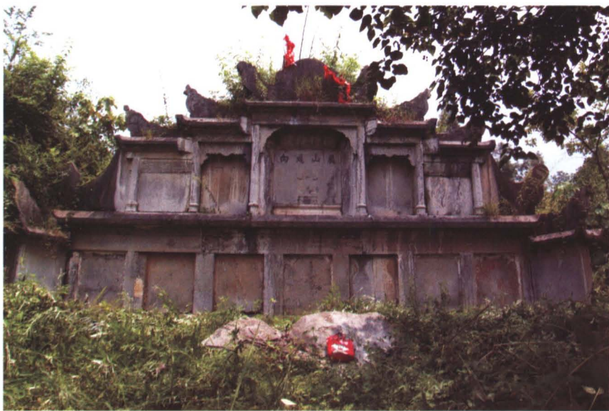
◆ 民国8年（1919年）修建的马禁台冉氏七函墓