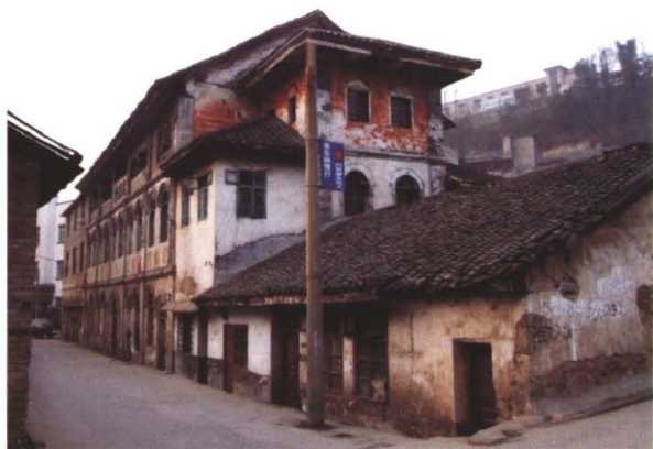
◆ 1951年县人民政府修建的大礼堂（东街社区办公用房）