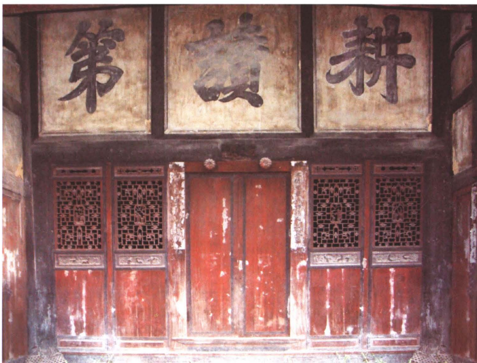
◆ 新城社区郑姓房屋雕刻