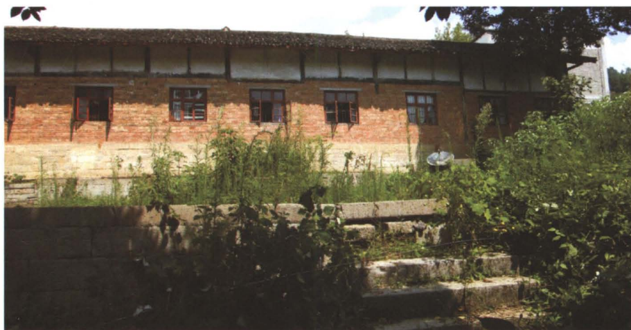
◆ 蟠溪寺始建于元顺帝至元二年（1336年），后毁。清咸丰九年（1895年）重建的中殿，为县级文物保护单位。