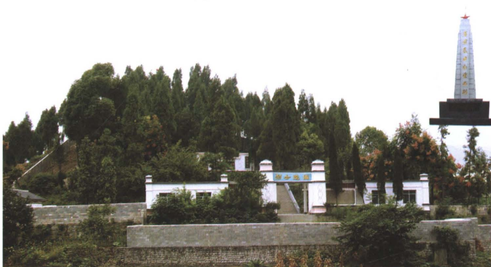
◆ 1975年建设成为纪念解放道真牺牲的中国人民解放军烈士陵园