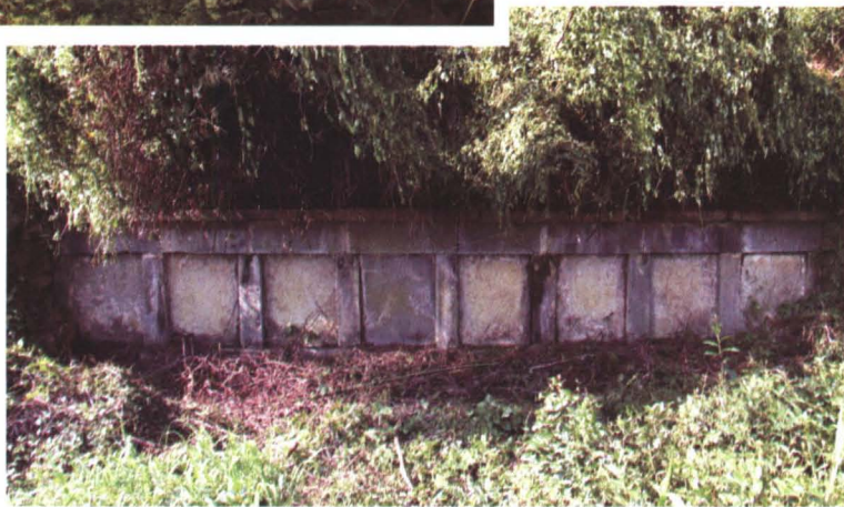
◆ 清道光二十四年（1845年）建于淞江村瑶山垵韩氏八室墓