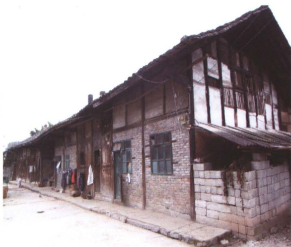
◆ 清同治九年（1870年） 构树程姓修建的长七间木房