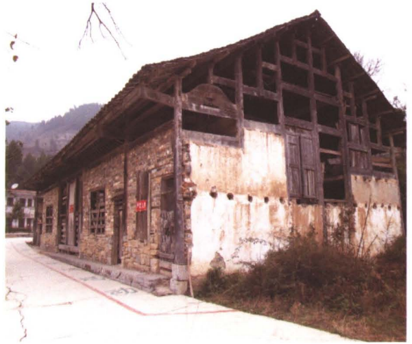
◆ 建于清同治十一年（1872年）的构树程家祠堂