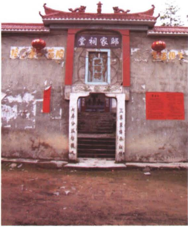
◆ 建于清雍正三年（1725年）的邹家祠堂