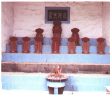
◆ 邹家祠堂祖宗牌位