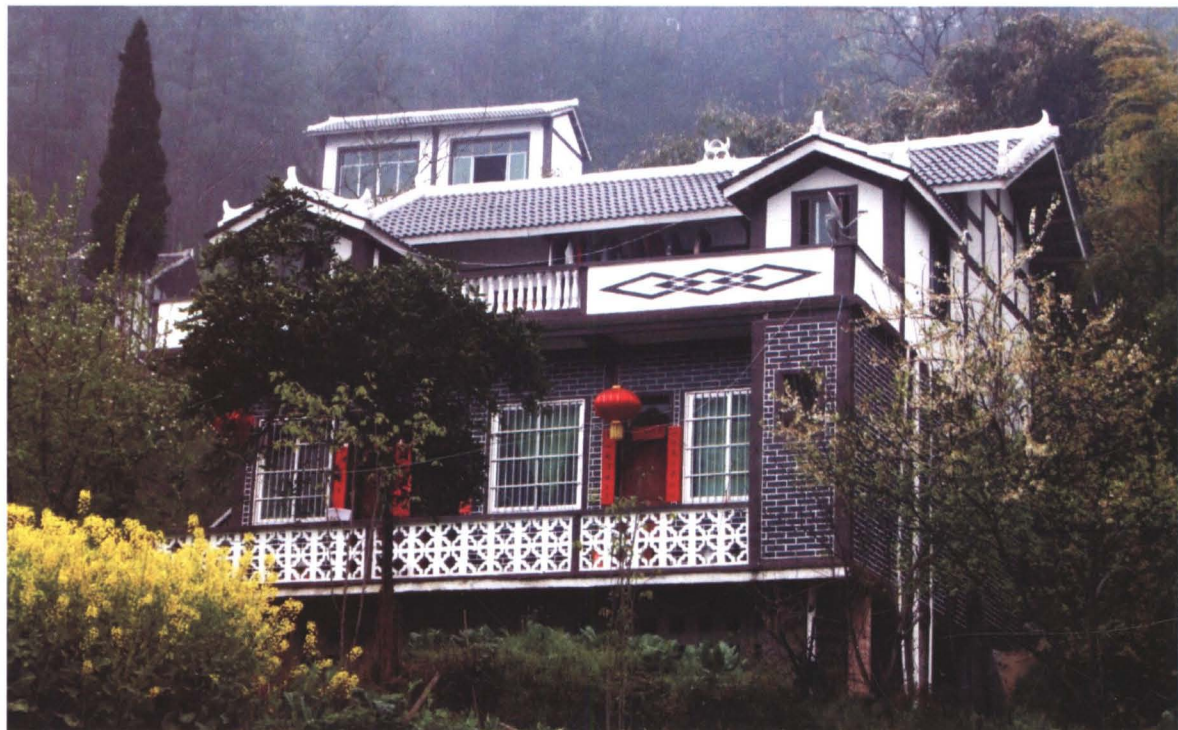
◆ 桑木坝修建的“黔北民居”新型房屋