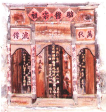
◆ 大路冷家祠堂祖宗牌位