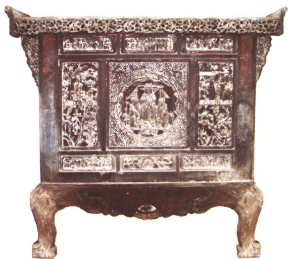
◆ 清代大路村蔡家香火（家龕）雕刻