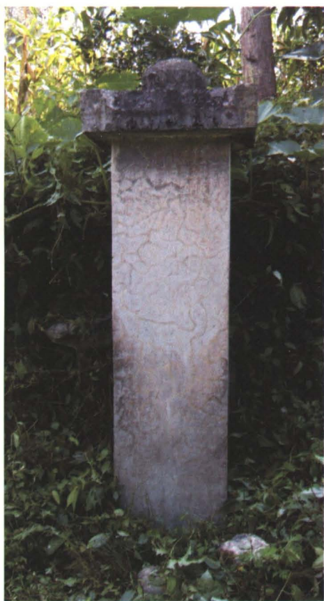
◆ 明嘉靖壬子年（1552年） 建大路村大官坪韩永珪墓