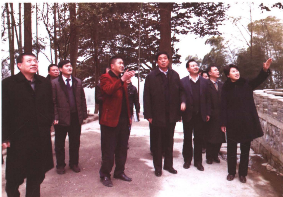
◆ 2011年12月28日，中共贵州省委书记栗战书（前排右三）在遵义市委书记喻红秋（右一）、市长王秉清（左一）陪同下视察桑木坝，县委书记肖发君（右二）、县长向承强（左二）、县委常委副主任、玉溪镇党委书记张晓刚（左三）陪同。