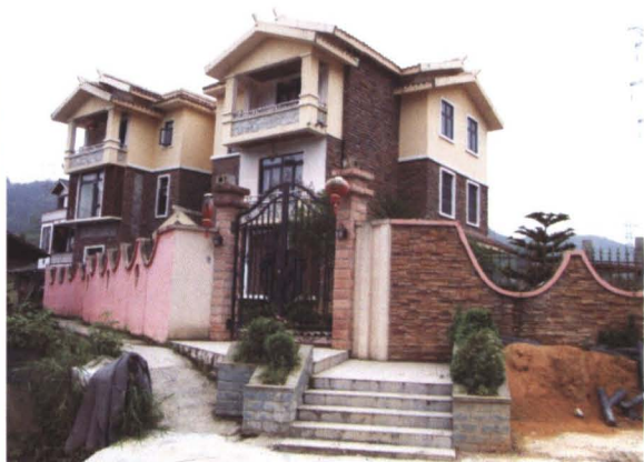
◆ 巴渔村修建的“黔北民居”