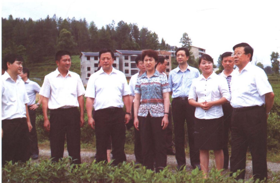
◆ 2011年7月1日，贵州省省长赵克志（右一）在遵义市委书记喻红秋（右五）遵义市市长王晓光（左三）陪同下在玉溪镇桑木坝视察。县委书记刘江年（右四）县长向承强（左一）、玉溪镇党委书记张晓刚（左二）陪同。