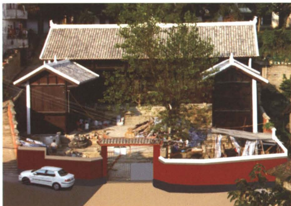
◆ 清道光十年（1830年）修建的万天宮 （省级文物保护单位）