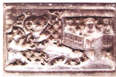
◆ 清代构树程姓家龕雕刻局部