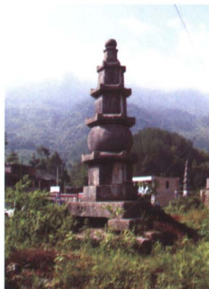
◆ 清代建造的蟠溪僧塔