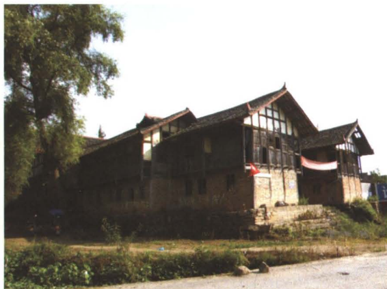
◆ 建于清光绪三十年（1904年）的天河寺