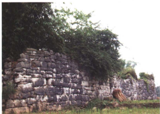
◆ 清咸丰九年（1859年） 建马禁台寨，部分寨墙尚存