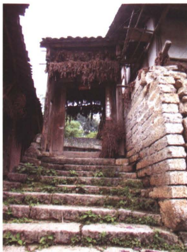
◆ 清代大路平老官韩姓修建的三合院朝门