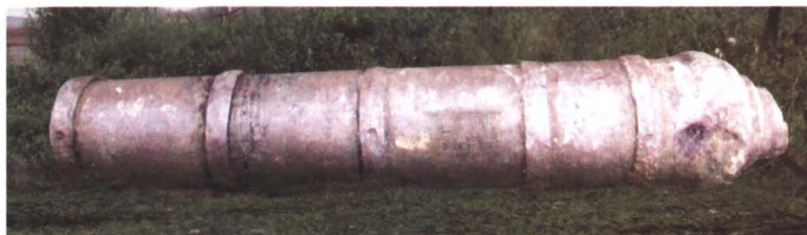
◆ 马禁台寨清“同治二年太平将军炮”