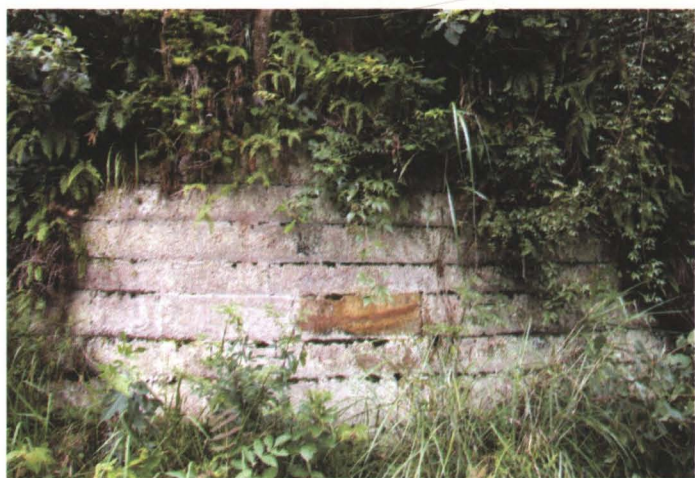
◆ 桑木坝杨氏宋墓（当地习称梯子坟）