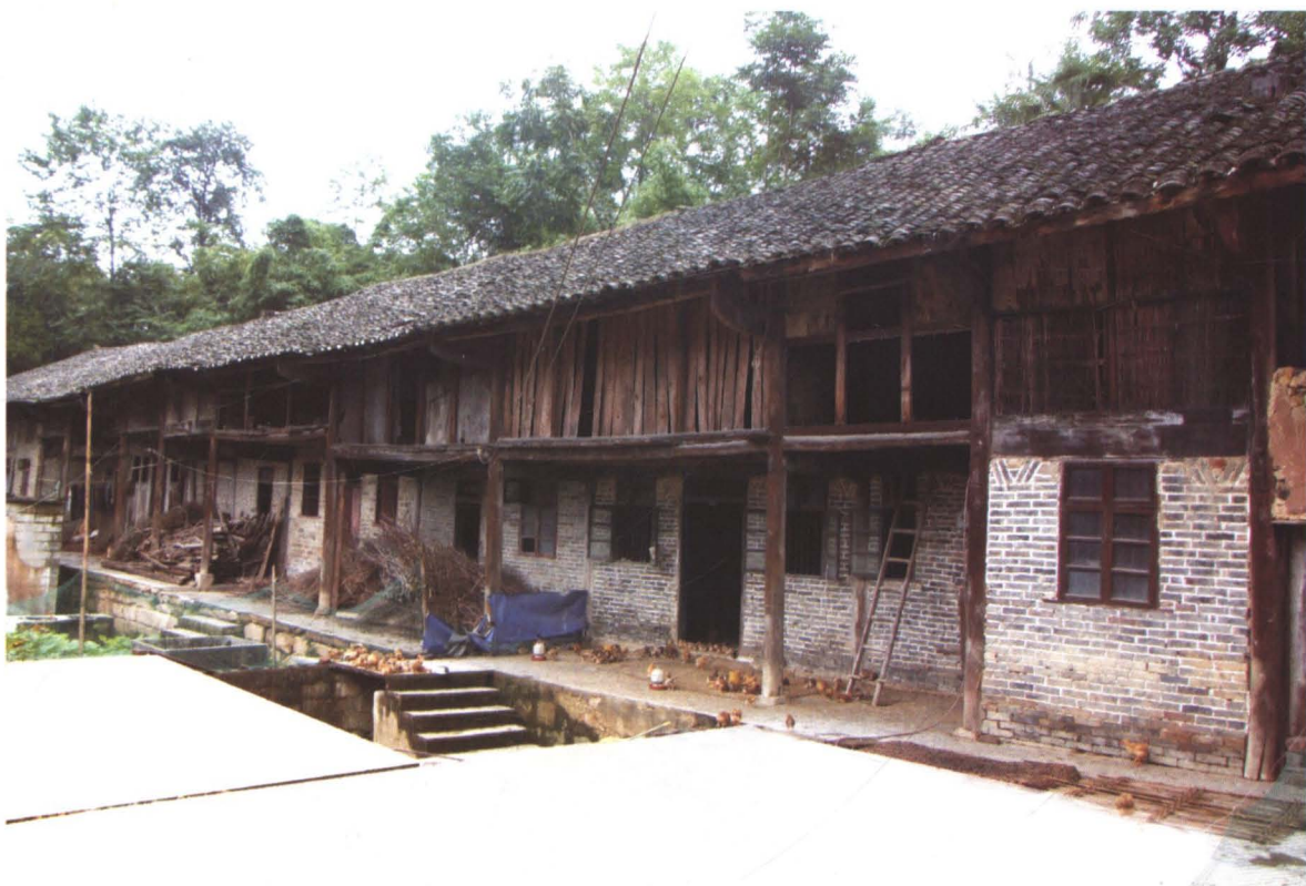
◆ 清代桑木坝杨姓修建的长九间木房