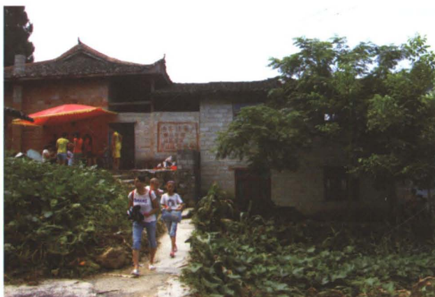
◆ 1995年玉溪镇民众筹资仿原貌重建的观音殿