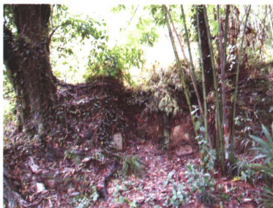
◆ 淞江村文堡坝古墓