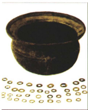
◆ 1980年10月大路陈家坡汉墓出土的铜洗、五铢钱