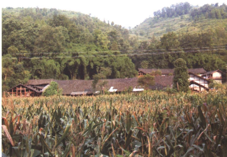
◆ 清乾隆元年（1736年）修建的明家沟四合院