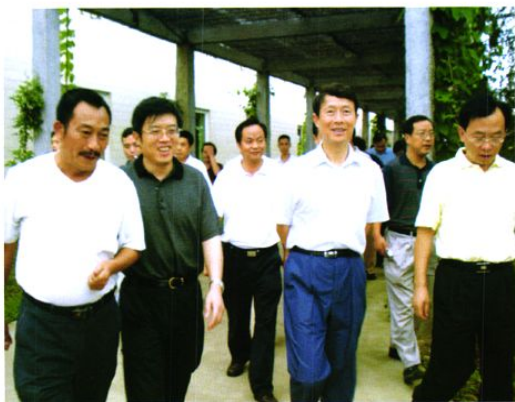
2007年7月27日四川省委副书记李崇禧(右二)到煎茶视察