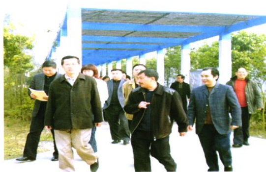
2007年12月18日国家发改委农经司 司长高俊才(左二)视察我镇