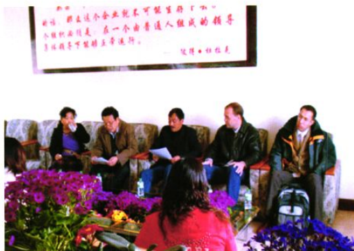
2007年3月13日联合国粮农组织亚太区域官员 考察煎茶镇生猪养殖情况