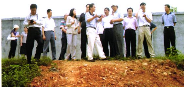
2007年5月22日全国人大常委会委员、农村和农业工作领导小组 副主任委员路明(右四)率人大代表考察团视察煎茶镇循环经济