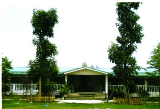
欧昇鹿岛休闲俱乐部