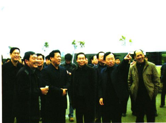
2008年8月28日四川省副省长张作哈(前排左二)视察我镇