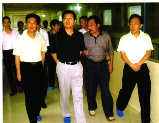
2008年8月24日中共成都市委副书记、市长葛红林(左二) 视察煎茶镇种养结合循环经济