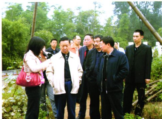
2007年10月18日成都市人大常委会主任骆隆森(左二)带队调研