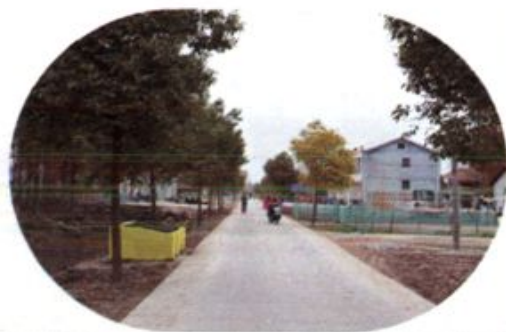
▲宽阔平坦的水泥路