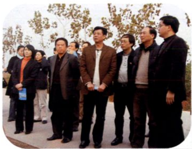
◀ 国家扶贫办副主任 刘坚（右二）在合兴 村视察