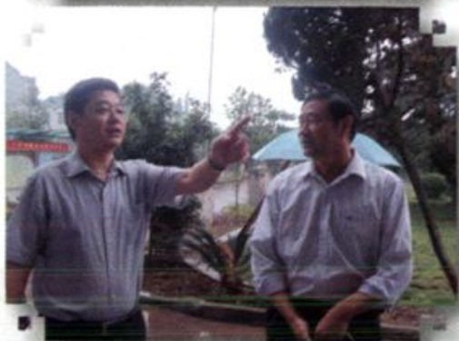
▲市委组织部部长严华在合兴调研党务工作