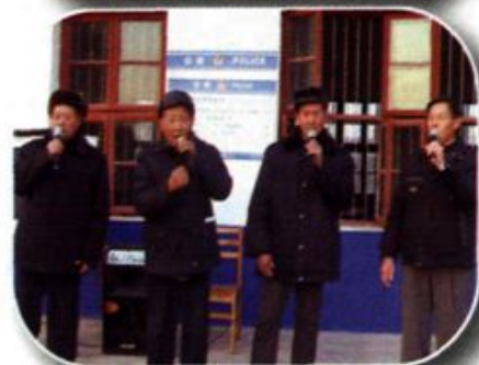
▲特有的河西文化“啰啰咚”