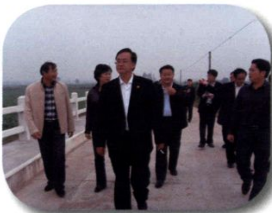
▼ 省财政厅王厅长（中）在合 兴村调研农业综合开发