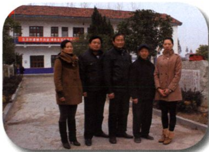
◀团结奋进的村支 两委一班人