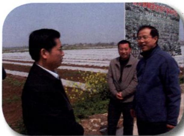
◀ 商务部副部长付自应 （右一）在合兴村调研 蔬菜产业发展