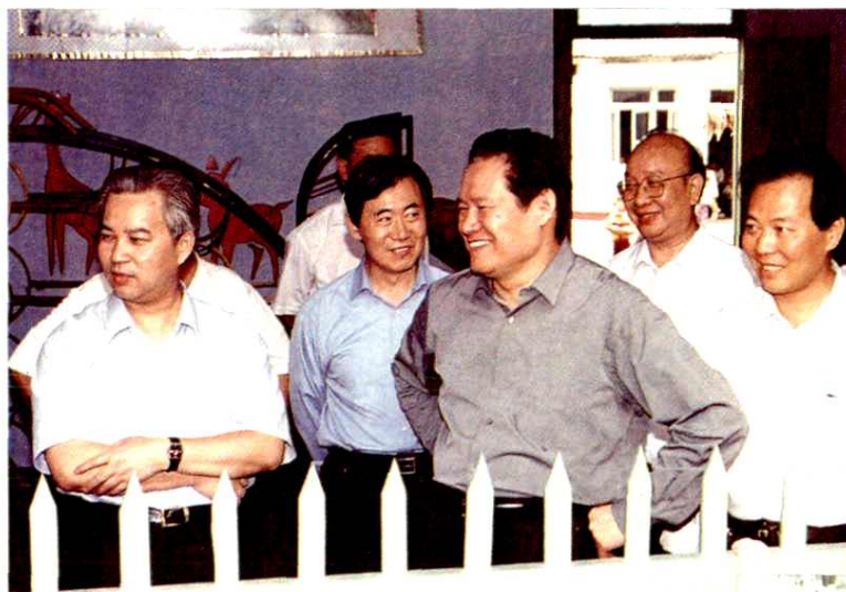
▲2000年9月，省委书记周永康，市委书记陶武先，市长王荣轩来太平镇视察。