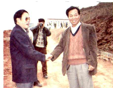
◀97年10月，省委副书记杨崇汇来太平镇视察荒山开发。