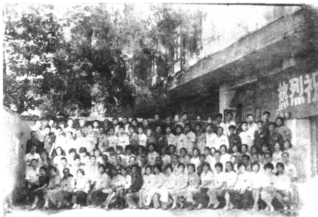
大方县工会第八次会员代表大会全体代表合影