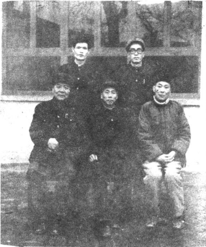
县工会主席、副主席及编志人员合影