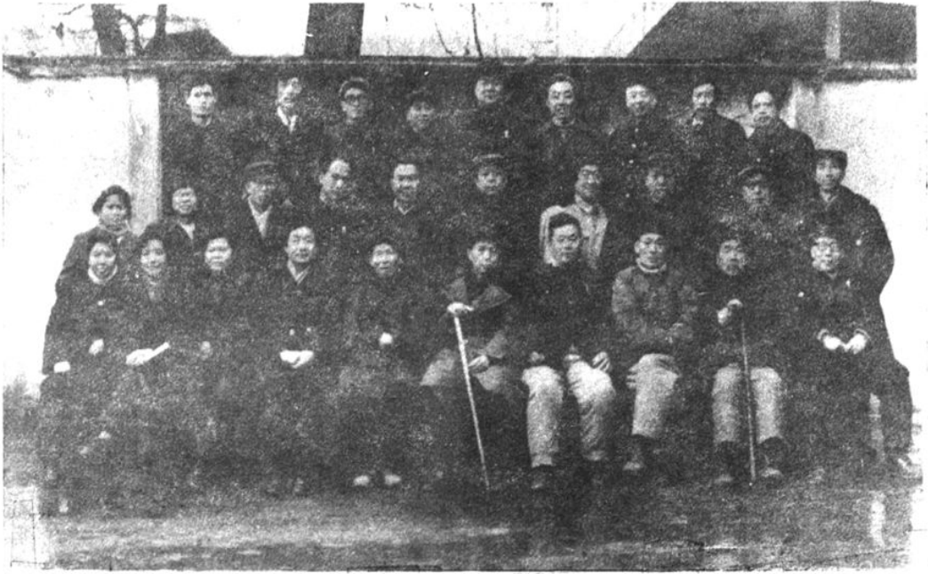
《工会志》审稿座谈会与会同志合影