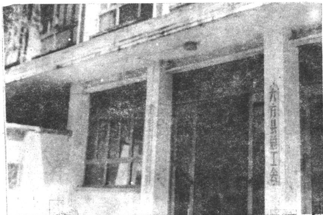
大方县总工会、工人俱乐部新址