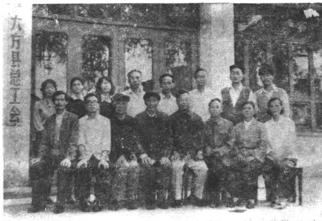
县总工会历届部份主席、副主席及工作人员合影