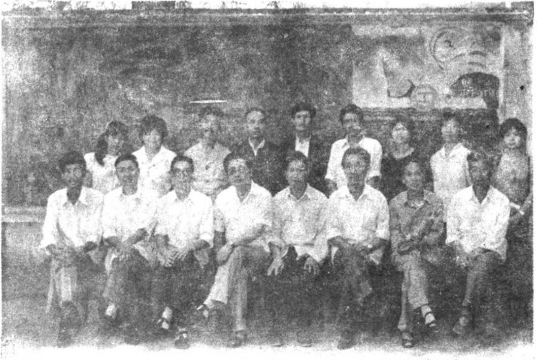
大方县工会第八届委员会委员合影