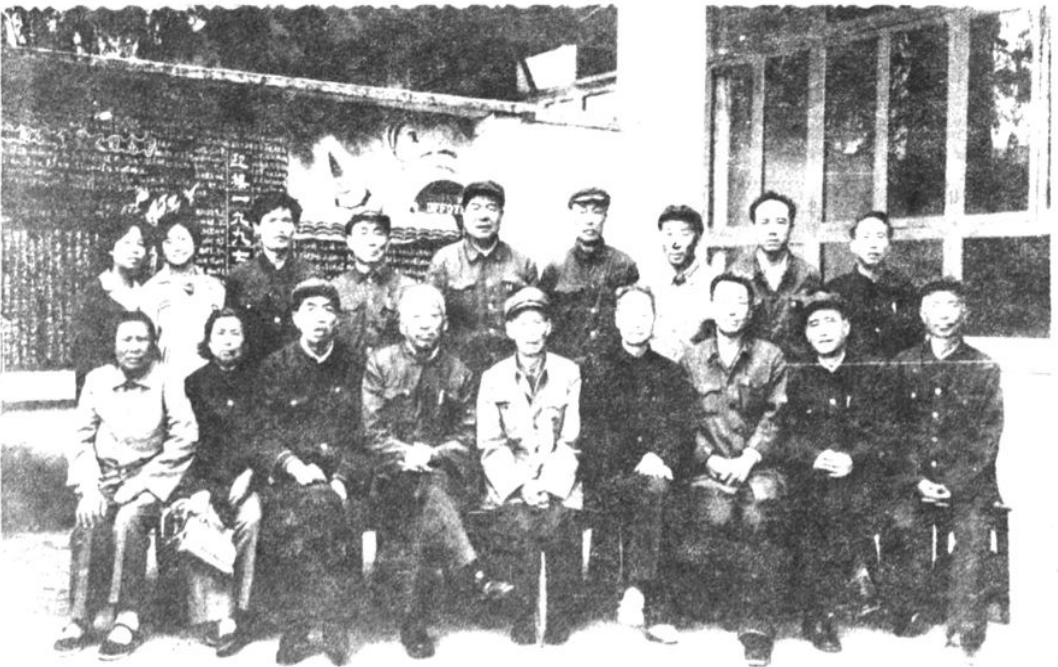
大方县工运史座谈会与会同志合影