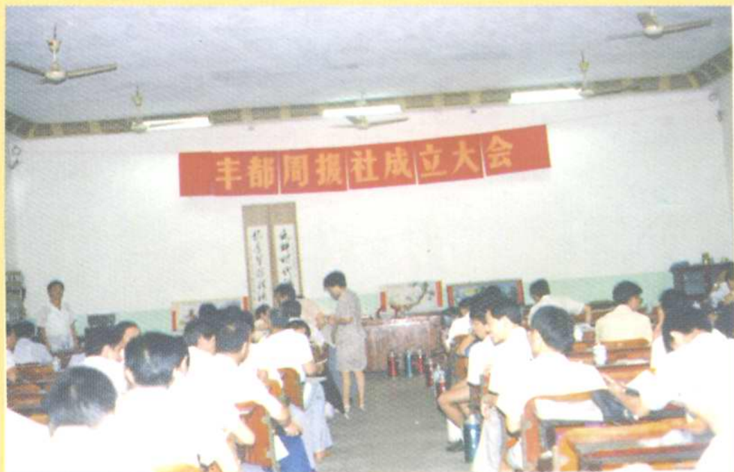
图为 1991 年 7 月 1 日丰都周报社成立大会会场