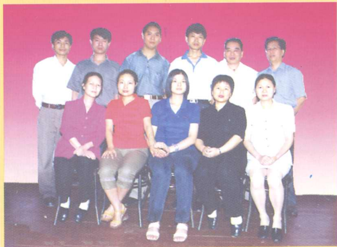
图为丰都报社全体工作人员近影