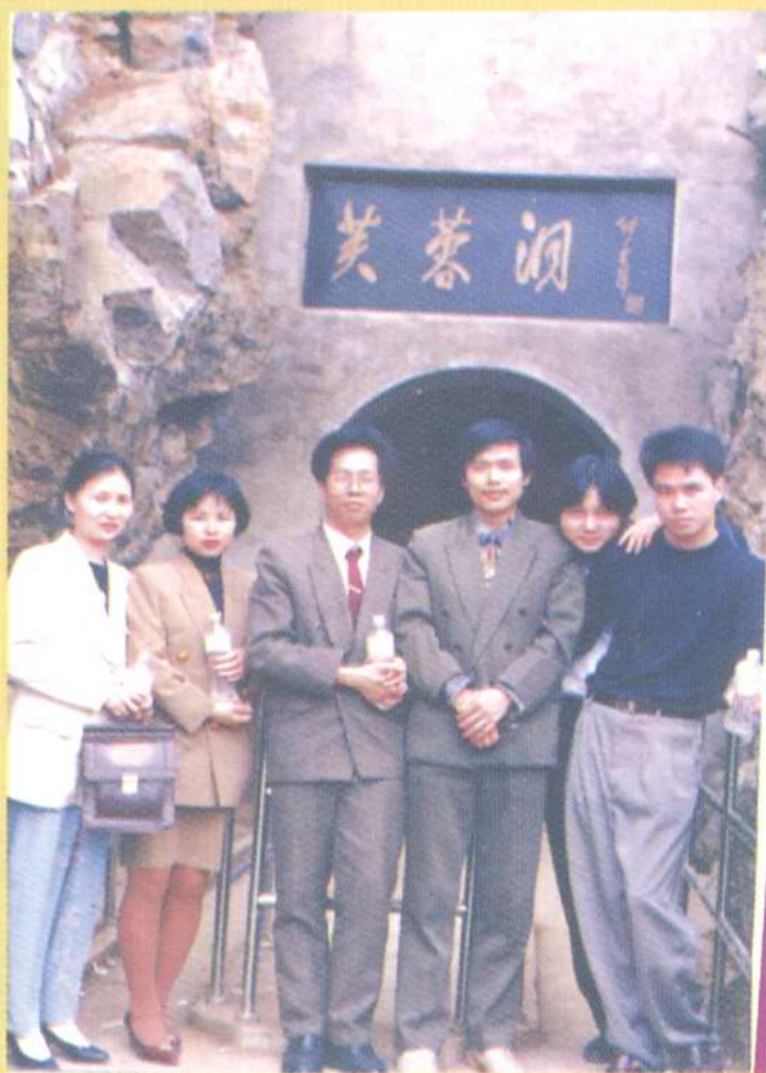
一九九五年四月二十二日，报社组织部分职工赴武隆县参观学习