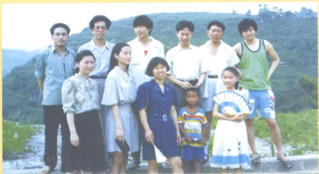
图为丰都周报社党支部组织党员、部分职工在郊外开展活动