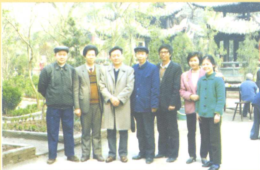
图为《丰都周报》创刊之初工作人员合影