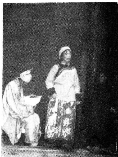
酉阳丝弦灯戏《挂画》