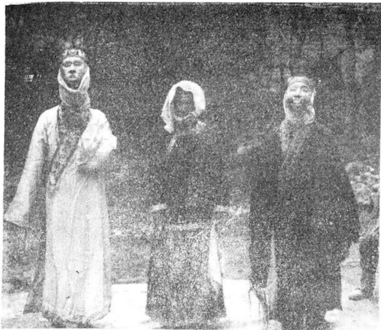
酉阳铜西掃卫阳戏班演出《忠孝记》前演员合影