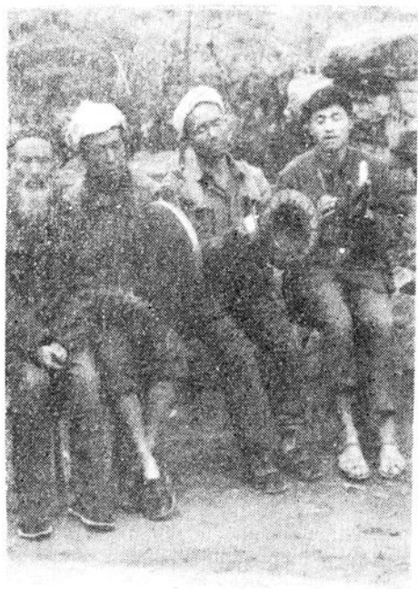
合谐的阳戏小乐队