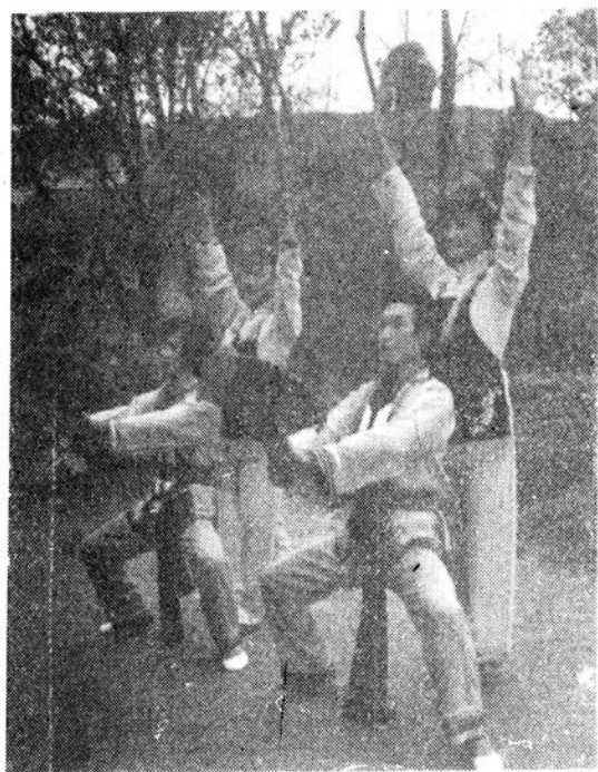
秀山花灯歌舞剧团演出《双采茶》