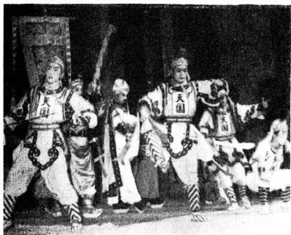
垫江县川剧团演出新编历史故事剧 《翼王旗下四姑娘》剧照之一