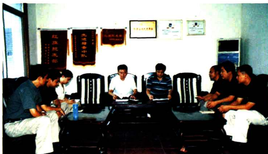
分局(中心)行政办公会