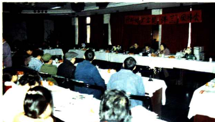
分局(中心)与什邡卷烟厂召开经营户新春团拜会