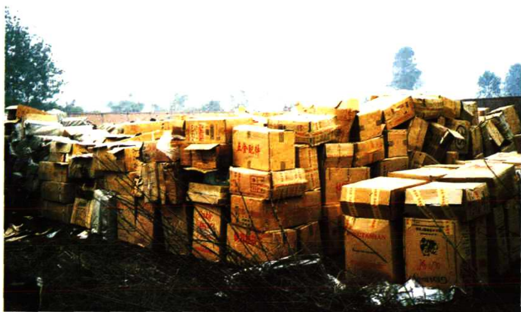
销毁假冒卷烟现场