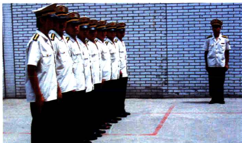
稽查队 员们整装待 发