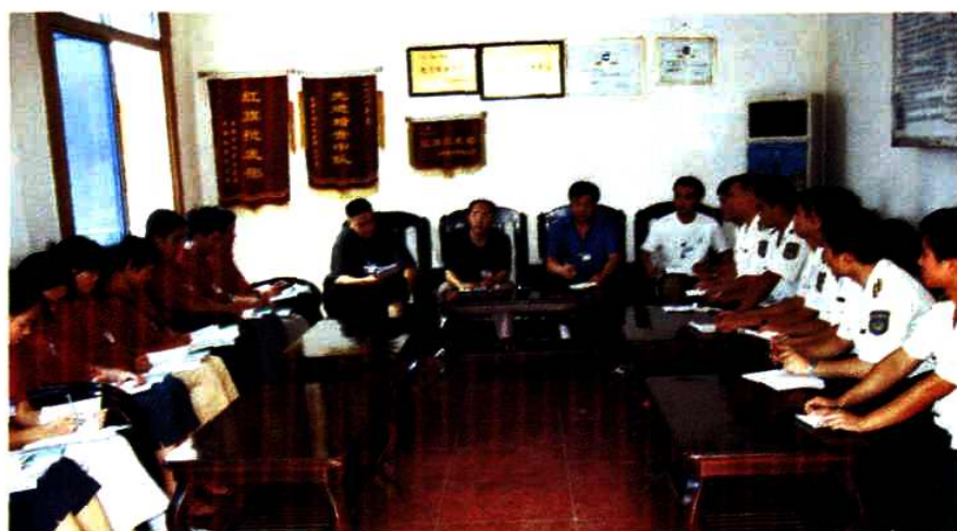
分局(中心)每周召开一次专销结合会