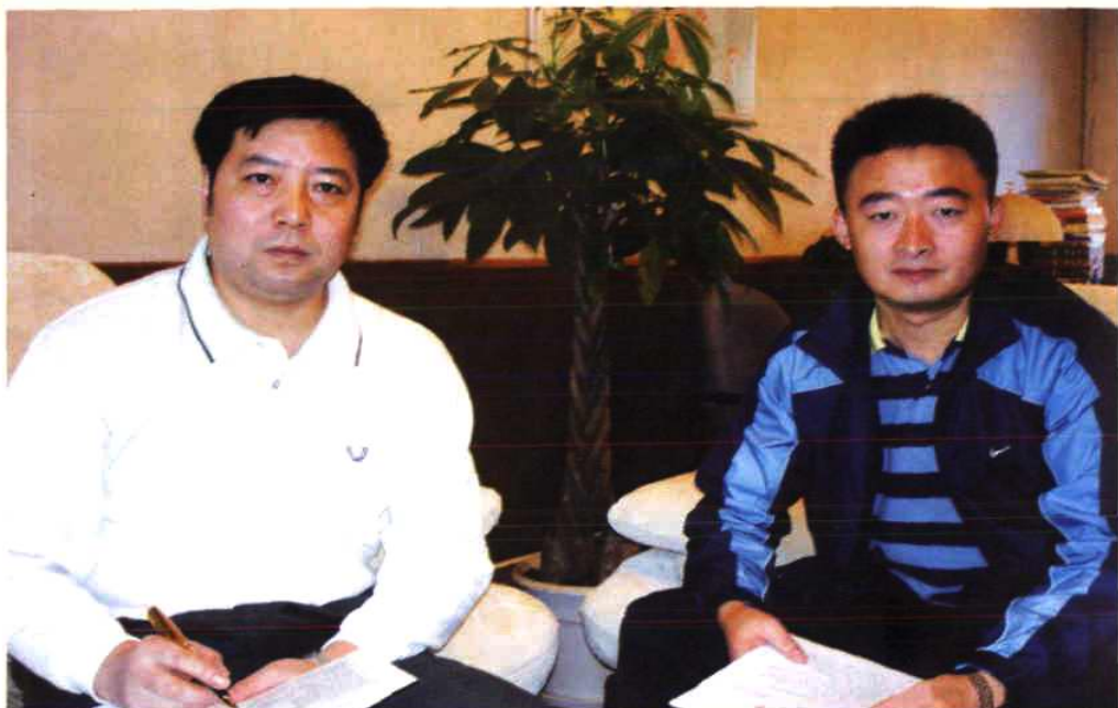
成都市龙泉驿区烟草专卖分局(中心)领导班子