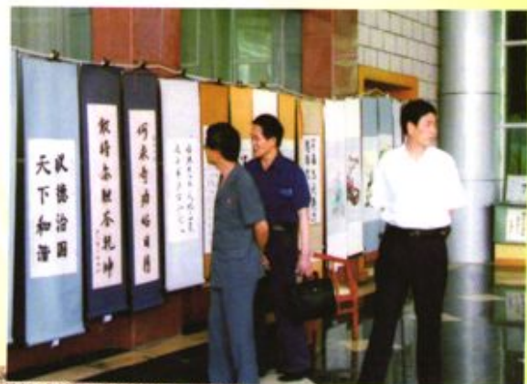
▶ 在毕节地区中级人民法院举办廉政建设书画展