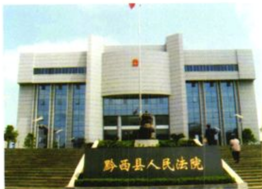
▲ 黔西县人民法院新办公楼