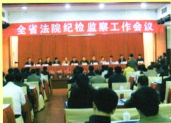
▲ 2007年4月19日，贵州省法院纪检监察工作会议在黔西县召开