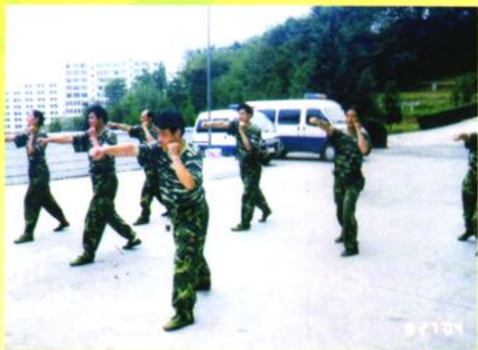
◀ 2004年8月27日， 毕节地区中级人民法院组织干警训练