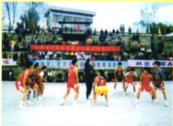
◀ 1996年10月，毕节地区法院系统举办第四届篮球运动会