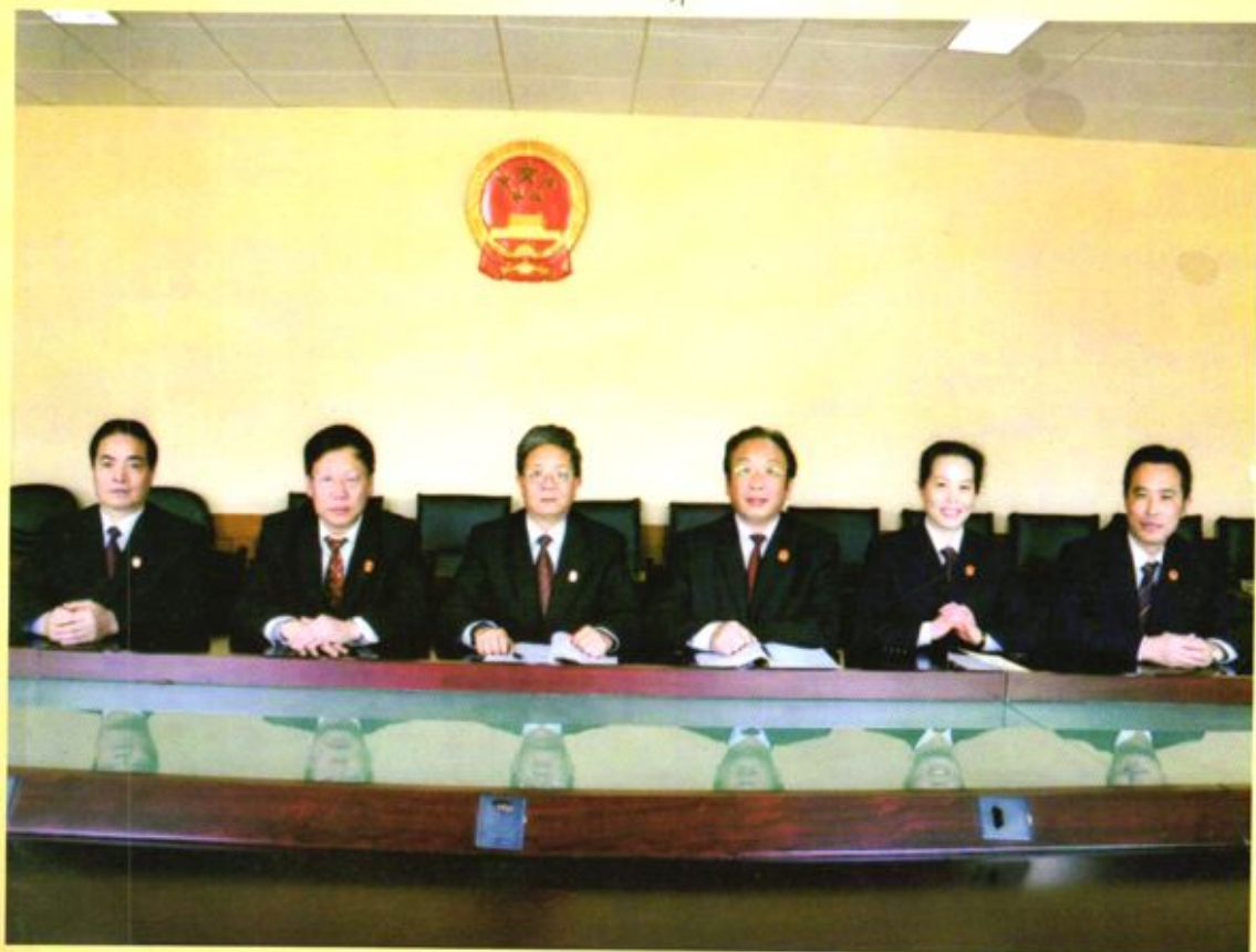
▲ 中共毕节地区中级人民法院党组成员（2009年后）