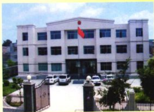
▲ 黔西县中山人民法庭办公楼