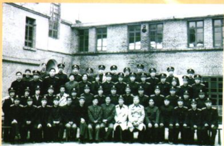
▶ 1987年10月，贵州省经济审判工作经验交流会在大方县召开