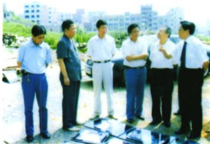
◀ 2006年8月，最高 人民法院原副院长刘家琛（右一）在黔西 考察县法院新办公楼 建设