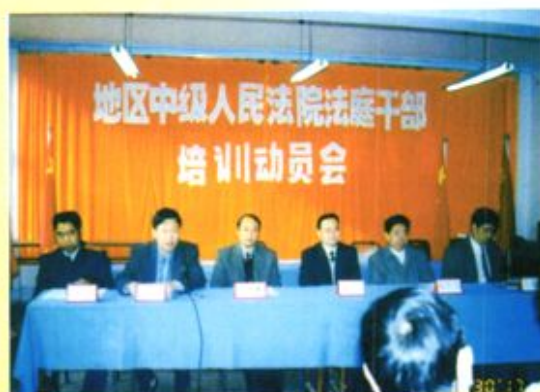
◀ 毕节地区中级人民法院举办法庭干部培训