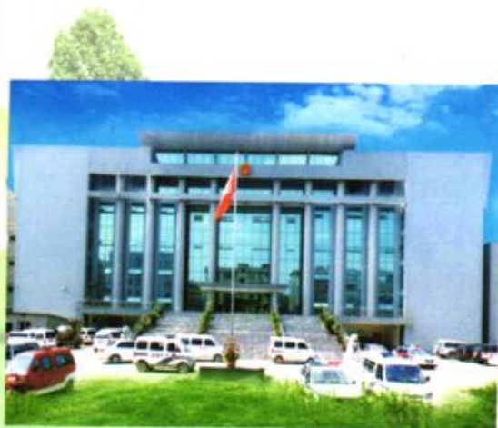
▶ 1992年后织金县人民法院办公楼