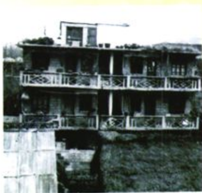
▲ 大方县人民法院原干警宿舍