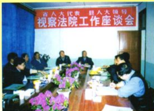
▲ 金沙县人民法院向人大代表汇报法院工作