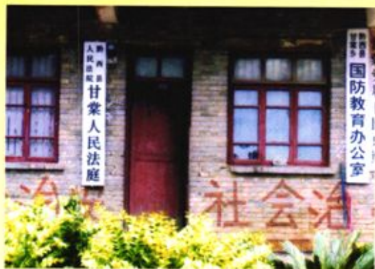
◀ 黔西县人民法院甘棠法庭原办公楼