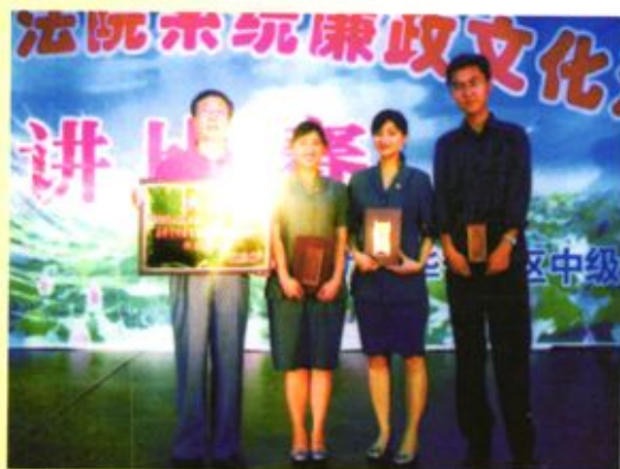
◀ 在毕节地区法院系统廉政文化活动中，黔西县法院获组织奖