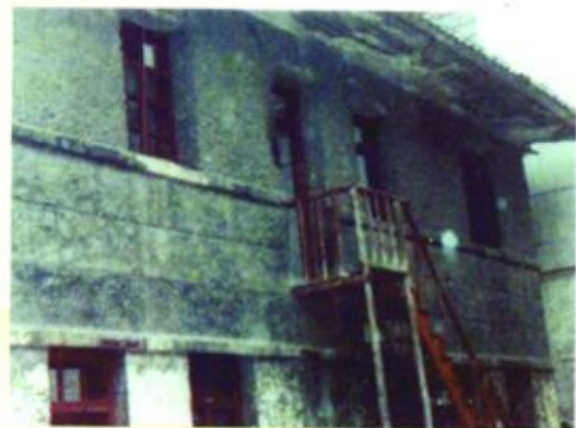
◀ 1992年前织金县人民法院办公楼