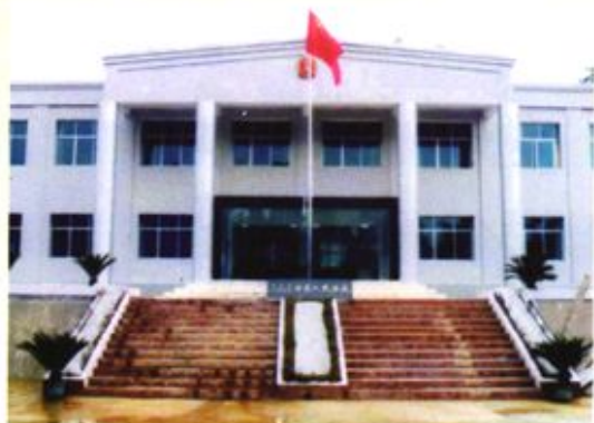
▶ 黔西县人民法院甘棠法庭新办公楼