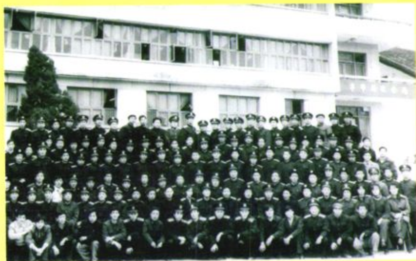
◀ 1986年12月，毕节地区“民法通则培训班”全体干警合影