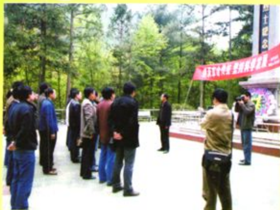
◀ 毕节地区中级人民法院组织干警到烈士陵园开展革命传统教育活动