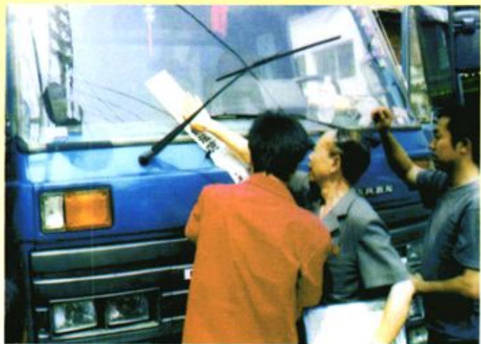
◀ 2005年8月15日， 大方县人民法院采取 诉前保全措施依法查 封货车