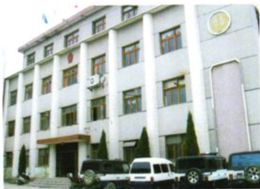
▲ 黔西县人民法院原办公楼