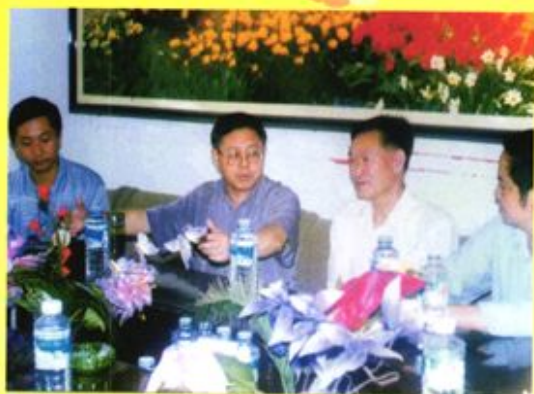
▲ 1998年4月，贵州省高级人民法院原院长张林春到纳雍县人民法院考察调研