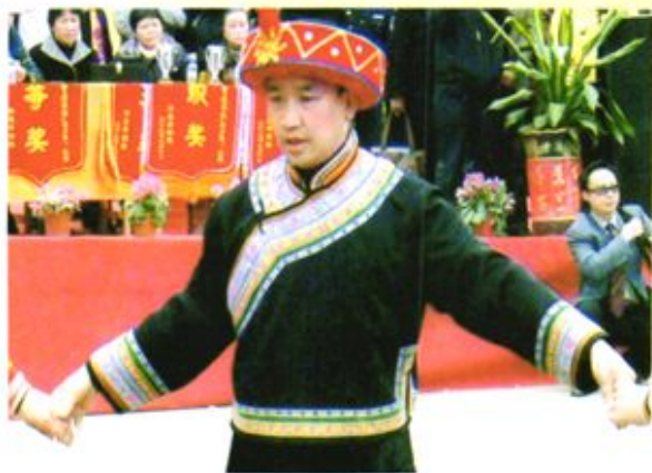
◀ 2009年，纳雍县人民法院干警参加县举办的彝族舞蹈比赛