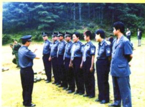
▶ 大方县人民法院组织干警训练