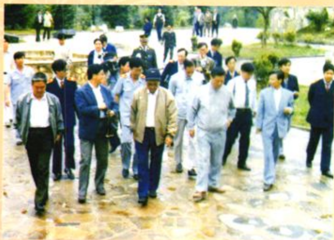
◀ 1992年9月，最高人民法院常务副院长华联奎（前排左五）到黔西县检查工作