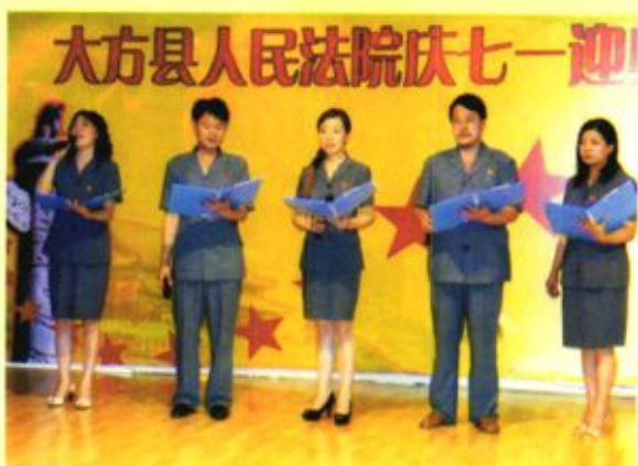
▶ 2008年6月30日，大方县人民法院“庆‘七一’迎奥运”文艺晚会