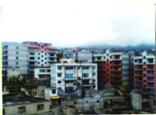
▲ 大方县人民法院干警新宿舍区