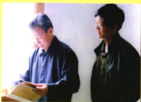
▲ 2009年3月，贵州省高级人民法院原院长谢锦汉（左）在毕节地区中级人民法院院长王建新的陪同下，到黔西县金碧人民法庭考察调研