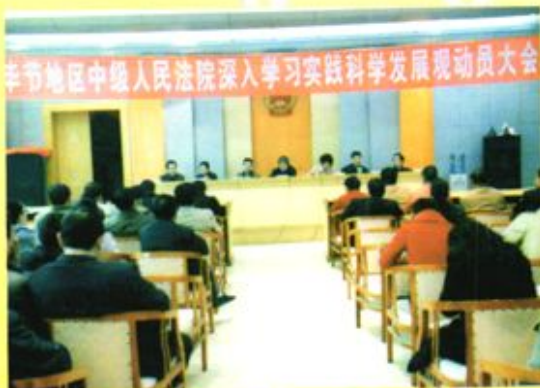
◀ 2009年3月9日，毕节地区中级人民法院召开深入学习实践科学发展观动员大会