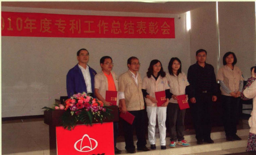
2011年10月14日，区科委到长安跨越召开2010年度江北区专利工作总结表彰会。