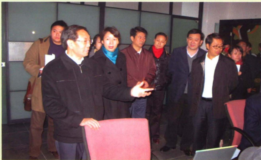
2009年1月15日，重庆市委常委、宣传部部长何事忠（左一）视察五里店工业设计中心，市科委主任周旭（右二）、区委书记史大平（左三）、区长陶长海（右一）、区科委主任彭钧（左二）陪同视察。