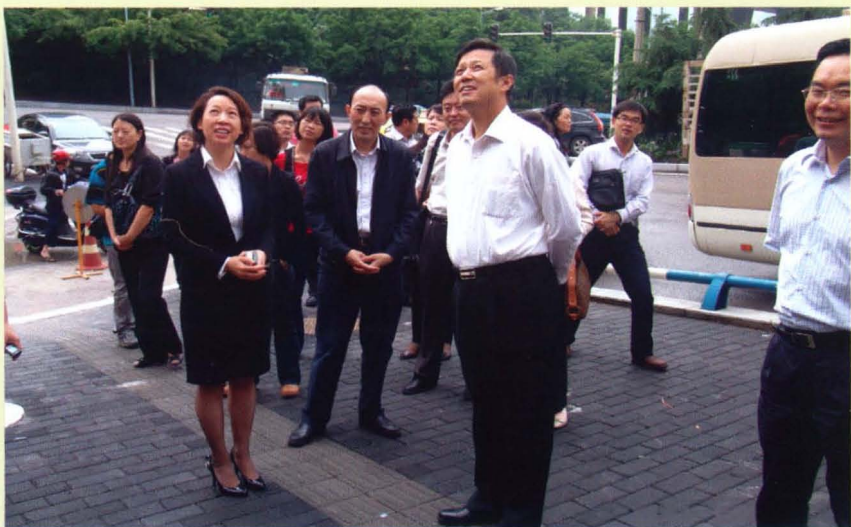
2011年5月31日，区长何贵（左二）、区科委主任彭钧（左一）陪同国家统计局副局长许宪春（右二）考察五里店工业设计中心。