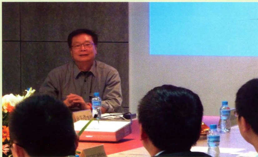
林教授与园区进行学术交流

国家级科技孵化器——重庆五里店工业设计中心备受社会广泛关注。2010年10月15日，区科委邀请香港理工大学林衍堂教授到该中心北岸研发设计创意园考察指导。（上图为园区外景）。