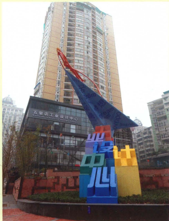
江北区人民政府联手重庆市科委打造的国家级科技孵化科技园区——五里店工业设计中心外景

五里店工业设计中心二期3万平方米经过两年多装修建设，于2011年落成，从而“中心”被国家科技部认定授予“国家级科技企业孵化器”。