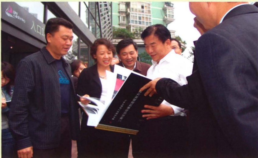
2009年10月10日，重庆市市长王鸿举（左四）到五里店工业设计中心视察，市科委主任周旭（左三）、区委常委、副区长高洪波（左一）、区科委主任彭钧（左二）陪同视察。