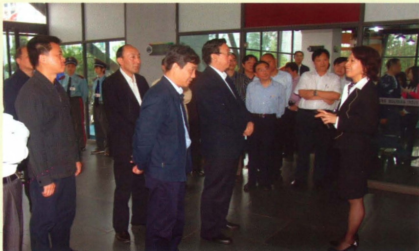
2010年5月13日，区政府区长何贵（左二）、副区长高洪波（左一）陪同河南省省长郭庚茂（左四）考察五里店工业设计中心。