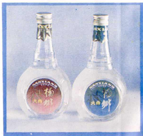
贵州省优秀新产品 ——楠乡大曲酒