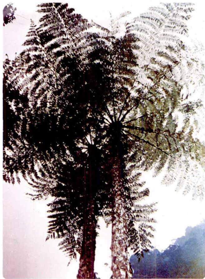
国家一级保护植物——桫欏