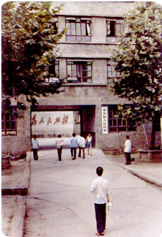
赤水县人民政府 办公大楼