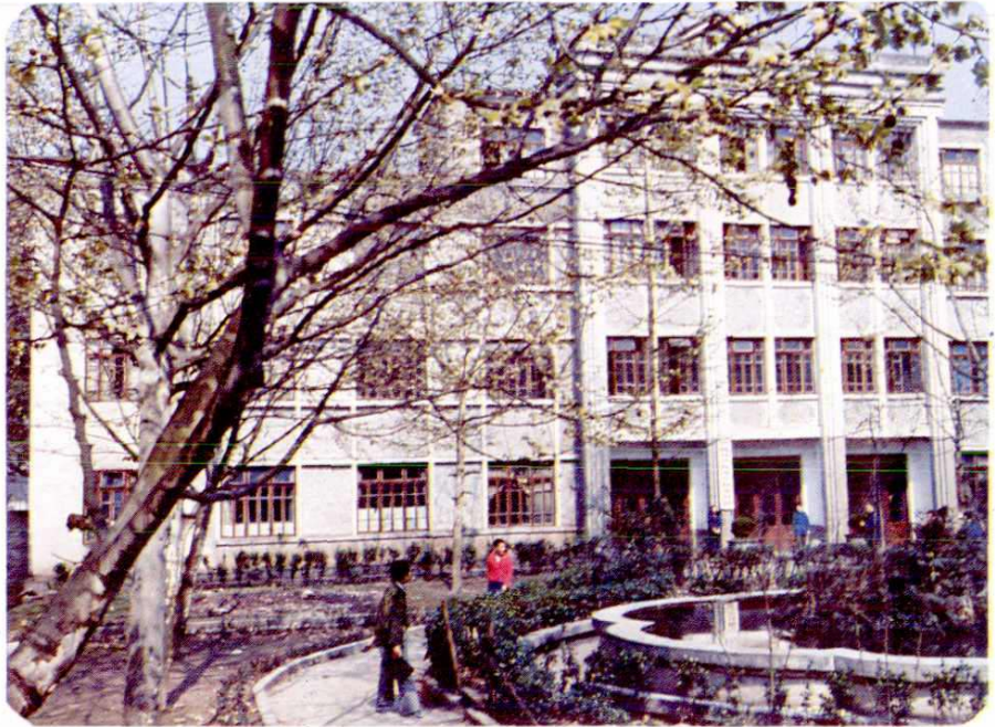
中共赤水县委办 公大楼