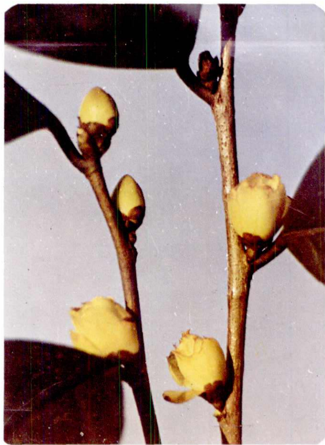
新发现的珍稀油茶物种——小黄花茶