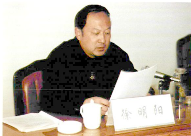
2000年3月，自治区党委副书记、自治区常务副主席徐明阳出席全区建设工作会议并讲话。