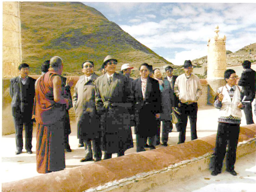
1997年10月，自治区党委常务副书记、自治区主席列确（左三）视察甘丹寺。