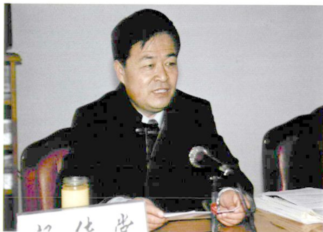
1997年3月24日，自治区党委副书记、自治区常务副主席杨传堂出席全区建设工作会议并讲话。