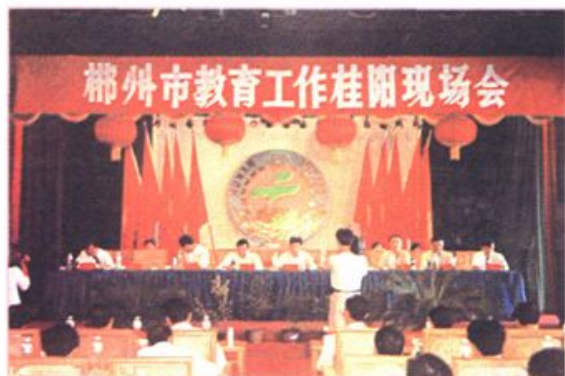
1996年郴州市教育工作现场会在桂阳召开