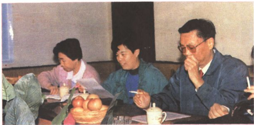
1995年国家教委基础教育司的领导（左一、二）来县视察