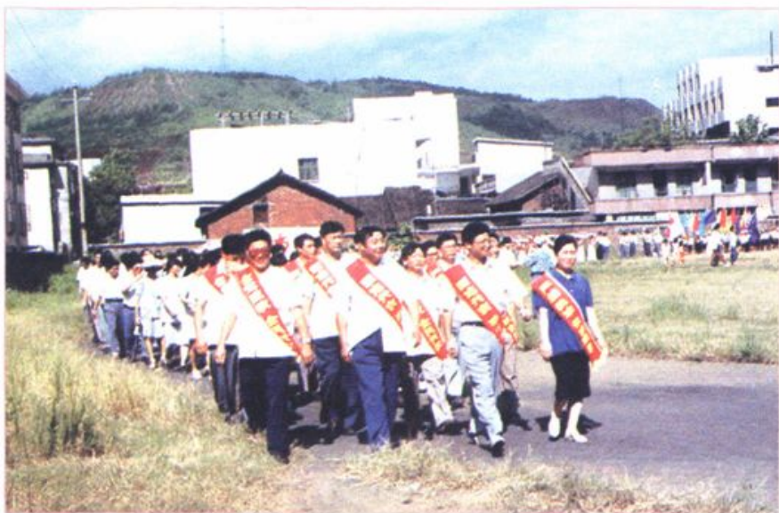
县四家领导带领千余名师生从体育馆出发宣传《教育法》