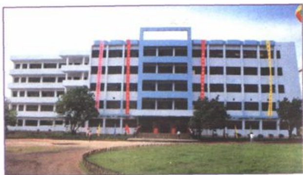
气势雄伟的科技大楼