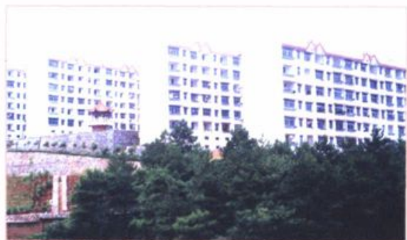
雄伟壮观的教师新村