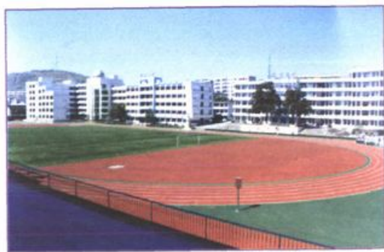
教学区建筑群及气势恢宏的田径场