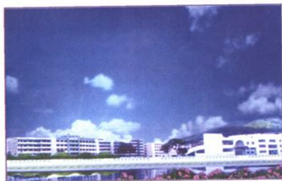
远眺校园——玉宇映蓝天、花开镜湖畔