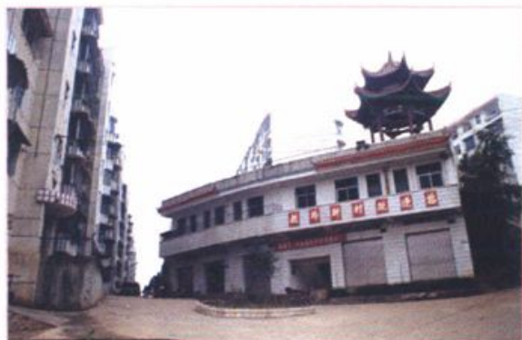
占地80.3亩，投资3000余万元，已建成258套教职工住房，内设医院、商店、老年活动室、篮球场、门球场的教师新村建筑