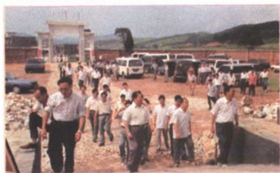
外县市的领导兴致勃勃地来桂阳参观