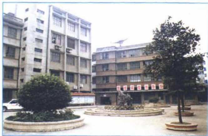
局机关办公及教育工会大楼