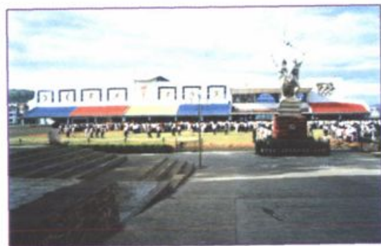
全省一流的中学体艺馆