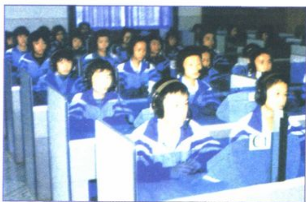
设备先进的语音室