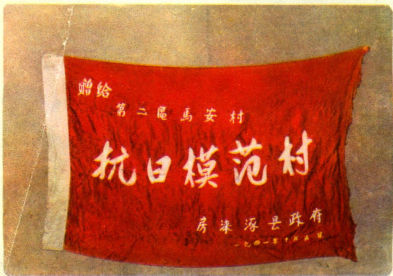
一九四一年秋季反扫荡后，房涿涿县政府授予马安村的奖旗