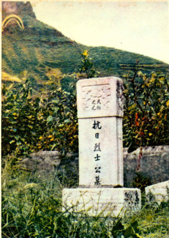
王家台村外的抗日烈士纪念碑