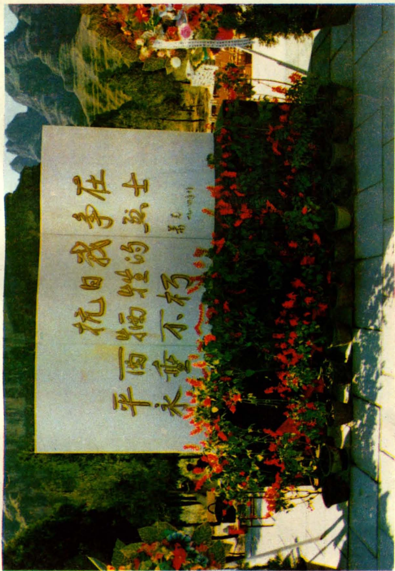
矗立在十渡龙山的平西烈士纪念碑