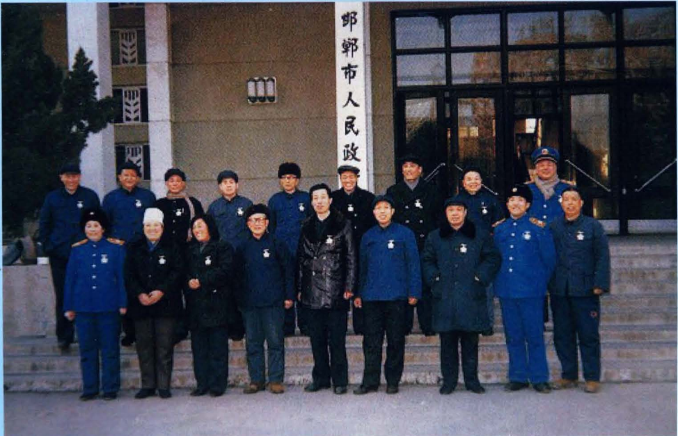
原邯郸市从事卫生防疫工作三十年人员合影