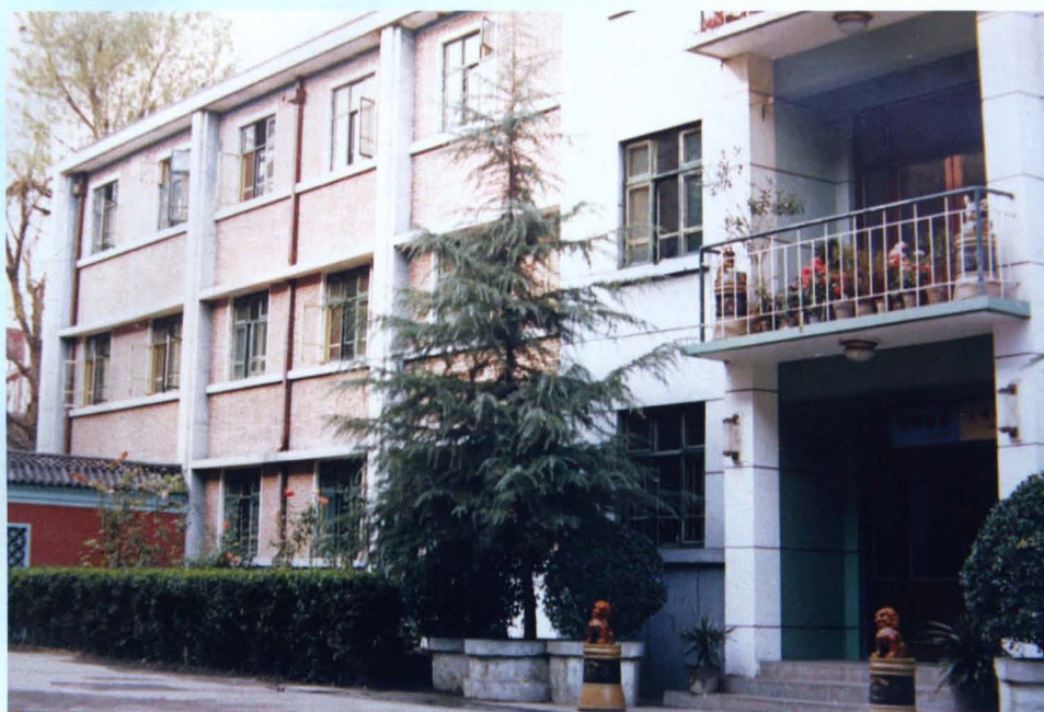
邯郸地区卫生防疫站办公楼