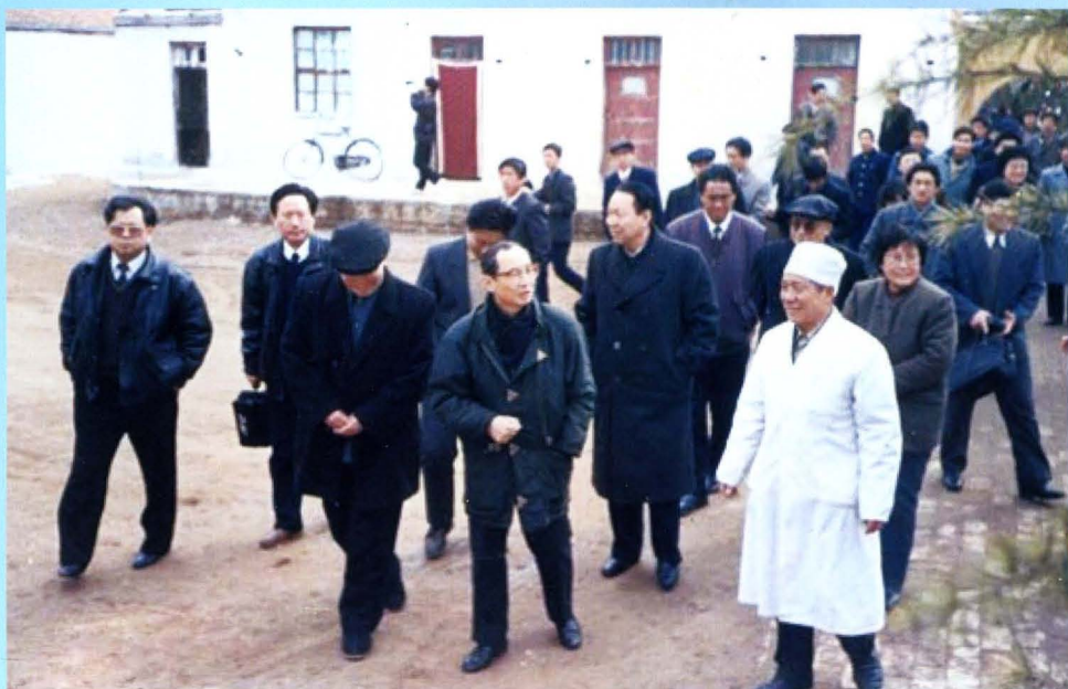
原卫生部陈敏章部长（前排中）到邯郸考察乡镇卫生院 初级卫生保健和基层预防保健网建设以及农村改厕工作