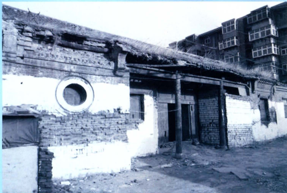
邯郸专区卫生防疫站1959年建站初期办公地址