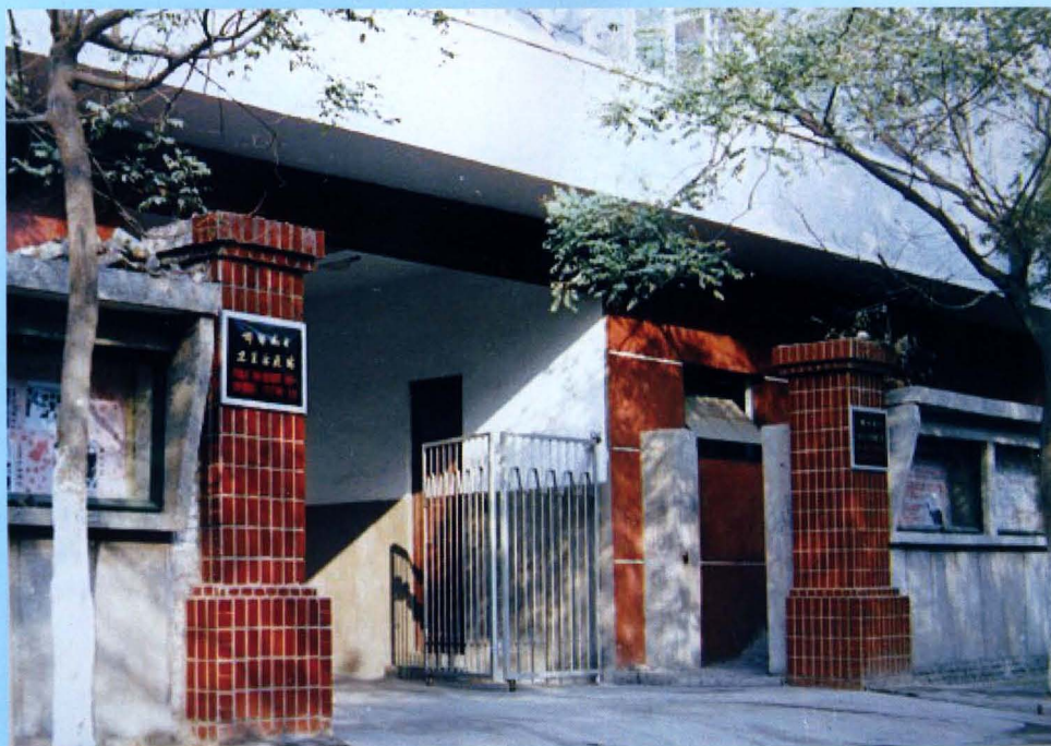
邯郸地区卫生防疫站办公地址