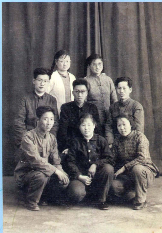
五十年代初邯郸专区卫生防疫队部分队员合影