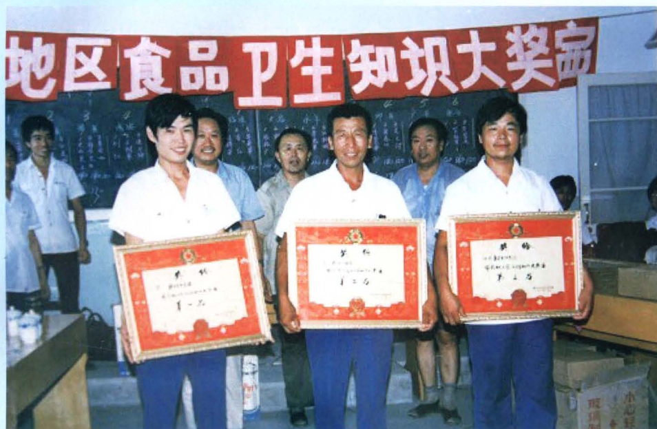
邯郸地区卫生局卢业局长（后排左3）为全区食品卫生知识大奖赛获奖者颁奖