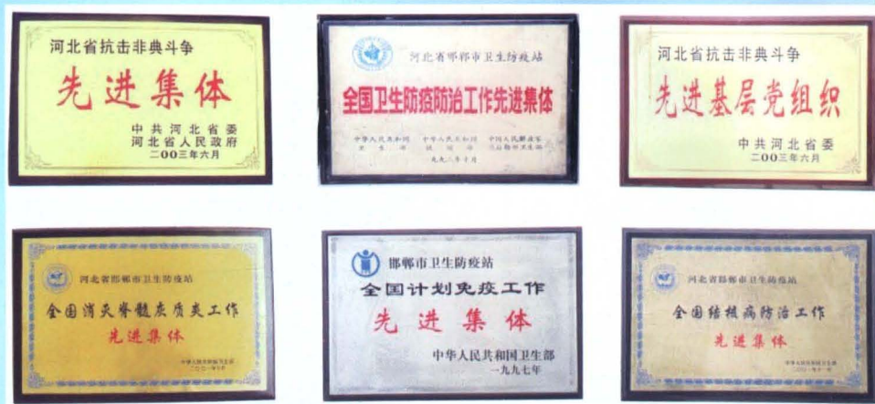
邯郸市卫生防疫站荣获的全国、河北省先进集体荣誉表彰