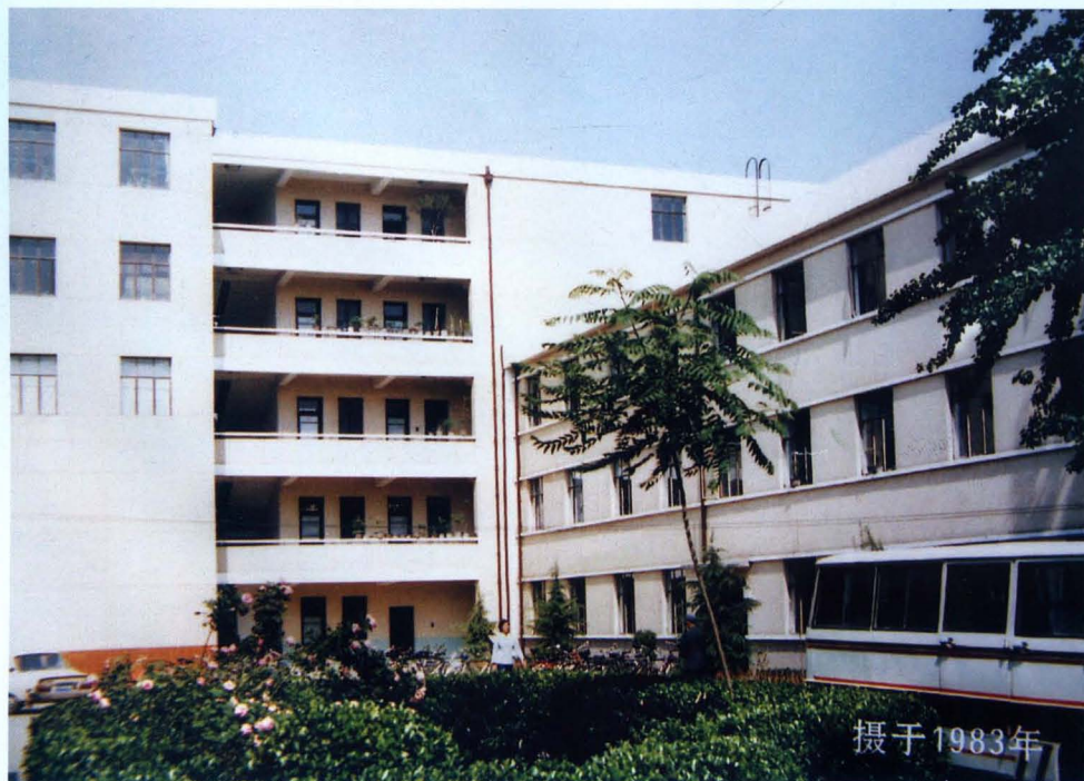
原邯郸市卫生防疫站1956年建站初期办公地址