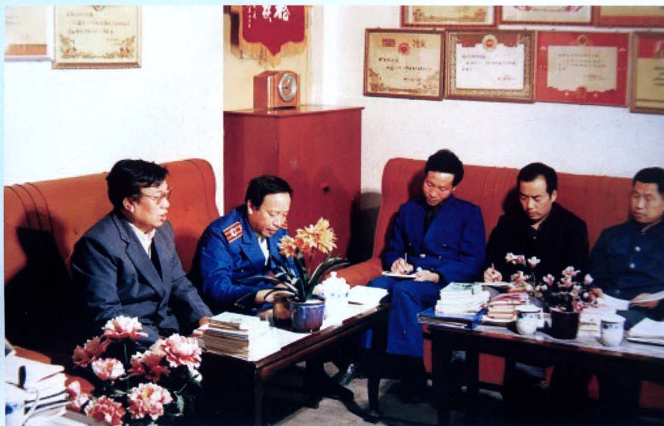
邯郸地区卫生防疫站领导与中层干部一起商讨工作