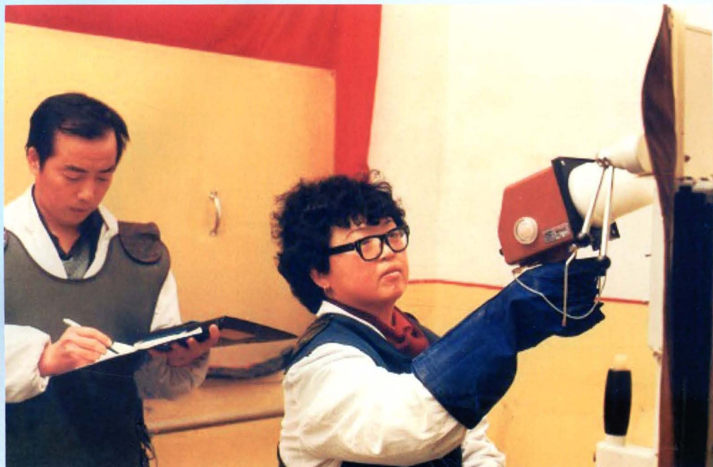
邯郸地区卫生防疫站专业人员对医疗机构开展放射卫生监测