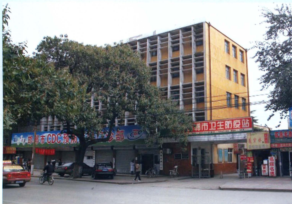
邯郸地区、原邯郸市卫生防疫站机构合并后办公地址