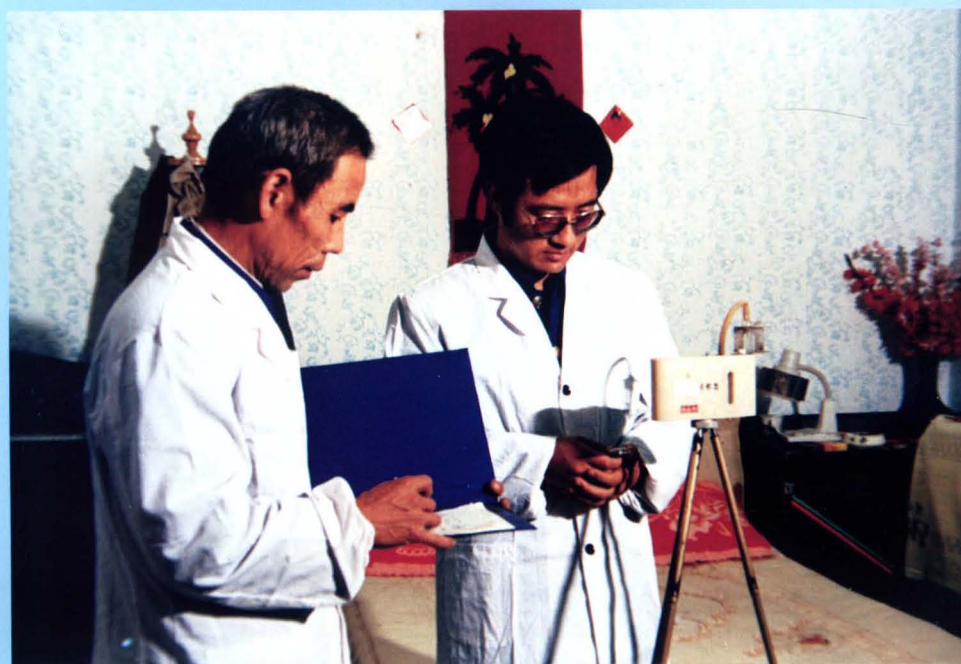
邯郸地区卫生防疫站专业人员开展室内环境卫生监测