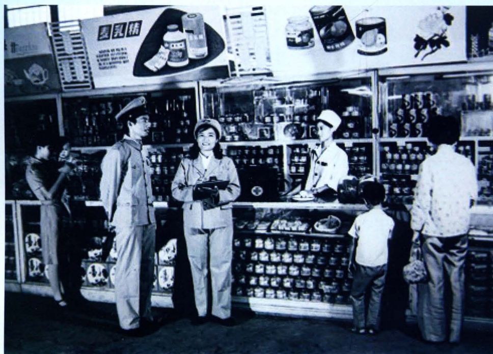
邯郸地区卫生防疫站卫生监督员开展食品卫生“六查”工作