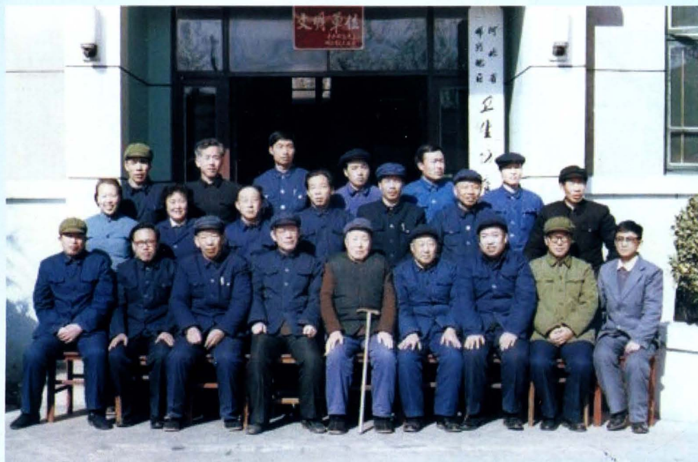
邯郸地区从事卫生防疫工作三十年人员合影