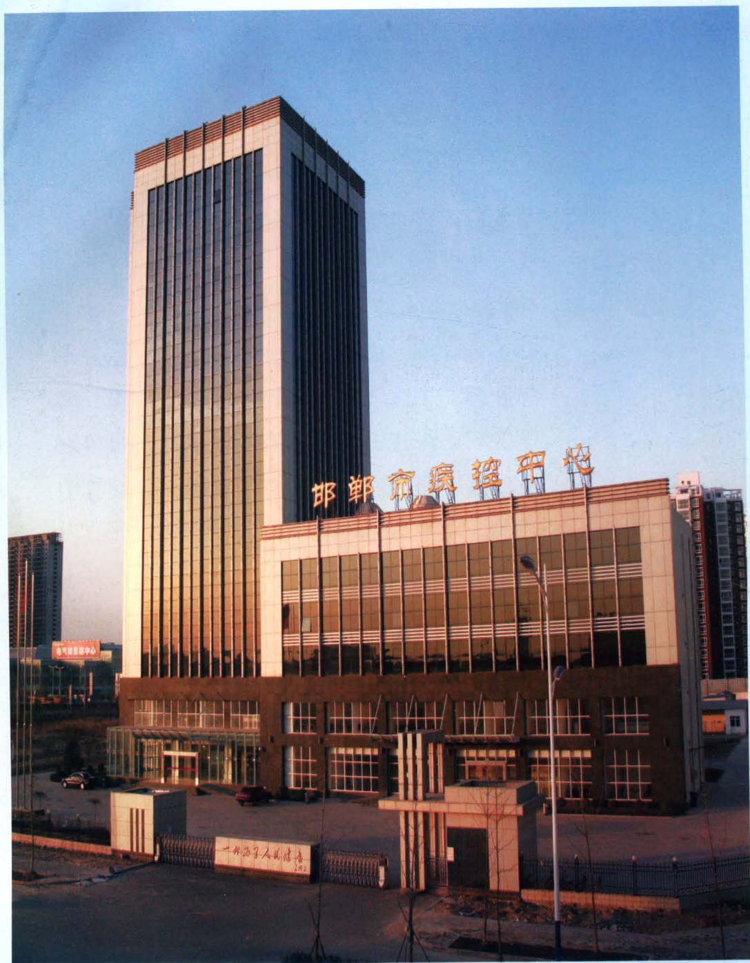
国债项目资金建设的邯郸市疾病预防控制中心大楼