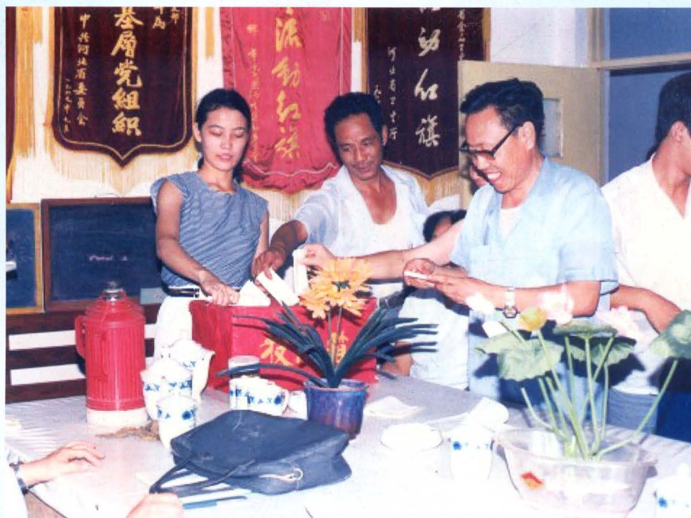
邯郸地区卫生防疫站举行职工代表投票选举