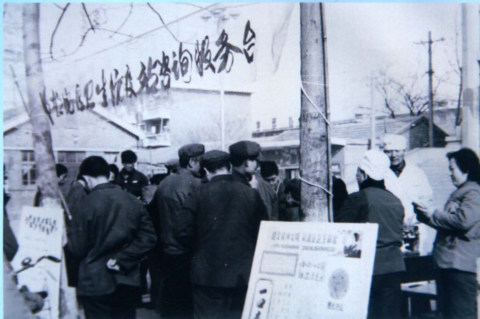
邯郸地区卫生防疫站开展卫生科普街宣传活动