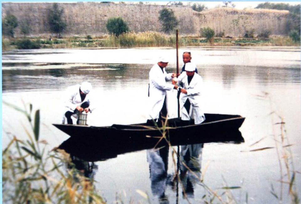
邯郸地区、邯郸县卫生防疫站专业人员开展滏阳河水质监测