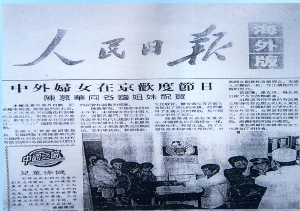
《人民日报》（海外版）刊登邯郸地区卫生防疫站 创办的“儿童计划免疫保偿制”报道