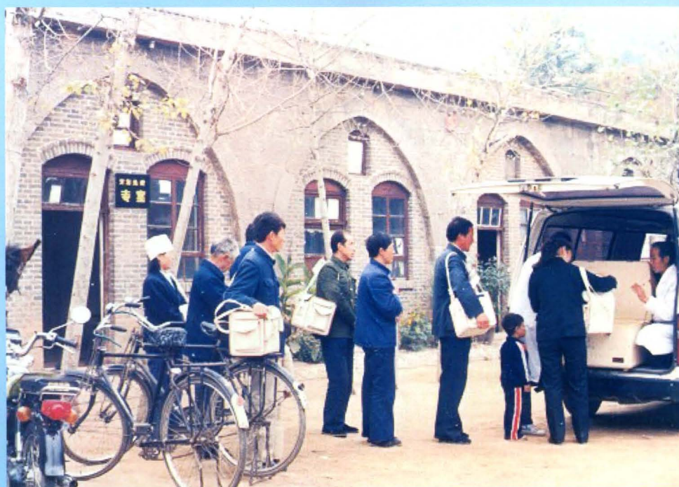
邯郸地区运用冷链设备向乡村卫生防疫医生发放疫苗