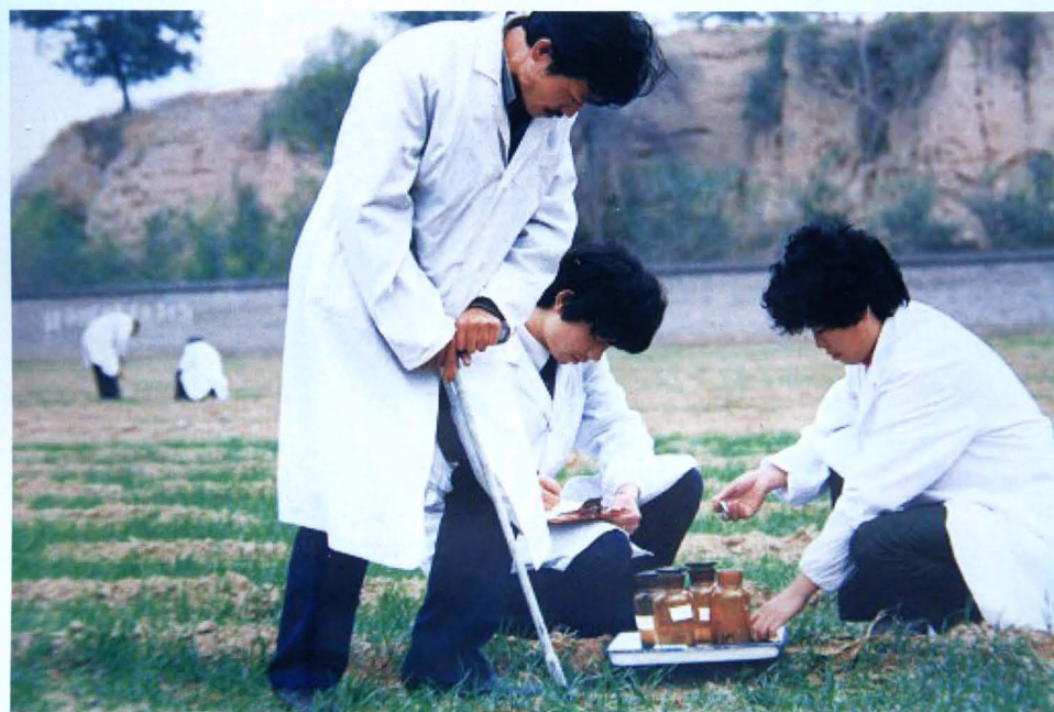
邯郸地区、临漳县卫生防疫站专业人员开展土壤监测