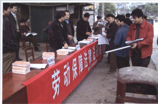
开展多种形式的法律法规宣传咨询活动