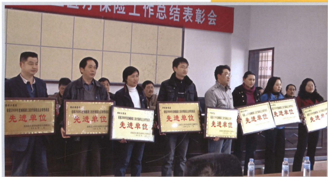
每年都要召开全县城镇职工医疗保险工作表彰会，表彰先进，激励后进