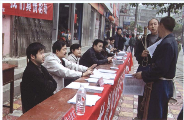
开展多种形式的法律法规宣传咨询活动