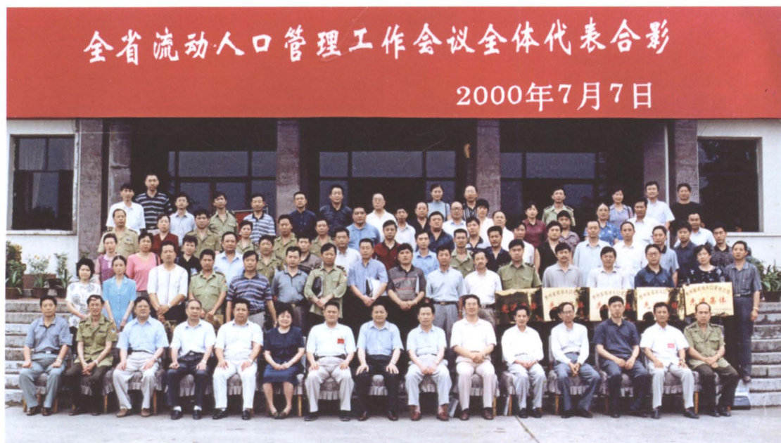
2000年7月，我局被表彰为全省流动人口管理工作先进单位，图为与会代表合影