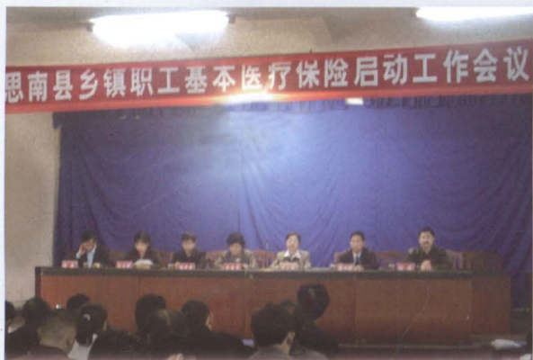
全县乡镇职工基本医疗保险于2005年5月启动，标志着全县乡镇职工基本医疗保险实现全覆盖