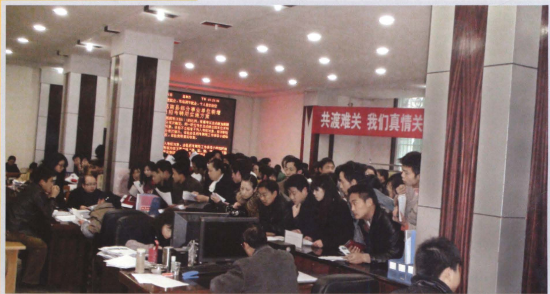
2008年，我局依托贵州省铜仁地区西部思南县农村劳动力转移培训示范基地，建起了较为规范的仲裁庭和人力资源市场，发挥功能，服务群众，收效较好。图为开展大、中专毕业生专场招聘会