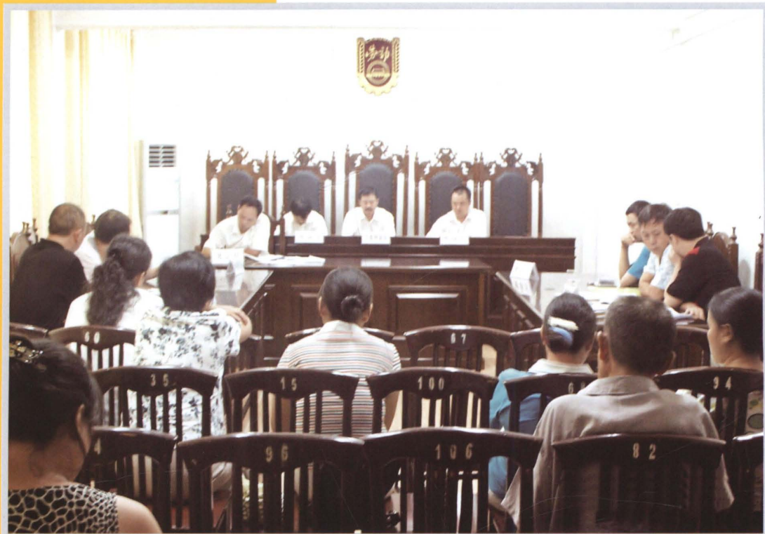
2008年，我局依托贵州省铜仁地区西部思南县农村劳动力转移培训示范基地，建起了较为规范的仲裁庭和人力资源市场，发挥功能，服务群众，收效较好。图为仲裁庭依法开庭仲裁新华书店职工劳动争议纠纷案件