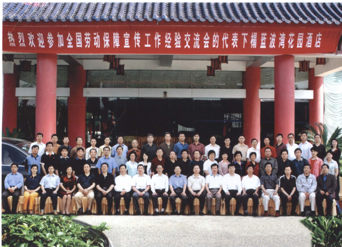
2006年5月，全国劳动保障宣传工作经验交流会在江西萍乡召开，思南与铜仁地区派员参加了会议。思南荣获全国劳动保障宣传工作先进单位，受表彰