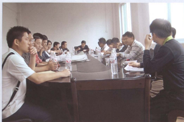
2009年5月15日，贵州省铜仁西部地区思南县农村劳动力转移培训示范基地建设工程验收会议举行。图为验收反馈会议现场