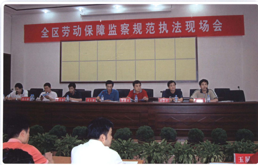
2008年，全区劳动保障工作会议和全区劳动保障监察规范执法现场会议在思南召开。会上，思南县人民政府、县人事劳动和社会保障局分别作了交流发言