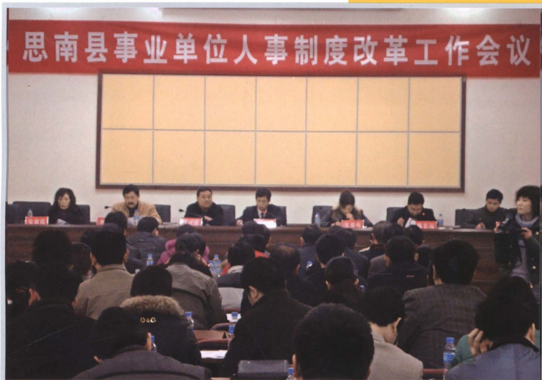
2009年4月，全县事业单位人事制度改革工作会议召开，标志着事业单位岗位设置管理工作步入规范化轨道