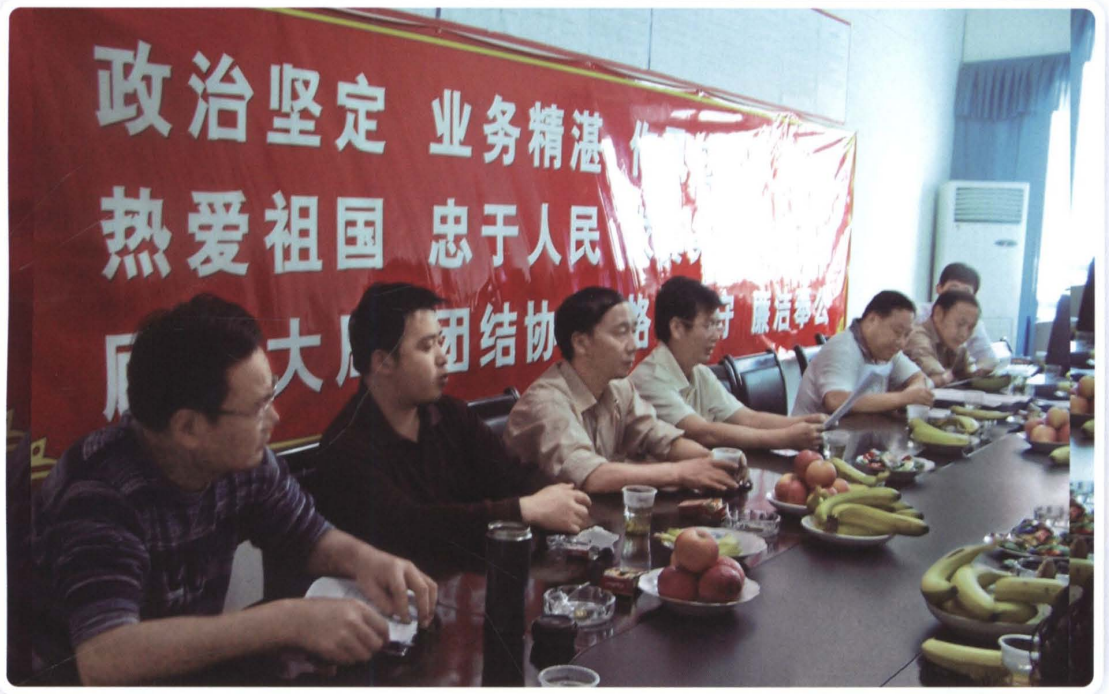
为加强我局作风建设、组织建设、思想建设等，县局经常召开行风评议会议。图为2007年5月召集部分县人大代表和政协委员对县局进行行风评议，接收批评、建议