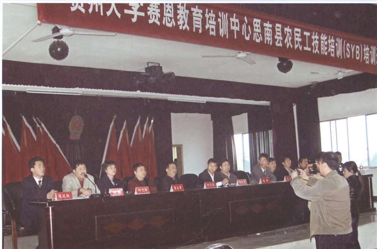
省、地、县三级领导出席我局与贵州大学赛恩教育培训中心举办的农民工技能就业培训班首期开班典礼并做重要讲话