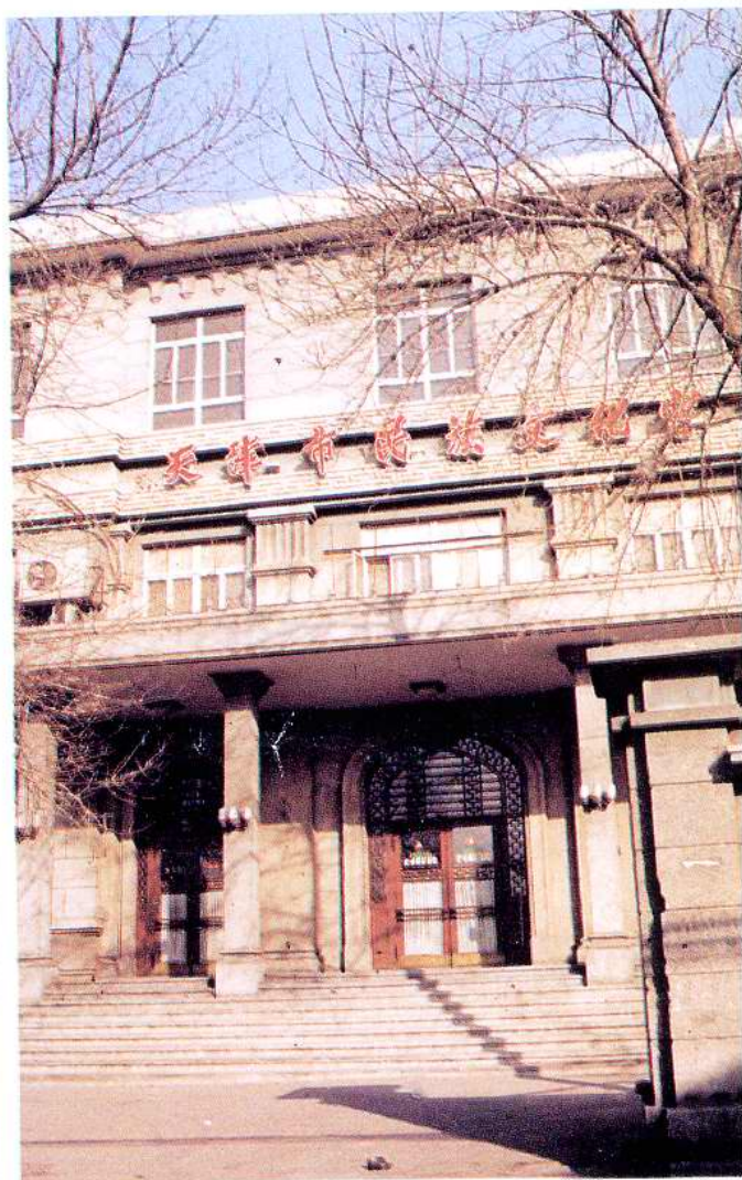
天津市民族文化宫