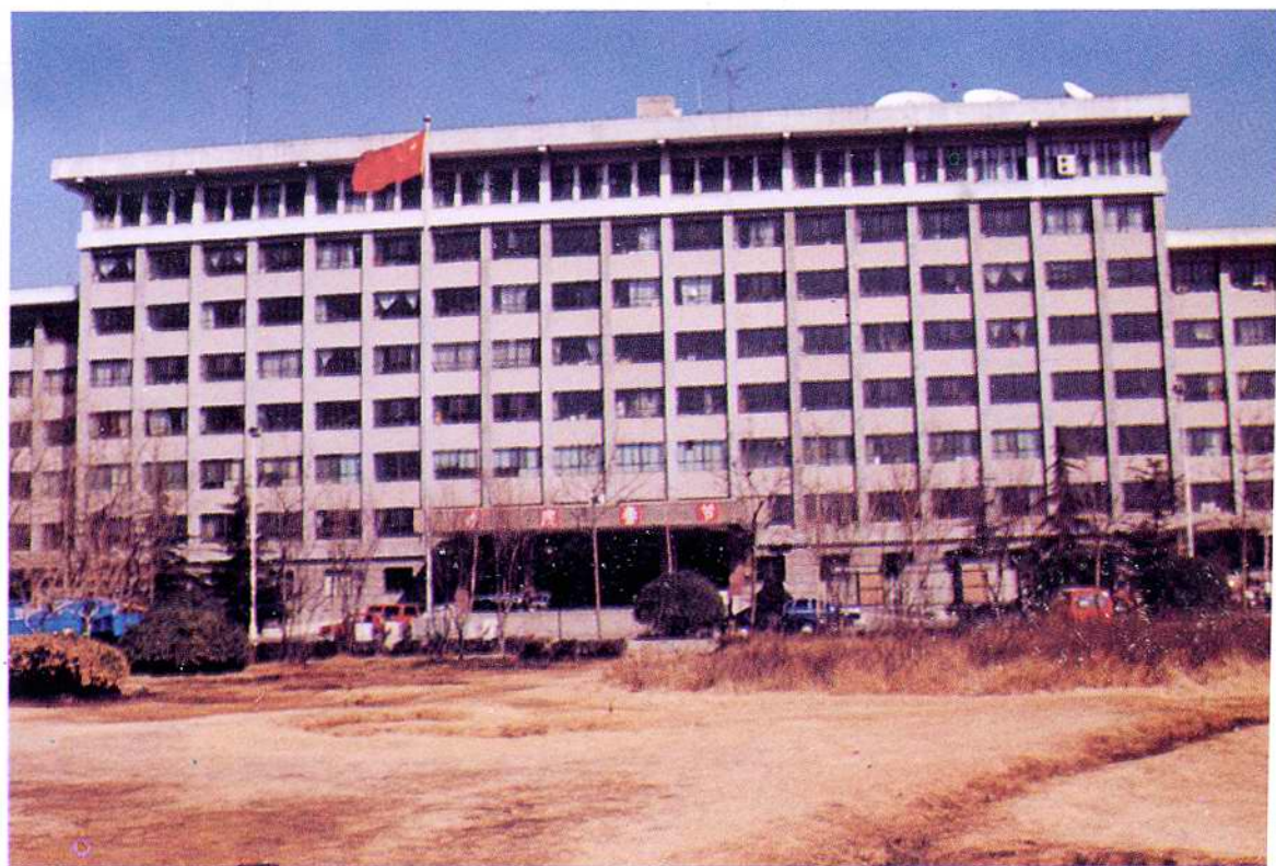
红桥区政府办公楼