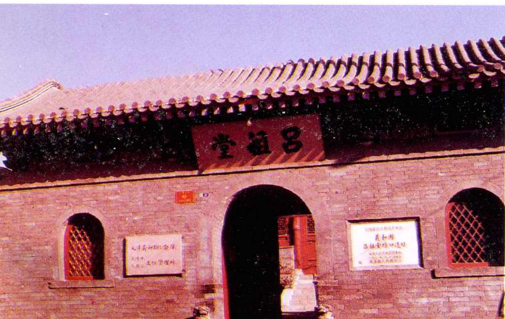
全国重点文物保护单位 义和团吕祖堂坛口遗址