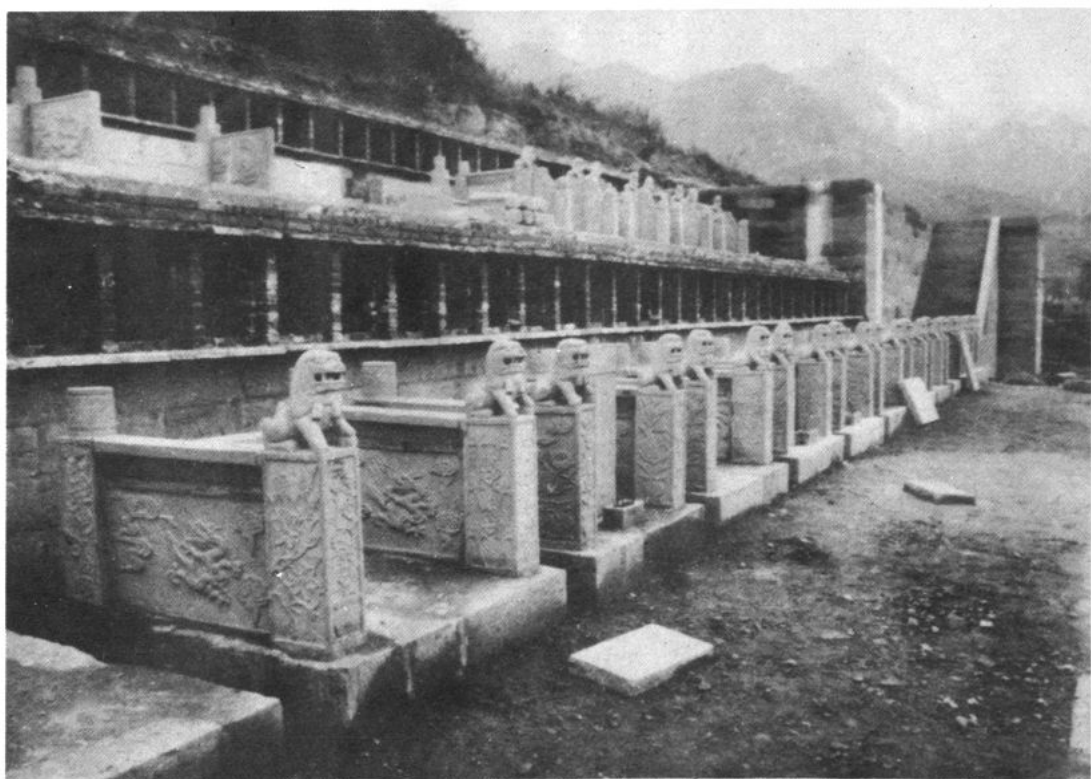
初具规模的璧山公墓一角。