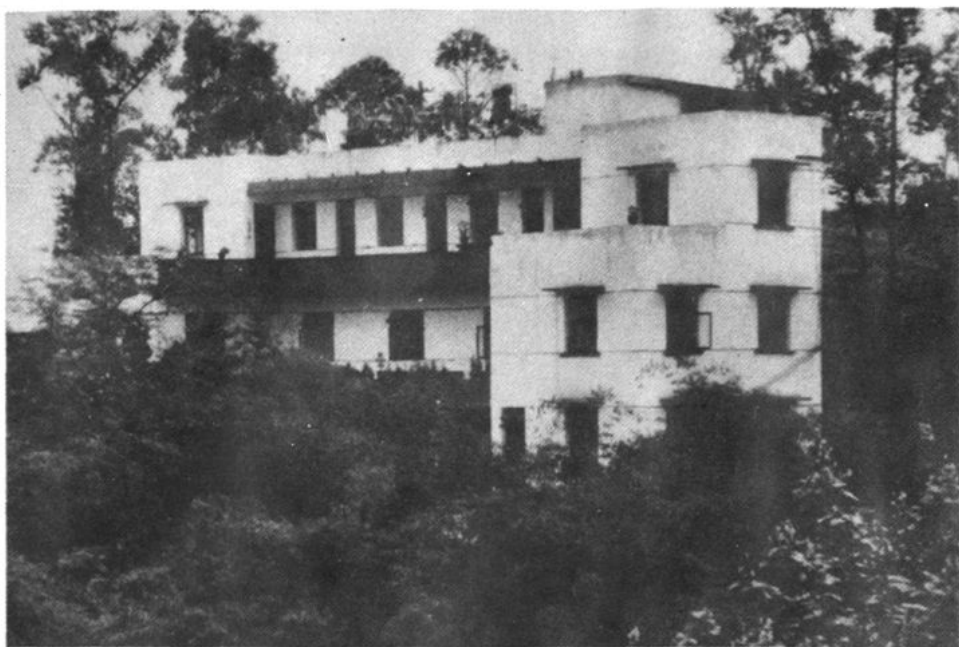
璧山县积极发展福利企业。图为新落成的璧山文风印制厂。