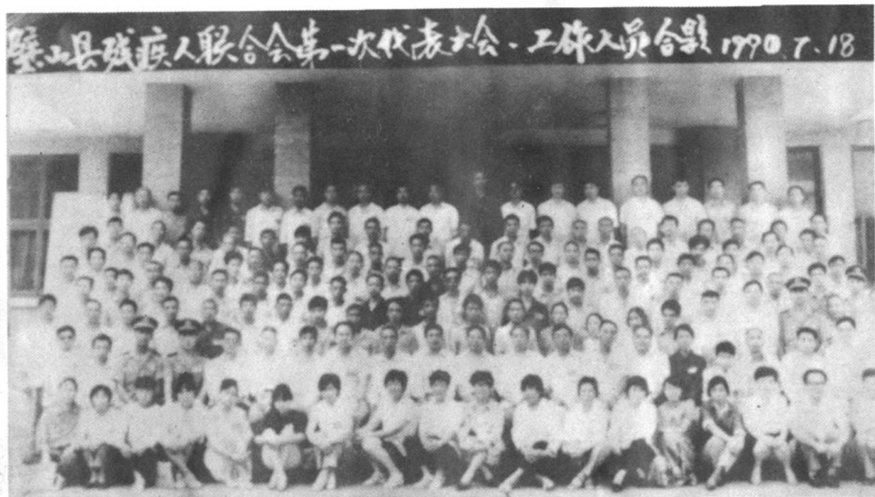
璧山县残疾人联合会第一次代表大会全体代表和工作人员合影