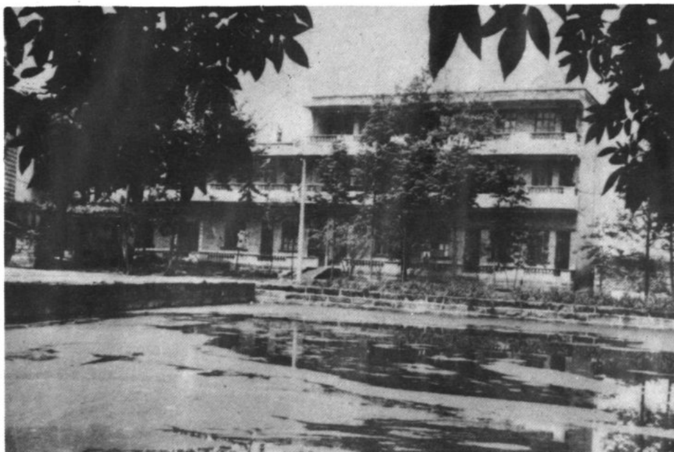
璧山县社会福利院于 1986 年 4 月 22 日举行了开院典礼。图为福利院一角。