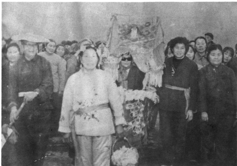
璧山人民载歌载舞、用传统的民族文化——彩船亲切慰问中国人民解放军 56029 部队。