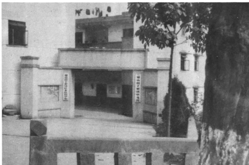
璧山县丁家镇敬老院、丁家镇社会福利中心一角。