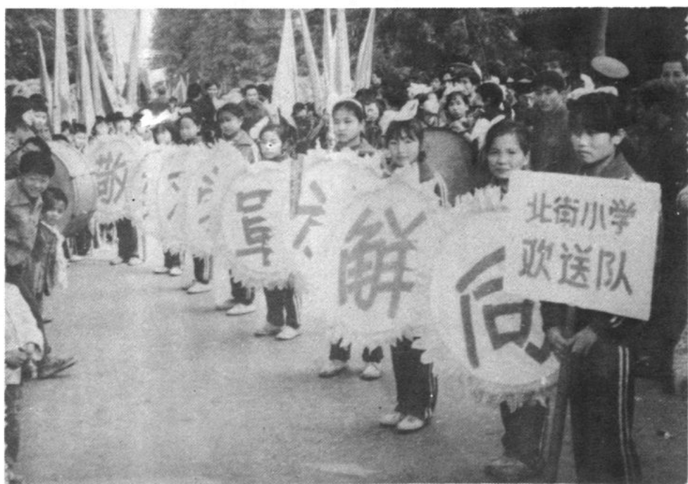
1987 年底，璧山人民热烈欢送英雄的驻璧部队开赴云南老山前线，参加对越自卫还击作战。