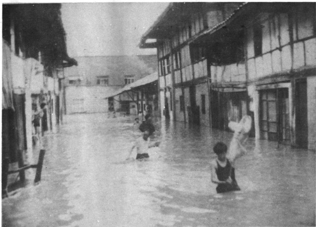
1987年，璧山县先后四次发生旱灾，洪灾和风雹灾等自然灾害。全县38个乡、镇普遍受灾，损失严重。因灾死亡8人，伤22人，死亡大牲畜33头，损坏房屋1745间、倒塌房屋1325间。图为7月20日璧城镇北街被洪水淹没的情景。