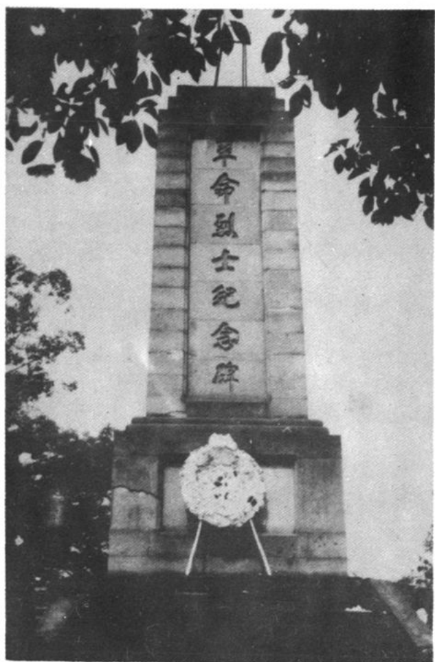
1955年10月峻工的璧山县烈士陵园，座落在璧城镇环境优美，空气清新的凤凰山上。图为革命烈士纪念碑。