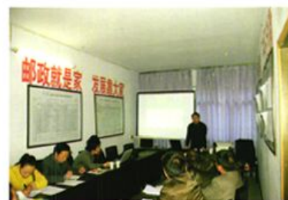
进行邮政业务培训