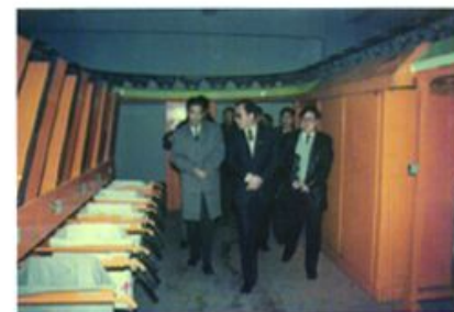
1996年12月17日邮电部长吴基传 视察永川市邮电局