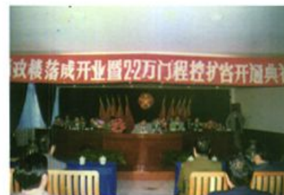
1996年8月邮政招大楼落成 2.2万门程控开通典礼