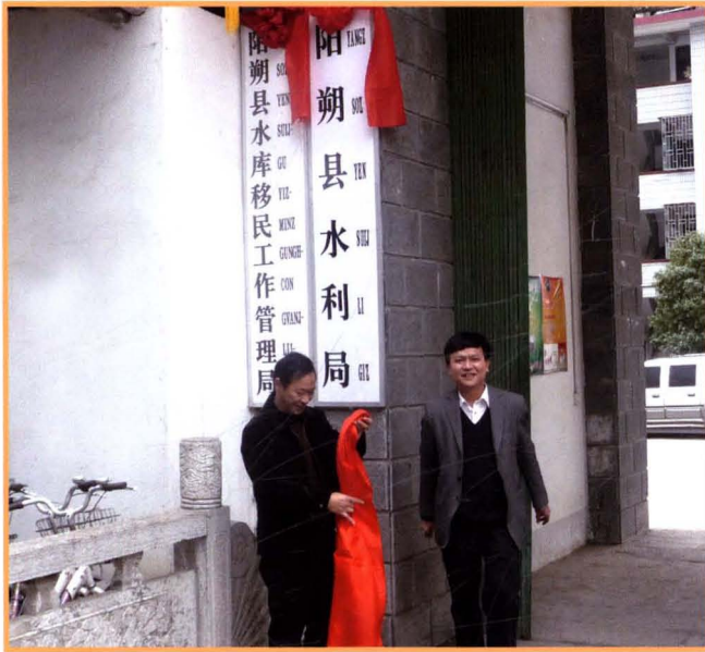
2011年2月8日，阳朔县水利局举行揭牌仪式