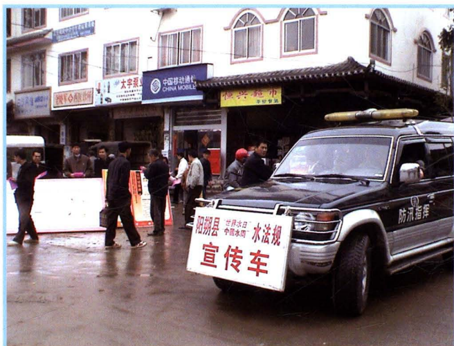
2005年3月24日，在白沙镇农贸市场开展水法规宣传