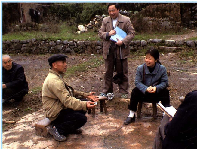
深入农村向农户宣传水法规（摄于2005年3月30日）