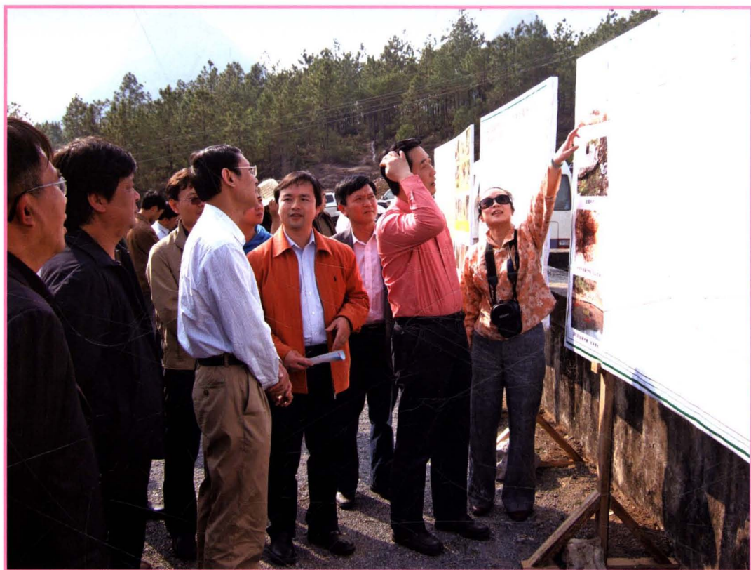
2009年2月11日， 国家部委联合调研组水利小组到顺梅水库实地调研