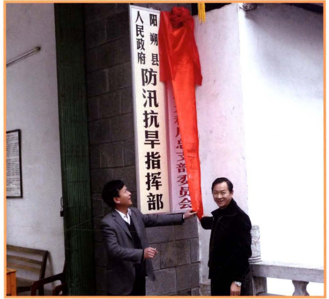
2011年2月8日，中国共产党阳朔县水利局总支部委员会举行揭牌仪式