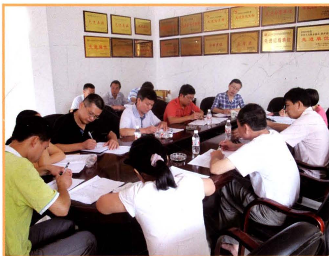
2011年7月12日，县水利局组织水利普查各专业组负责人召开工作会议