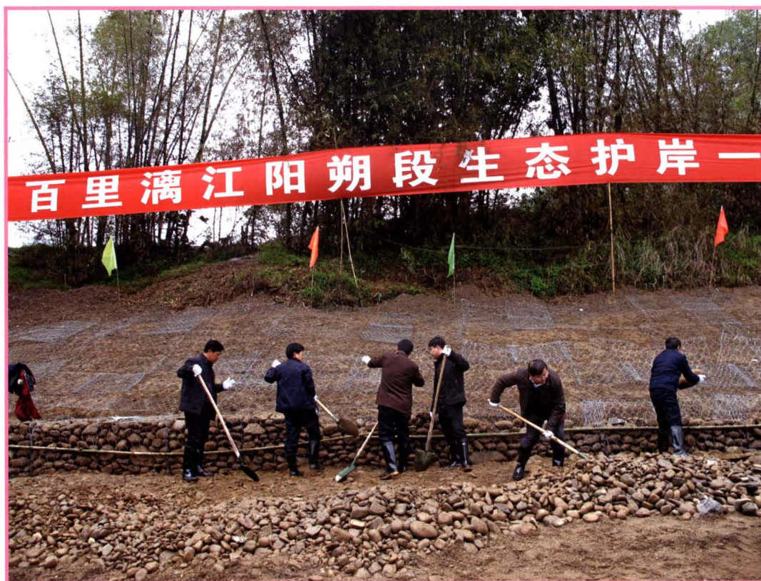
2011年3月12日， 百里漓江阳朔段生态护岸 一期工程正式启动