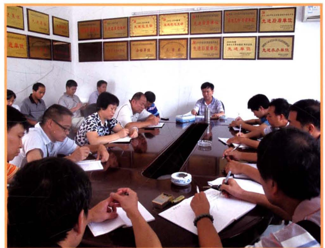
2012年7月30日，县水利局在会议室召开《水利志》编修会议