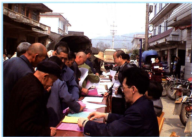
利用乡镇圩日开展法律法规宣传（摄于2005年4月3日）