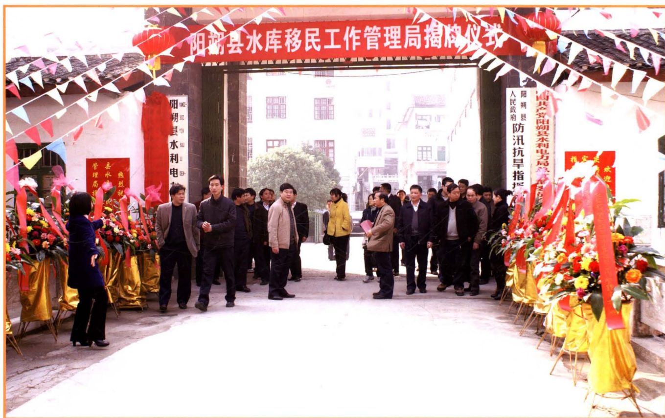
2010年1月19日，阳朔县水库移民工作管理局挂牌