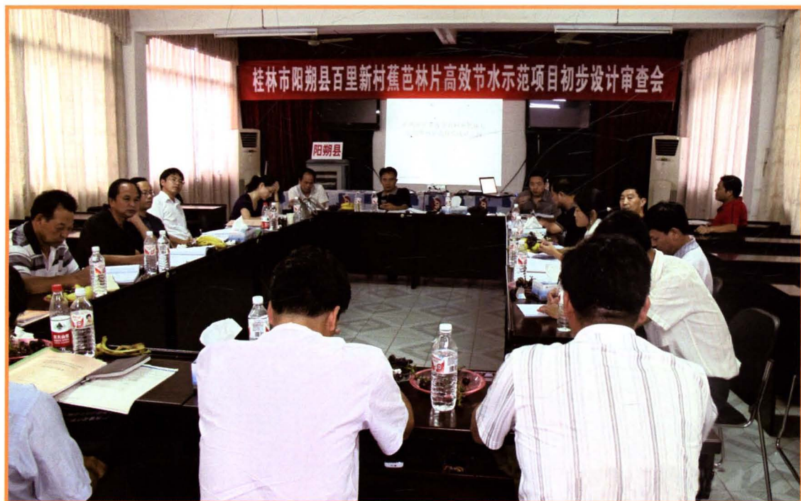
2010年9月2日，阳朔县百里新村蕉芭林片高效节水示范项目初步设计审查会现场