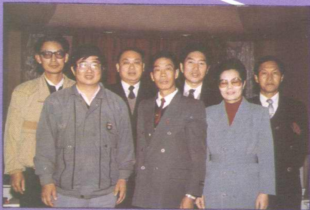
编审领导小组全体人员合影