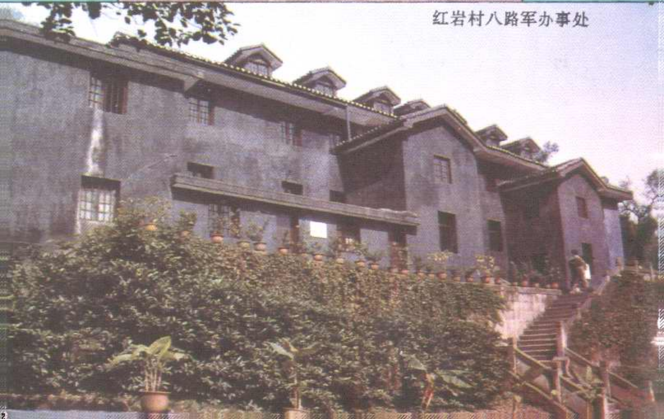
红岩村八路军办事处