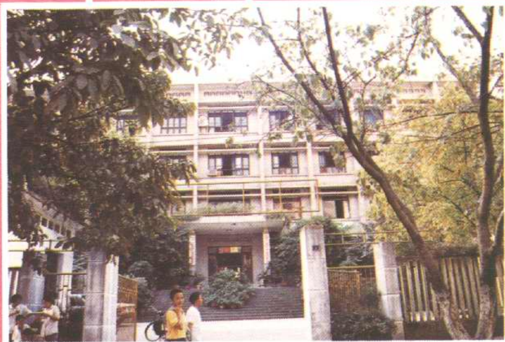
中共沙坪坝区委办公大楼 (位于双巷子)