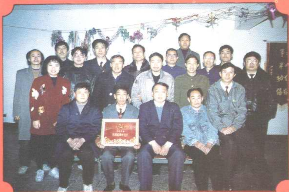
党支部全体党员合影