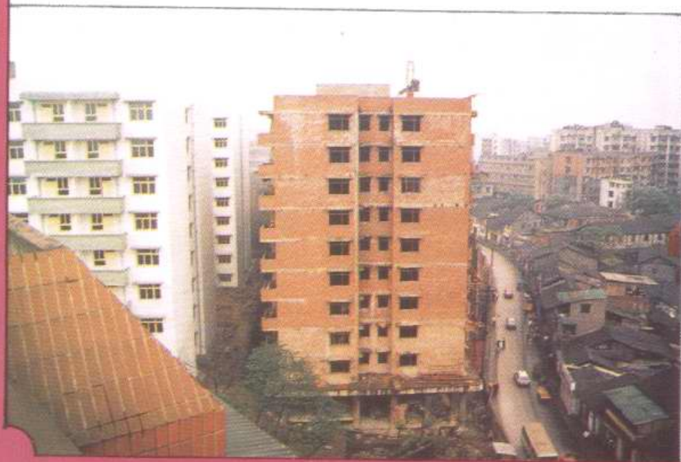
改造中的沙正街(重庆大学校前区工程)