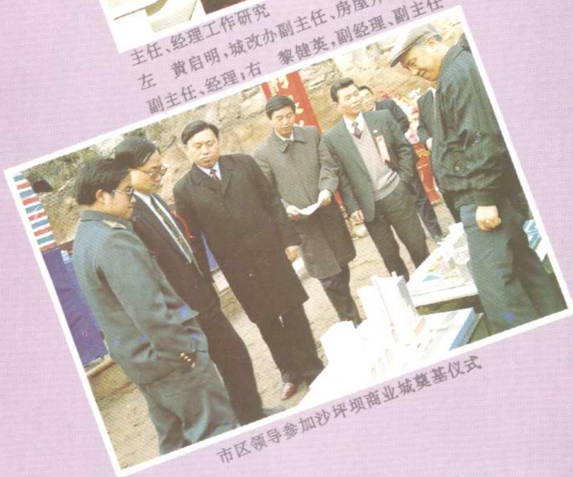
市区领导参加沙坪坝商业城奠基仪式