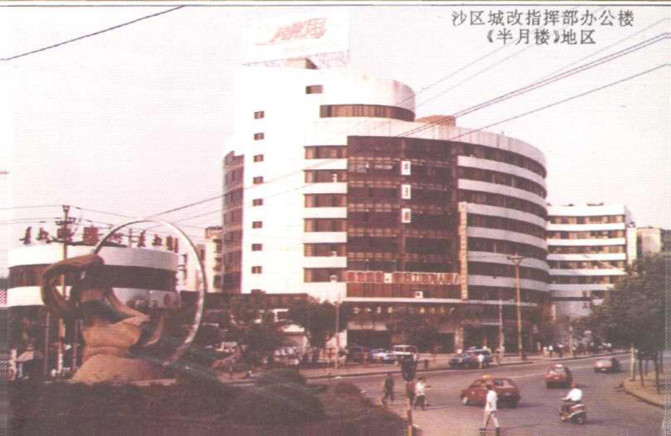
沙区城改指挥部办公楼 《半月楼》地区