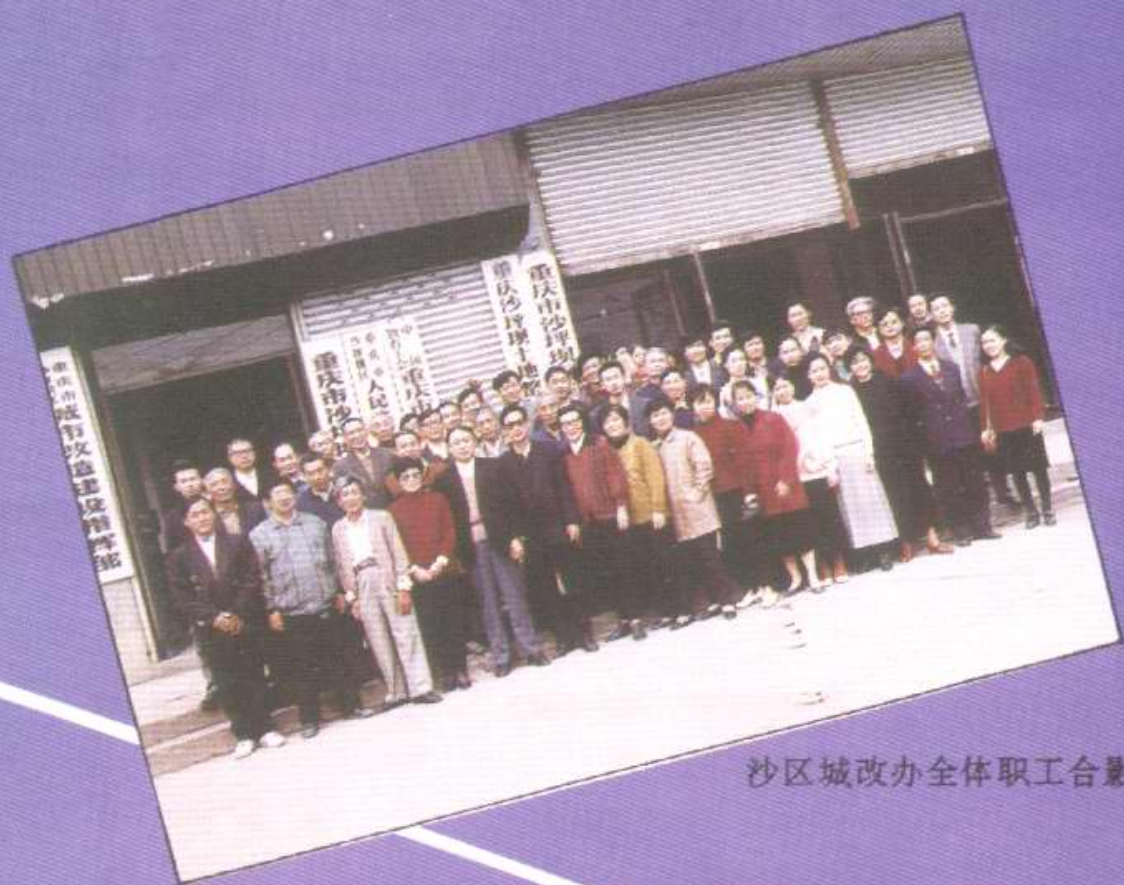
沙区城改办全体职工合影