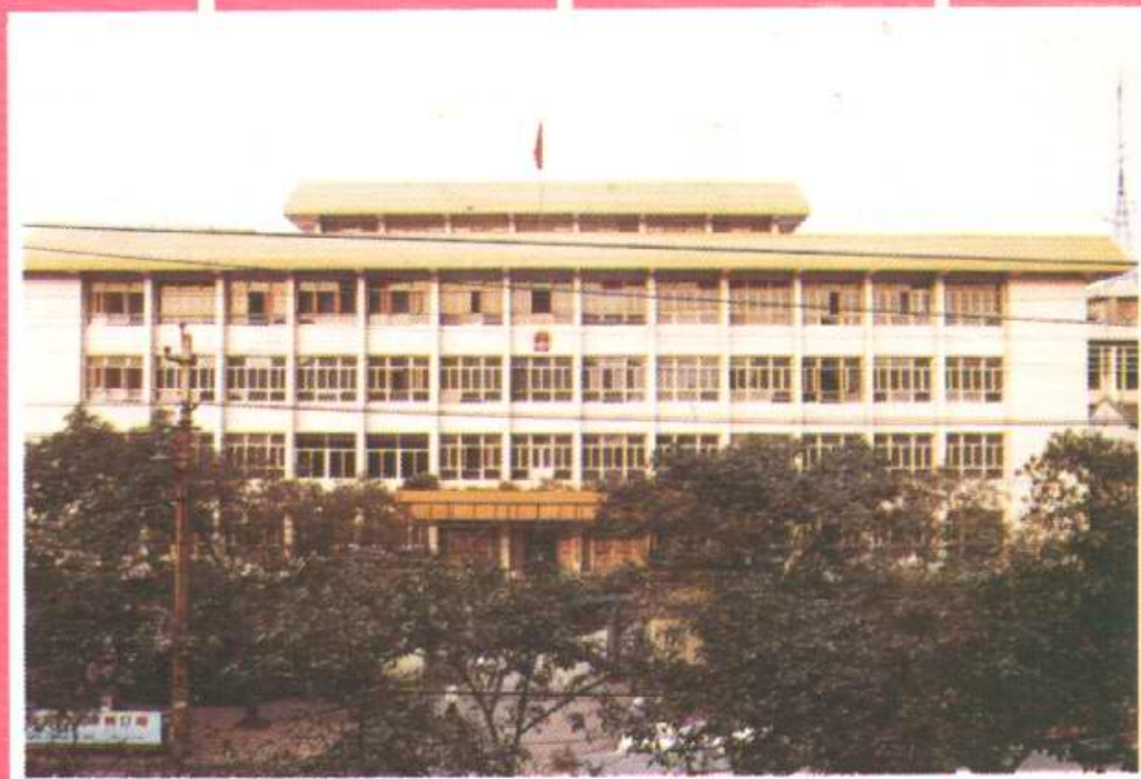
沙坪坝区人民政府办公大楼 (位于小新街 40 号)