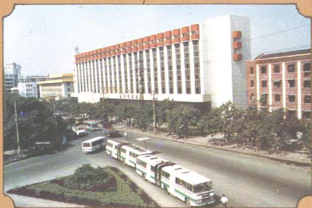
改造一新的小龙坎新街