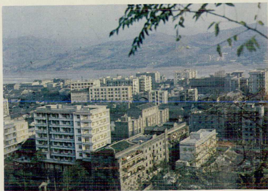
名山镇城市新貌，建筑群一角。