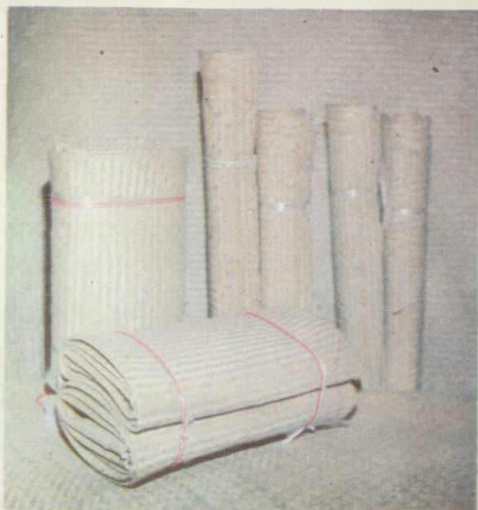
包鸾席：曾列入广州交易会展销。