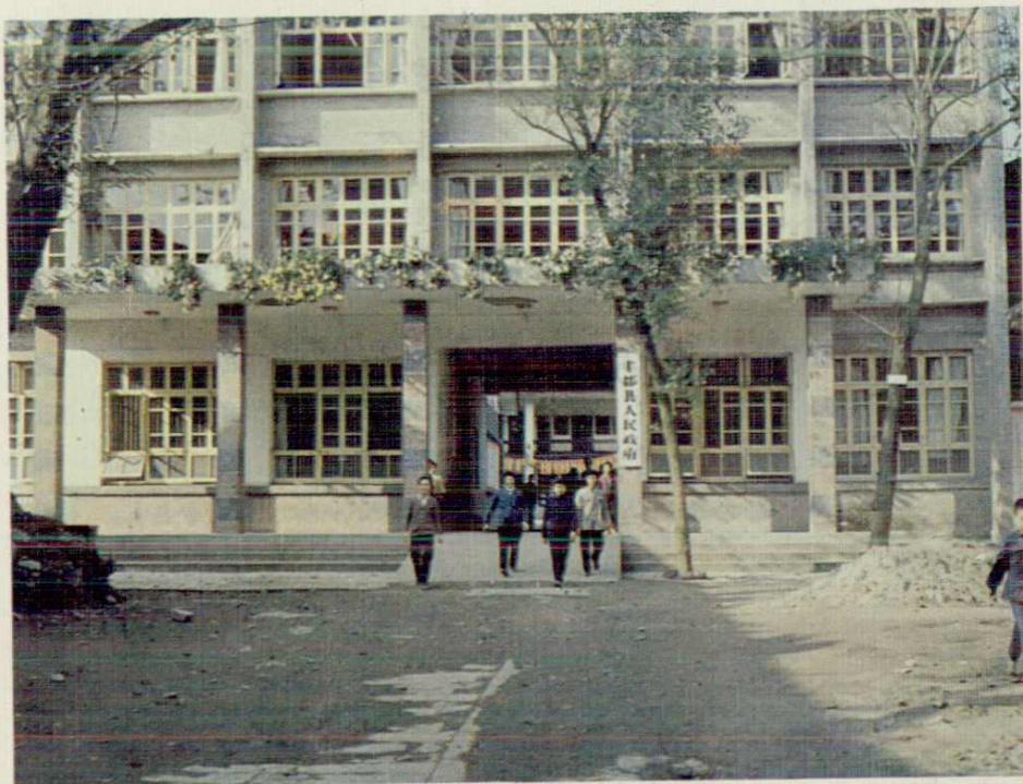
丰都县人民政府办公大楼。