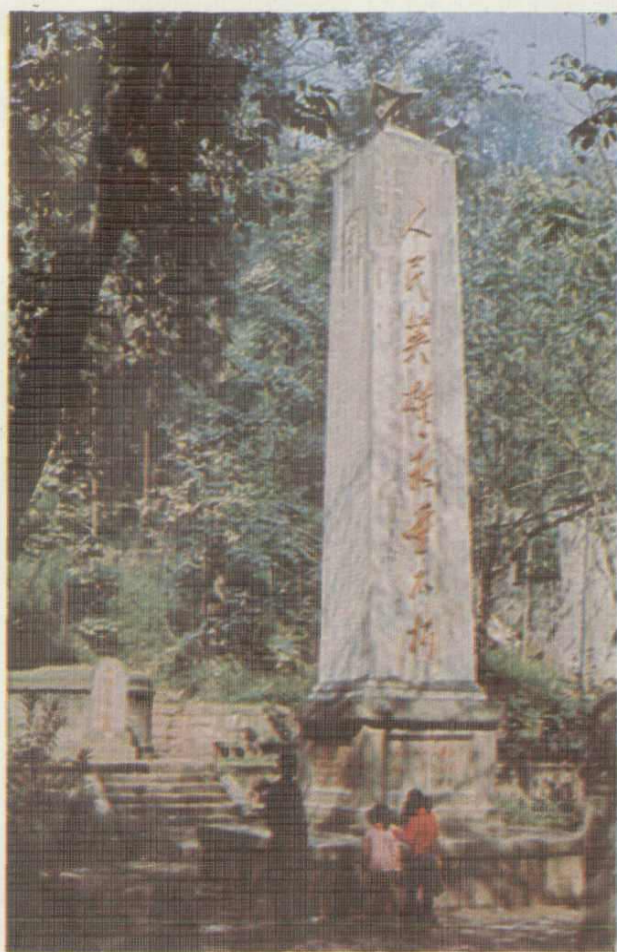
烈士纪念塔 纪念墓