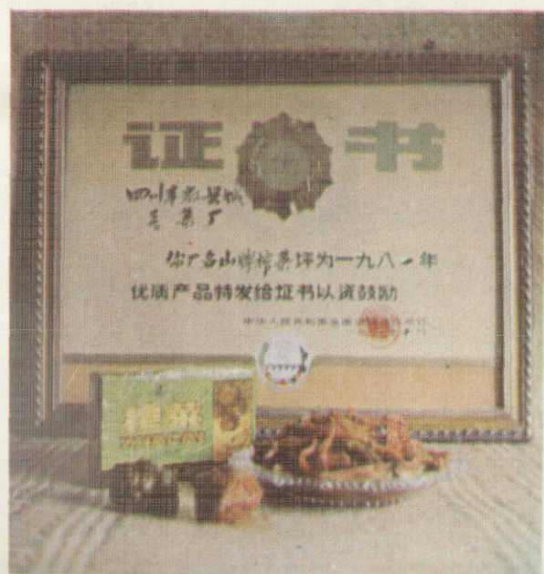
榨菜：一九八二年荣获全国 优质产品第一名。