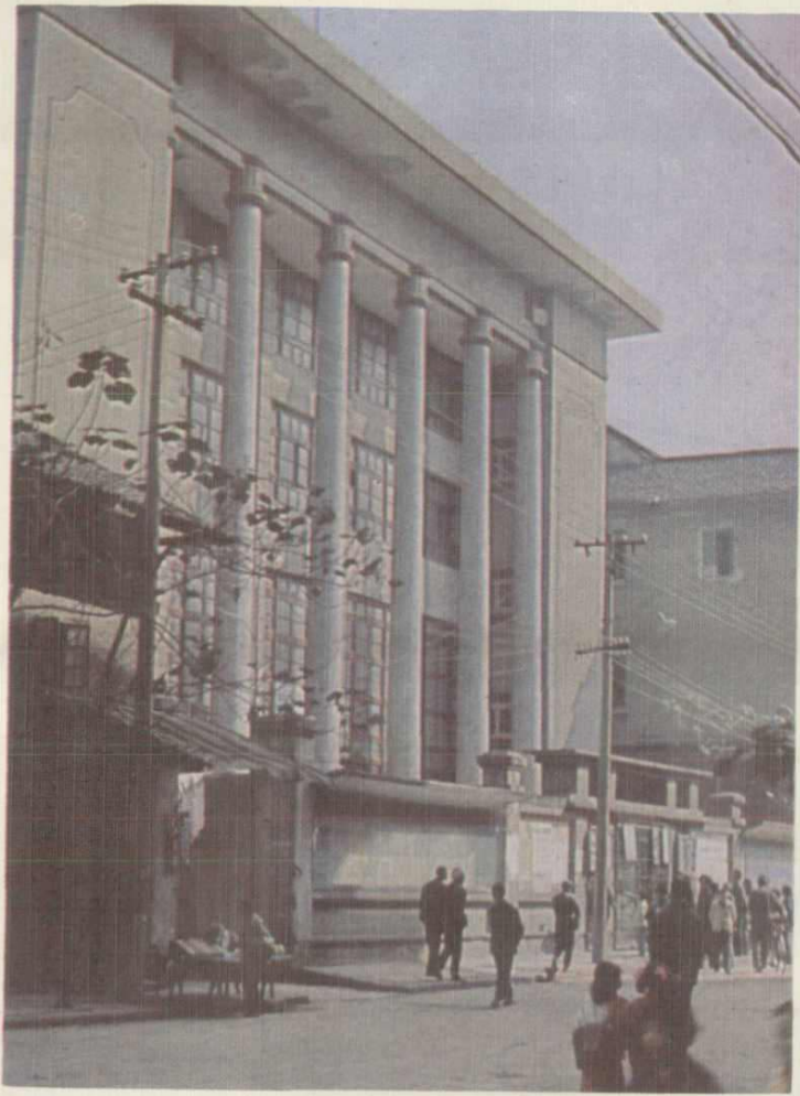
丰都县人民大会堂