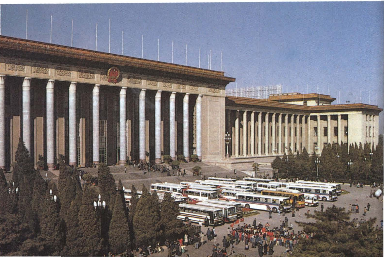
4 各族人民代表共商国家大事的场所——人民大会堂