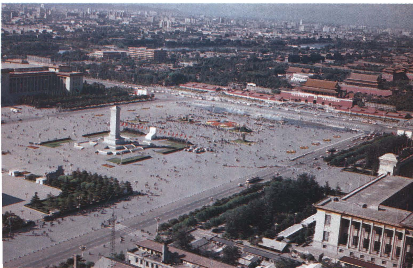
2 宏伟 壮丽的天安门广场