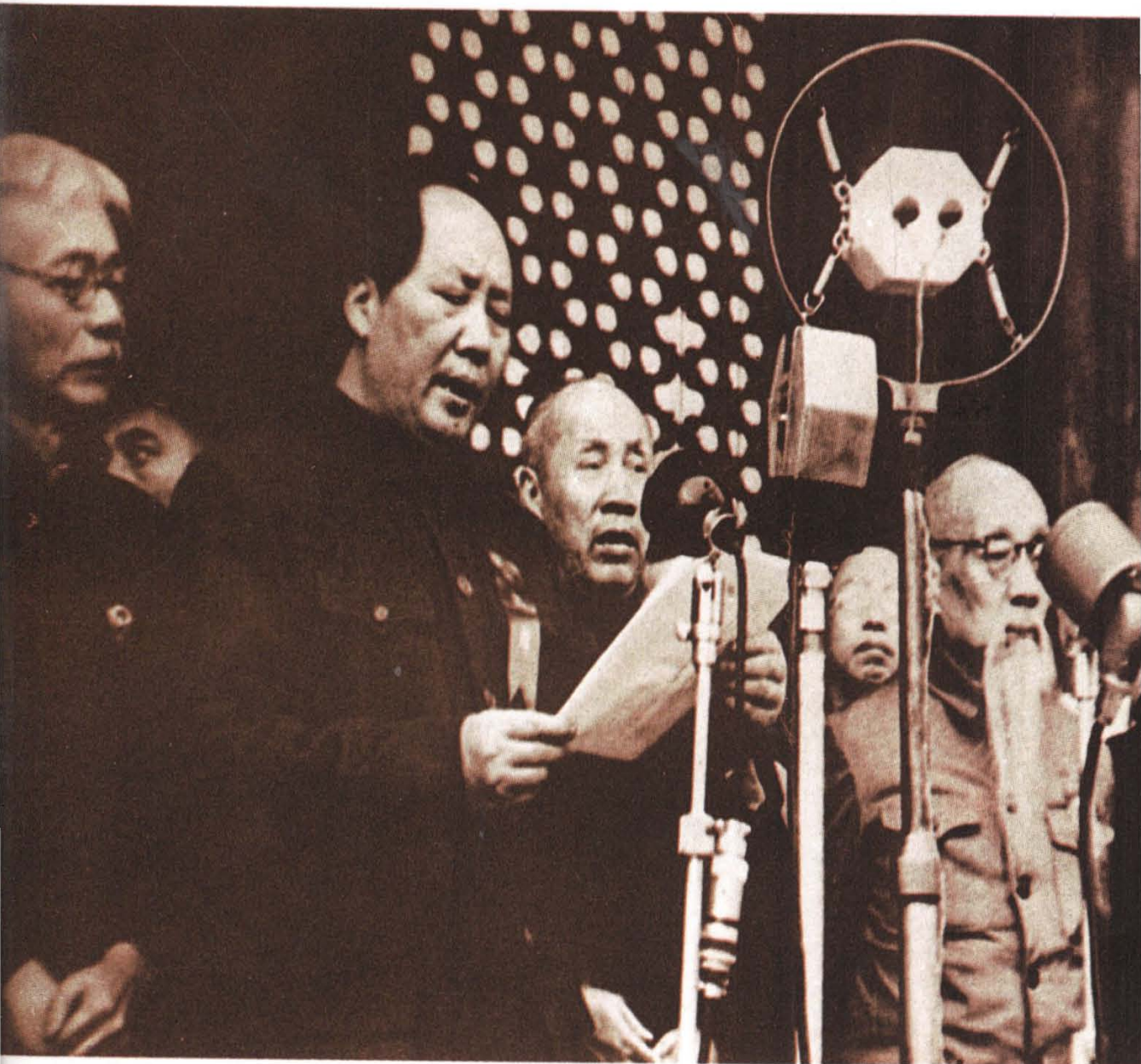
5 一九四九年十月一日，毛泽东主席在天安门上庄严宣告： 中华人民共和国成立了！