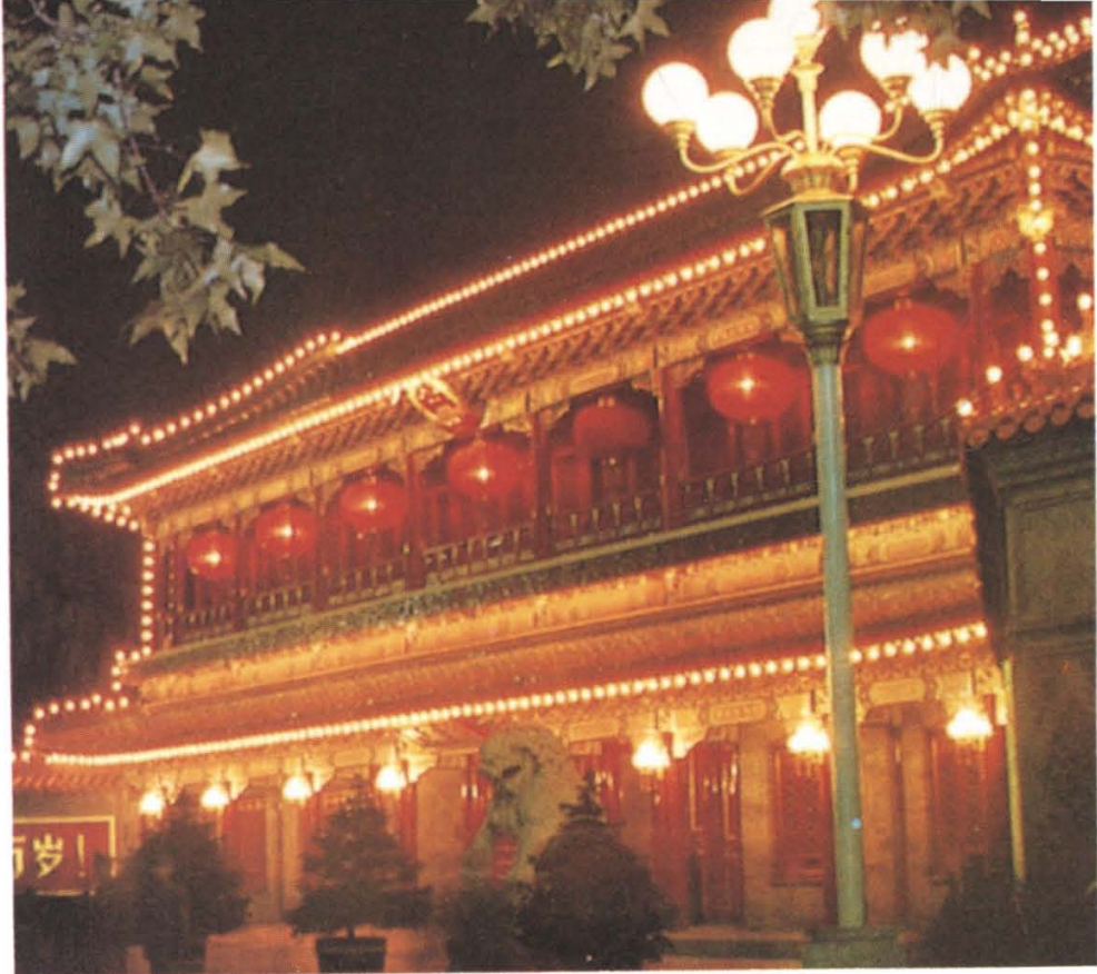
3 中共中央和国务院所在地——中南海