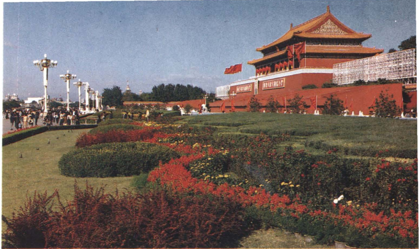
1 庄严肃穆的天安门