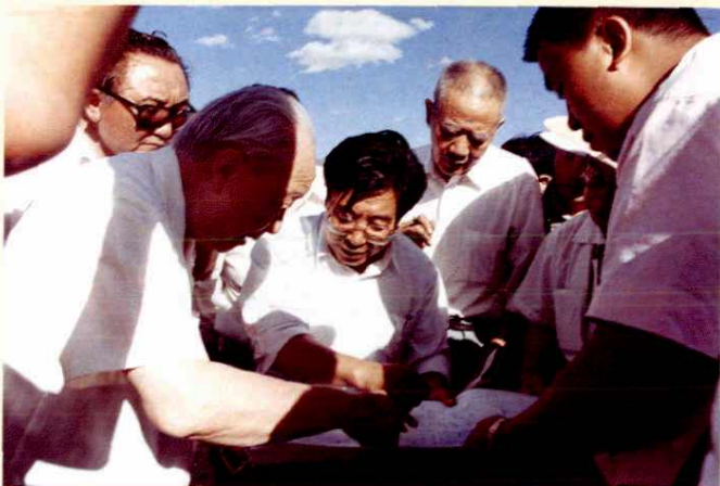
◁ 1992年，全国人大常委会副委员长钱伟长视察福海县