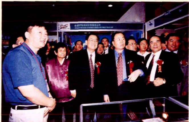
◁ 2000年9月，全国政协副主席毛致用，自治区党委书记王乐泉，自治区党委副书记，自治区主席阿不来提·阿不都热西提参观乌洽会福海展厅