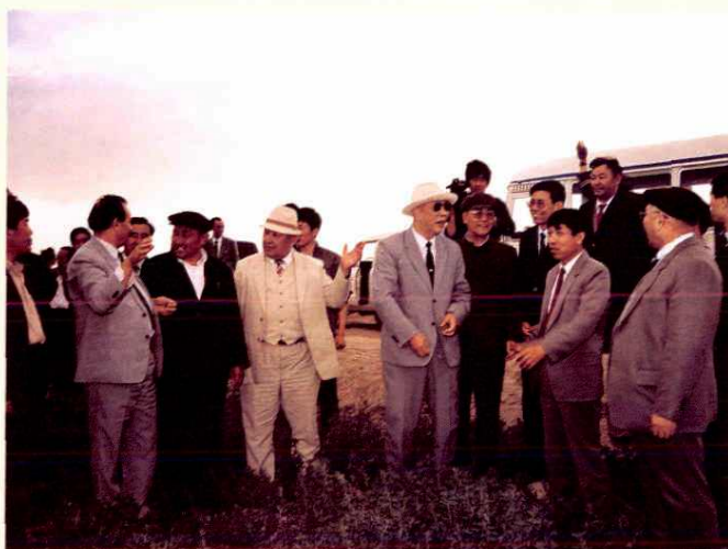
◁ 1990年5月，全国政协副主席、自治区顾问委员会主任王恩茂视察福海县