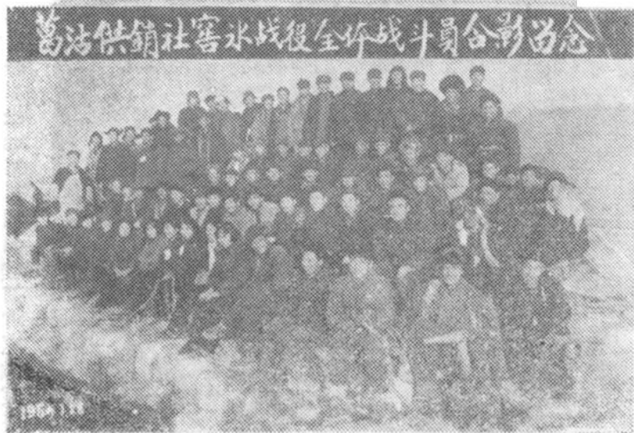
六十年代供销社的同志们