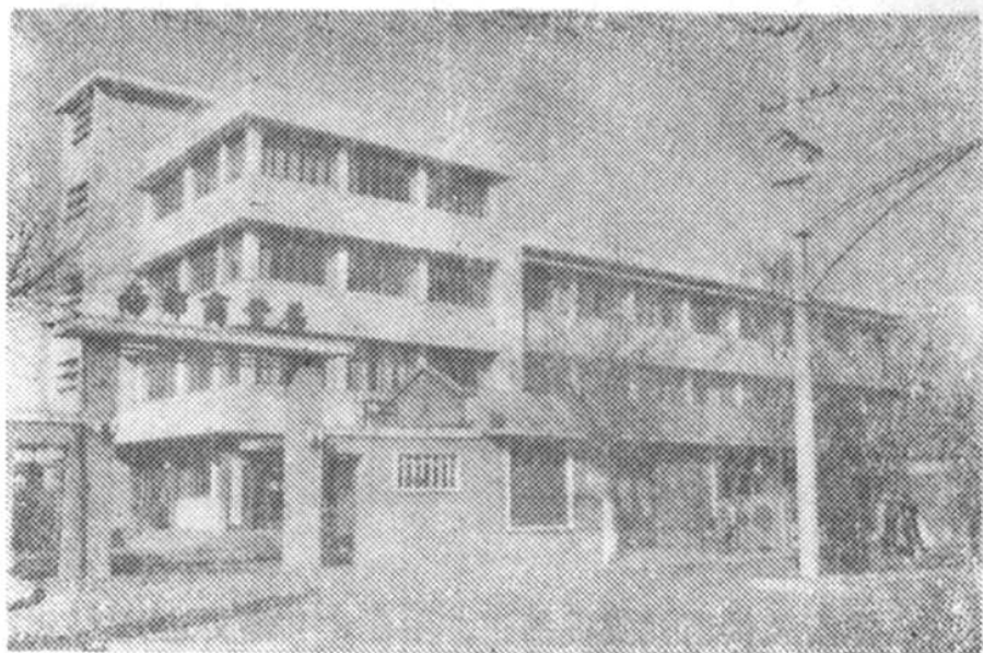
南郊区供销社办公大楼