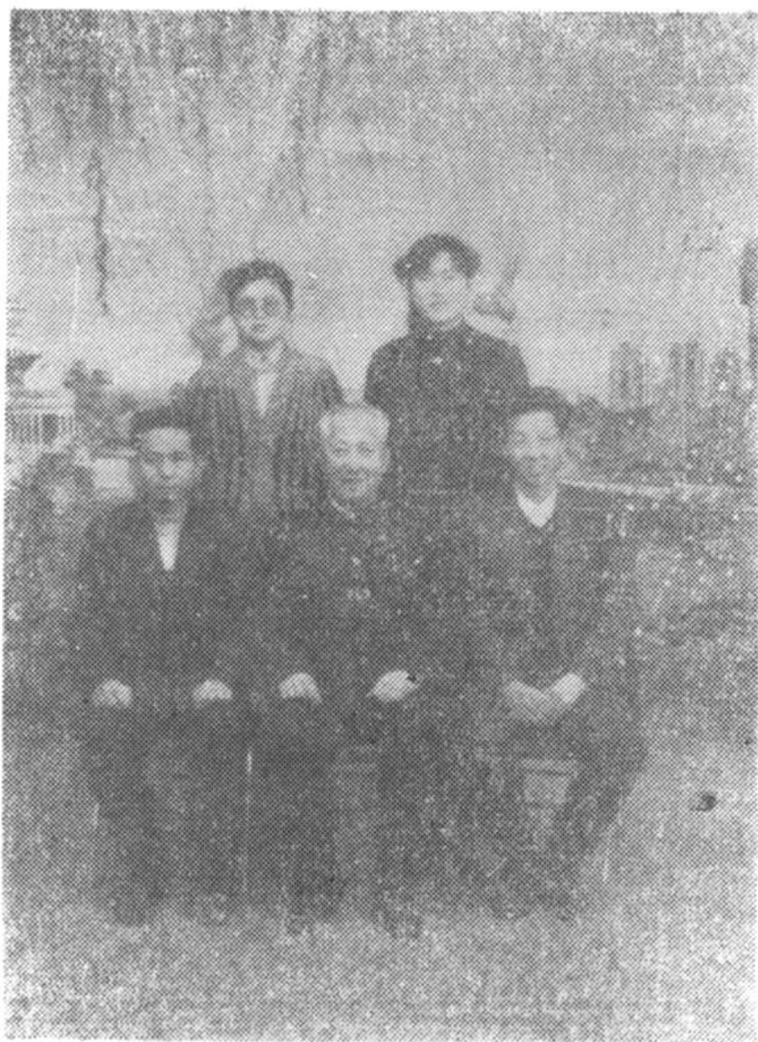
《津南区供销社志》编辑办公室成员